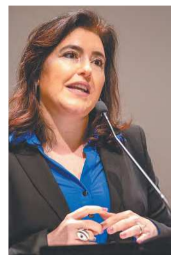
Tebet: contas públicas têm déficit de R$ 231 bi

Assim como o ministro da Fazenda, Fernando Haddad, Tebet reiterou que o governo está preparando uma série de medidas para reforçar o caixa, mas sem