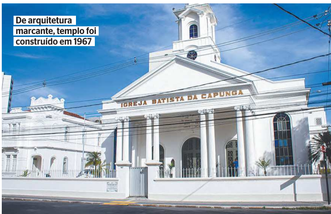
De arquitetura marcante, templo foi construído em 1967

pulos. Não é algo imposto, mas é algo que nós temos convidado a Igreja para entrar nesse processo de um dar a mão para o outro e seguir os passos de Jesus”, explicou o religioso. “Obviamente é um processo difícil, não é fácil, mas esse é o alvo que Jesus deixou pra gente”, Nosso desafio é olhar as multidões como Jesus, ver as multidões com os olhos de Jesus. A Igreja precisa fazer isso para que ela se torne relevante”, reforçou o pastor.