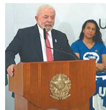
Presidente fez o anúncio ao lado de estudantes

Em fevereiro, o governo federal reajustou as bolsas de estudo de graduação, pós-graduação, iniciação científica e Bolsa Permanência. (Correio Braziliense)