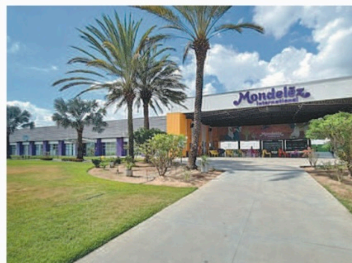
Planta local produz marcas como Bis e Sonho de Valsa

Parte do investimento será direcionada à sustentabilidade. “Temos o objetivo de avançar na construção de uma empresa de snacks mais sustentável, fundamentada na criação de valor para o negócio”, enfatizou o executivo.