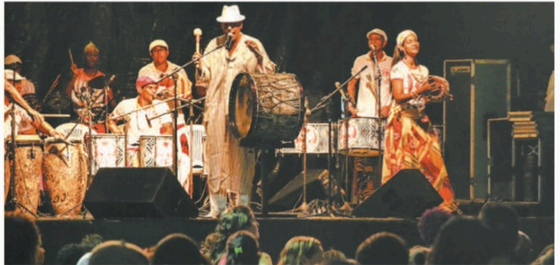
Nova lei promove ajustes nos mecanismos de fomento a manifestações culturais

As principais atualizações dizem respeito à atribuição de atividades e responsabilidades da Secretaria de Cultura, à administração dos recursos do Fundo de Incentivo à Cultura e ao formato de avaliação e deliberação de