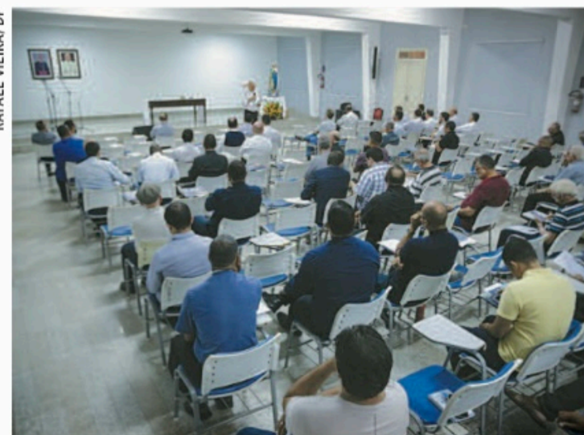
Cerca de 200 padres participaram do encontro, ontem

LIGIA MARIANO local@diariodepernambuco.com.br