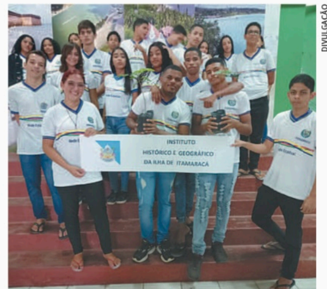
Mais de 30 estudantes participarão da ação na ilha

O Instituto busca realizar um primeiro contato dos estudantes do ensino fundamental, mas também desejam ampliar a ação desta quarta para outras turmas e escolas de Pernambuco, com o objetivo de fazer a data ser mais celebrada.