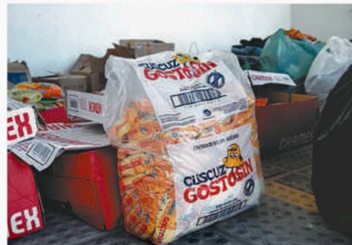
Moradores da rua também recebem doações às vítimas