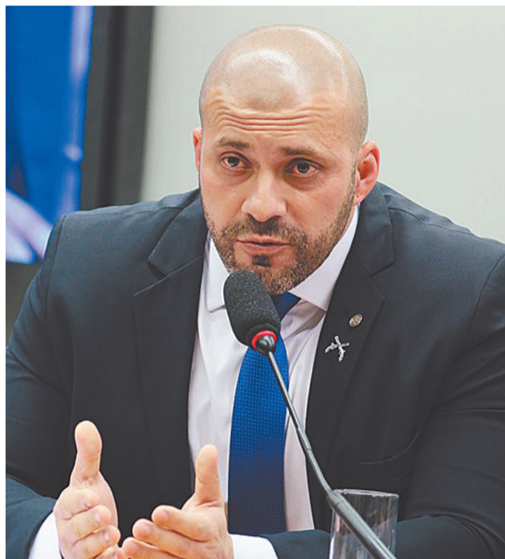
Perdão da pena foi concedido pelo ex-presidente Bolsonaro um dia após a condenação de Silveira

Em fevereiro, após deixar o mandato, Silveira foi preso por descumprir regras da detenção domiciliar