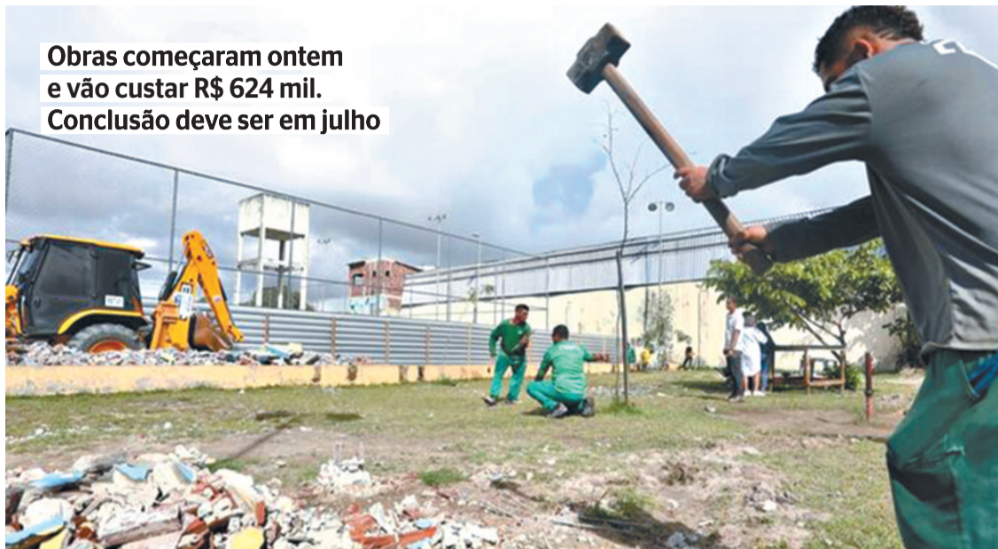
Obras começaram ontem e vão custar R$ 624 mil. Conclusão deve ser em julho

da em toda a cidade, com soluções específicas e que estejam em sintonia com o seu entorno. Esse método garante que toda criança recifense tenha acesso às mesmas qualidades proporcionadas por estes espaços. O projeto é elaborado a partir do “Guia de princípios para remodelação das praças para infância”, organizado pela Prefeitura do Recife, visando a requalificação paisagística que asse-