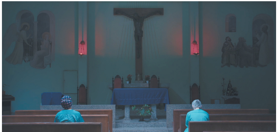
Exibição acontece na Faculdade Tiradentes-Afya e no Cinema da Fundação