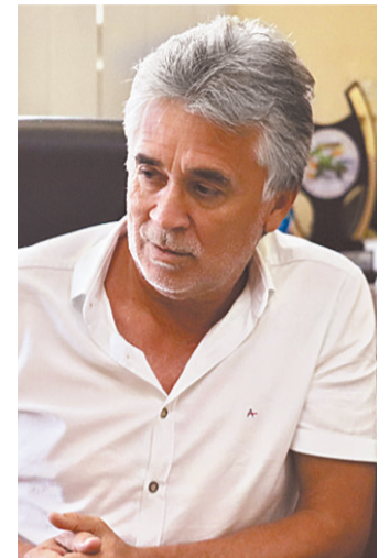
Gestão socialista conta com aprovação de 80%