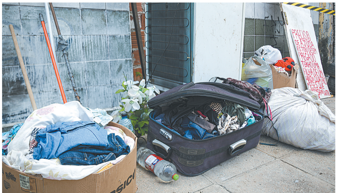
Imóvel estava em situação precária. Moradores retiraram ontem seus pertences