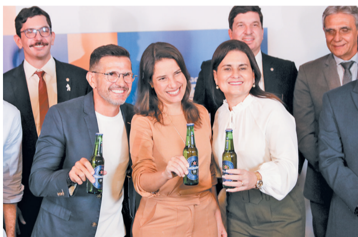
Anúncio foi feito durante coletiva na sede do Governo de Pernambuco