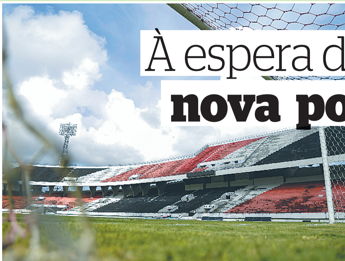
Santa começa na segunda-feira caminhada na Série D do Brasileiro contra o Iguatu

do início da temporada e agora a gente conseguiu arrumar. E na segunda-feira vai ser um time aguerrido, um time que vai buscar a bola e o jogo o tempo todo”, destacou o meia, que trabalha pela primeira vez com o técnico Felipe Conceição.