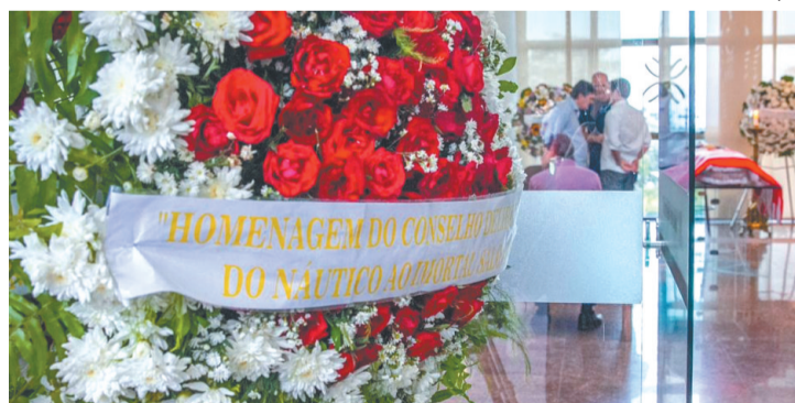
Náutico decretou luto de três dias como homenagem