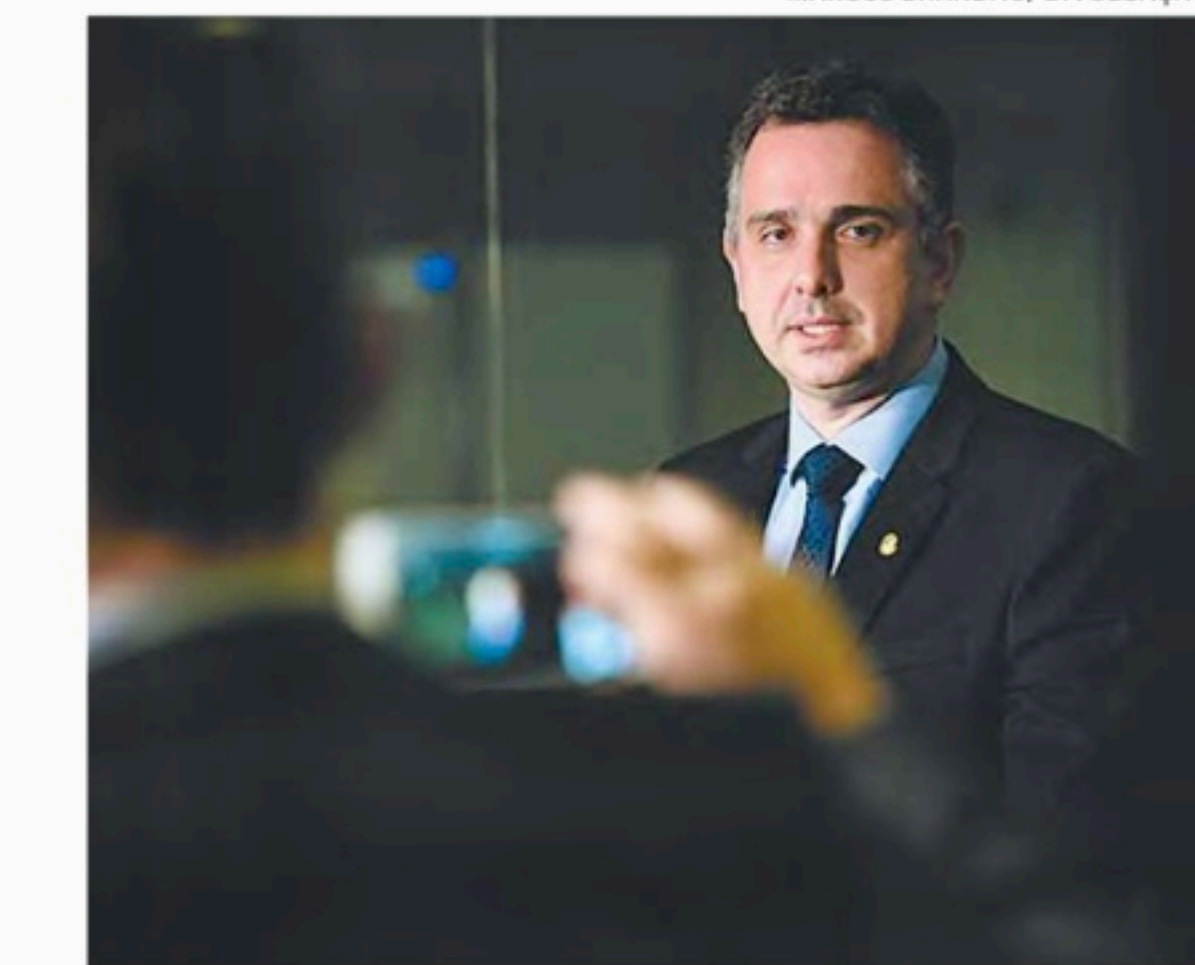
Declaração foi dada em reunião com diretores da Fiesp

“Enquanto as reformas política, trabalhista e da previdência tinham um grau de obvieda-