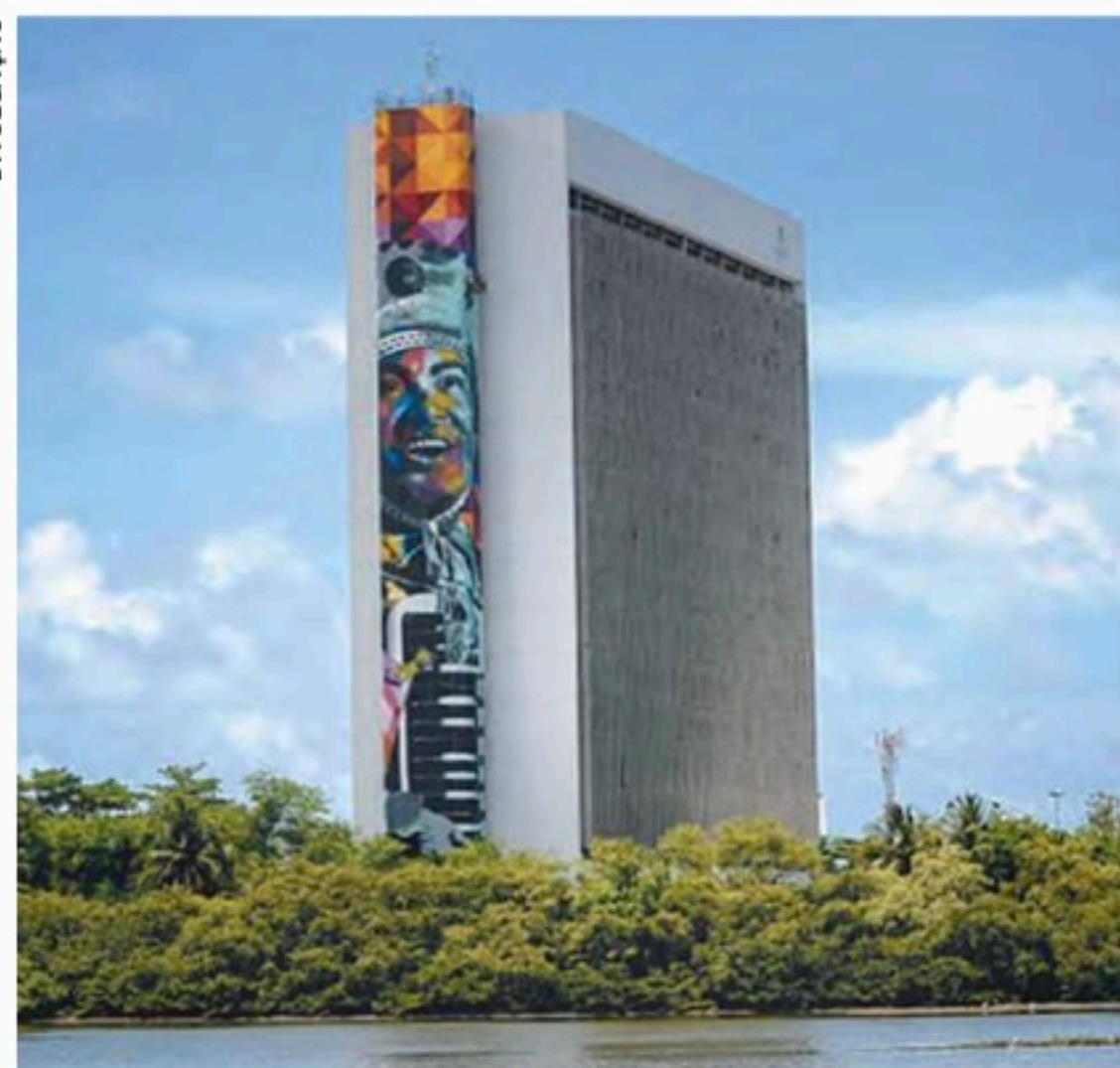
PCR recebe inscrições só até domingo (14), pela internet

Em comemoração ao mês do trabalhador, a Prefeitura do Recife vai oferecer duas mil vagas em cursos de qualificação profissional ao longo dos próximos três meses. Desde ontem, já estão disponíveis 260 vagas na plataforma GO Recife, que pode ser acessada pelo site ( gorecife.recife.pe.gov.br ) ou pelo aplicativo do Conecta Recife. As inscrições vão até domingo (14). Inicialmente, são oferecidas qualificações em 11 diferentes cursos, em sete centros e escolas