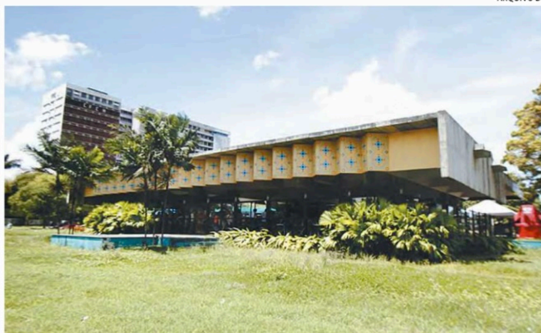
Rampas foram construídas, e área, ampliada. Nutricionistas acompanharão cardápio

socioeconômica devidamente comprovada e aprovados em edital da Pró-Reitoria para Assuntos Estudantis (Proaes) terão a refeição totalmente subsidiada pelo Plano Nacional de Assistência Estudantil (Pnaes). Os demais estudantes de graduação e pós-graduação terão 60% do valor da refeição subsidiados por recursos próprios da UFPE (almoço custará R$ 4,78; e jantar será R$ 4,88). Servidores e visitantes pagarão o valor integral da refeição: desjejum: R$ 10,31; almoço: R$ 11,95; e jantar: R$ 12,20. No caso do desjejum, apenas os beneficiados pelo Programa de Moradia Estudantil terão gratuidade. As demais pessoas devem pagar o valor integral, caso queiram fazer essa refeição.