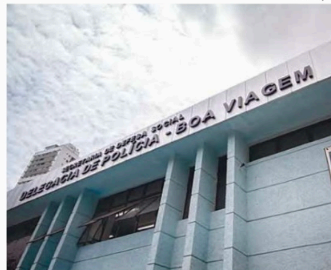
Austríaco foi preso em flagrante, ao agredir funcionária