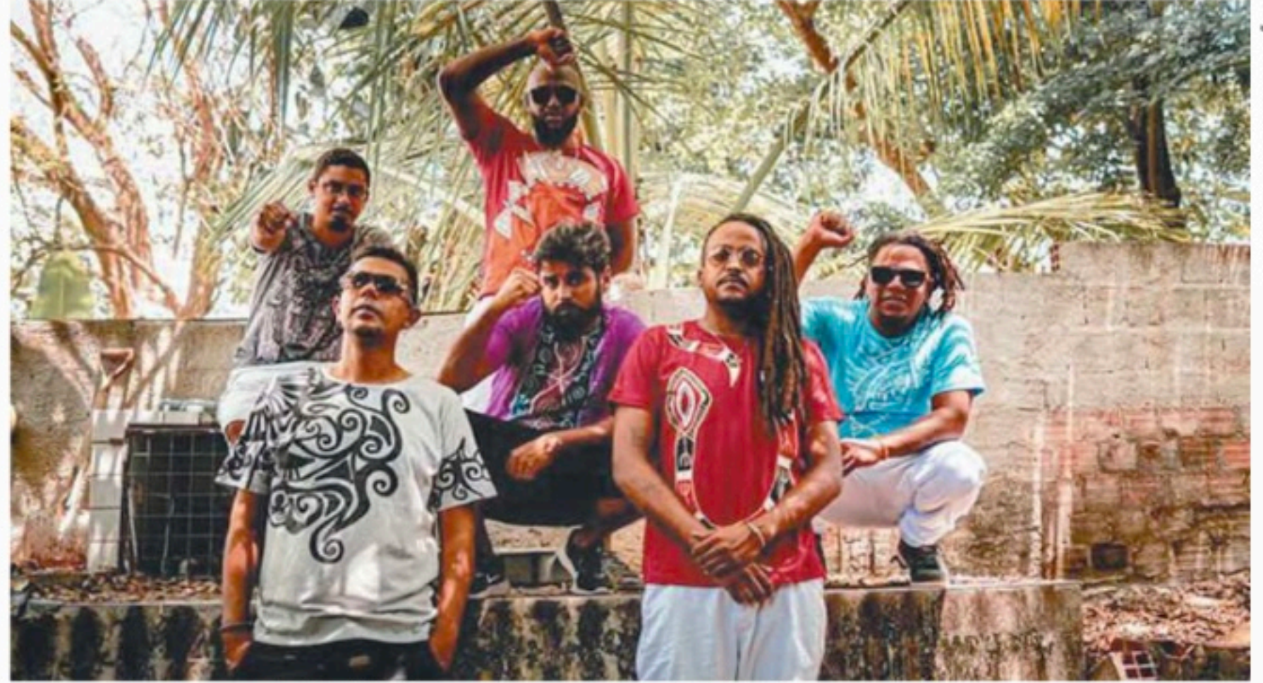
A capa deste novo trabalho do grupo Abulidu é assinada pelo artista Diego Sidrim

Segundo Abulidu, o “EP remix é uma conexão com artistas da nossa terra e do exterior. As novas versões estão no mundo digital para tocar nas pistas daqui e do mundo afora”.