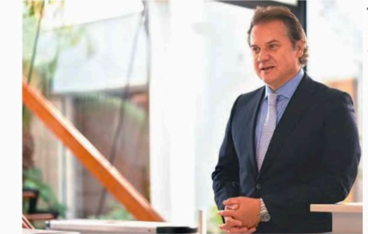
Presidente da Anfavea alerta para outras paralisações

sil produziram 178,9 mil veículos em abril, contra 222 mil em março. No primeiro quadrimestre, a produção chegou a 714,9 mil unidades, um aumento de 4,8% em comparação ao mesmo período de 2022. Em março e abril do ano passado, a indústria automobilística enfrentou um dos momentos mais críticos na aquisição de semicondutores. Ainda, segundo a Anfavea, o volume de empacamentos de abril