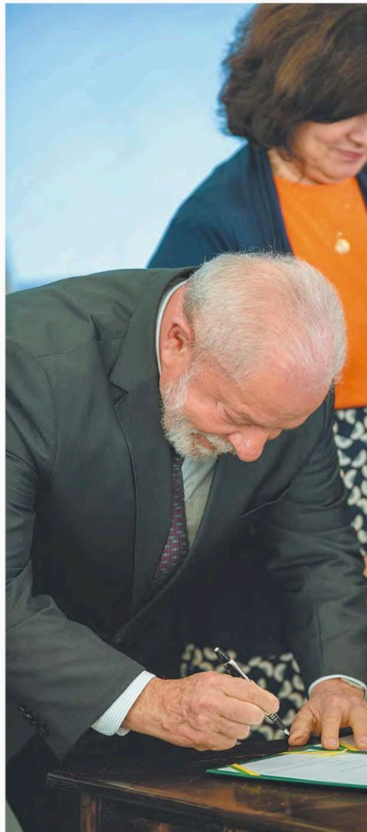
Ao todo, 805 municípios brasileiros foram contemplados com os novos serviços e equipes

Luiz Inácio Lula da Silva, Presidente da República