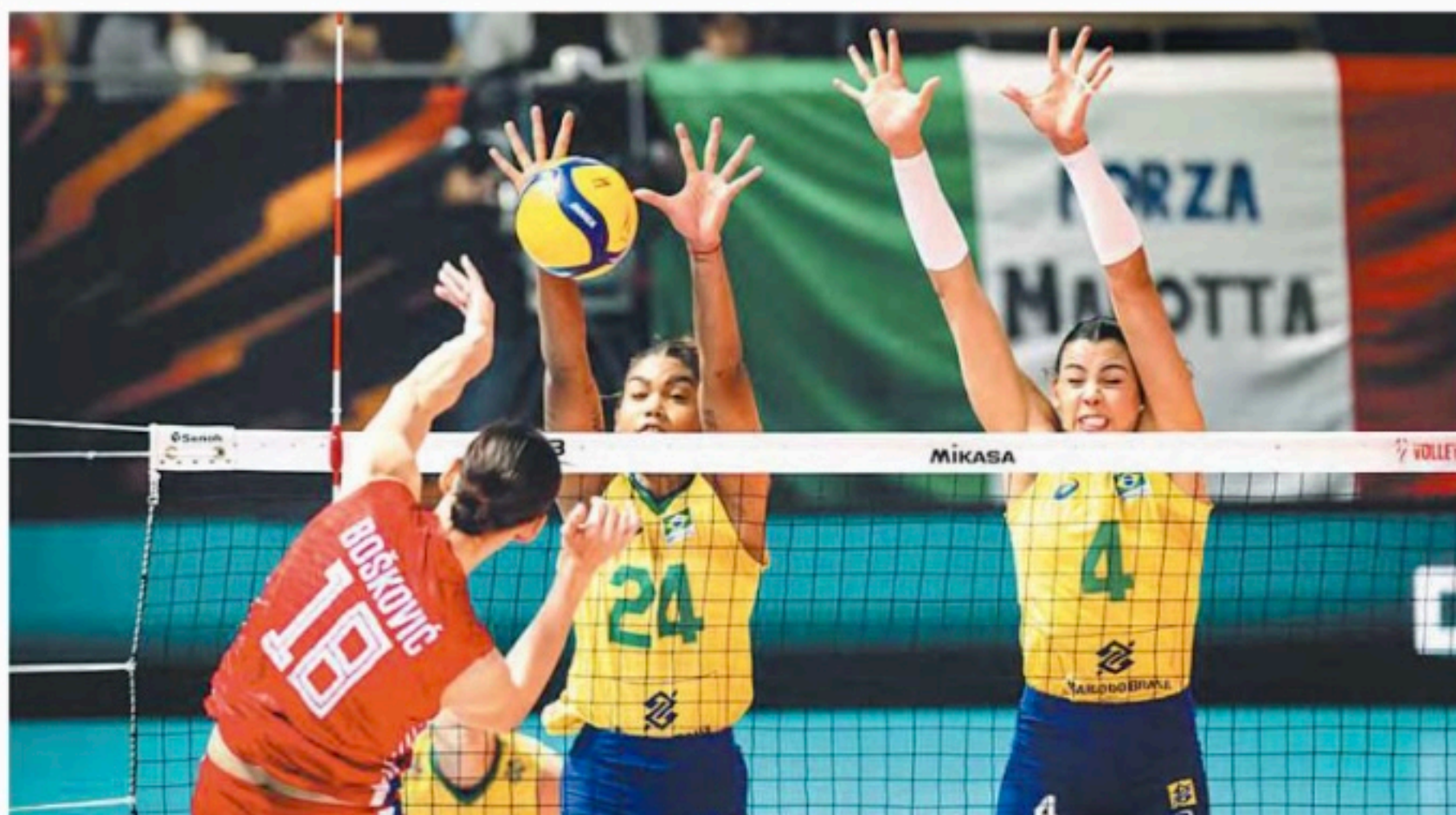
Projeto tem entre os grandes entraves alterações na relação entre atletas e agremiações