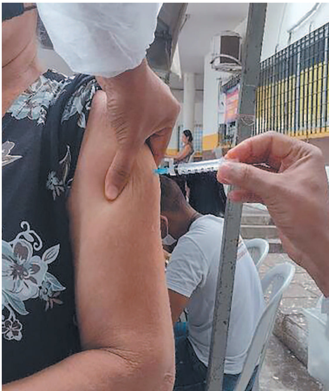
A meta do governo federal é de conseguir imunizar pelo menos 90% da população

pulação não contemplada nos grupos prioritários já estabelecidos, além de contribuir na redução dos atendimentos ambulatoriais, internações e absenteísmo durante o período de outono e inverno.