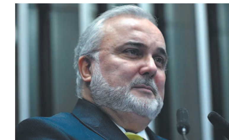
Prates: prática de preços terá equilíbrio com o mercado

Prates afirmou que a Petrobras vai seguir o critério de es-