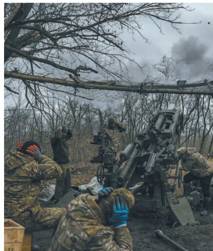
Rússia e Ucrânia estão em conflito há mais de um ano