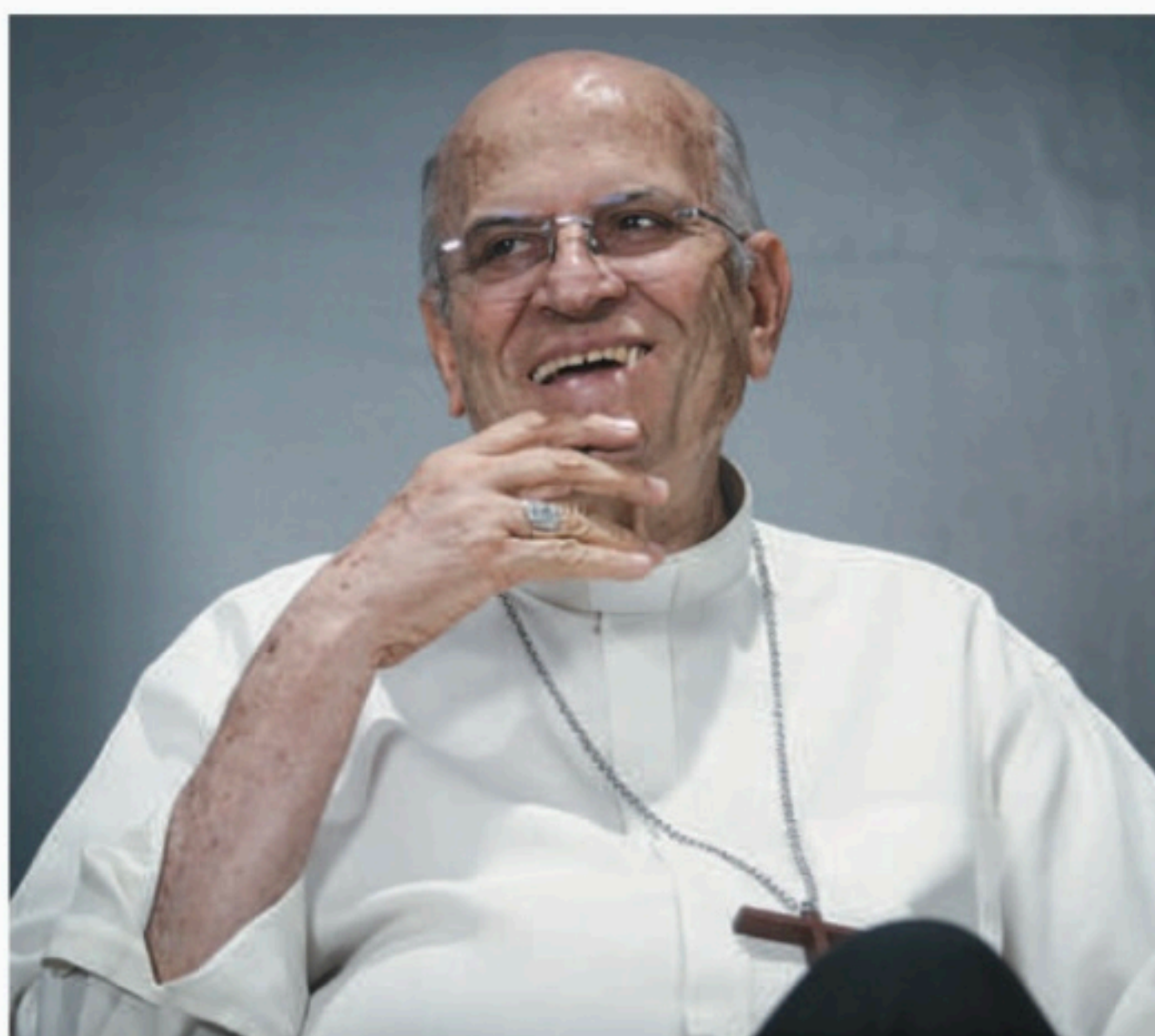
SANDY JAMES / DP