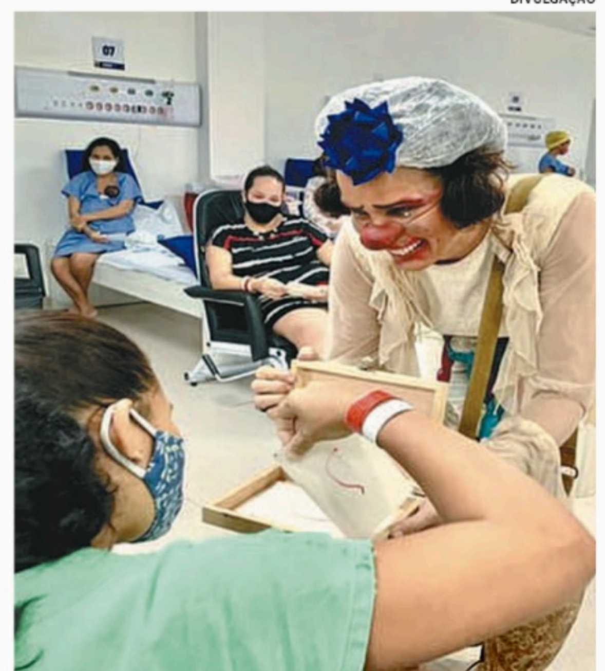
Hospital da Mulher tem semana dedicada ao "Canguru"

Como unidade de especialidades, o Hospital da Mulher abrange os três níveis de atendimento do alto risco na maternidade. O HMR dispõe de ambulatório de pré-natal de alto risco; de Enfermaria de Alto Risco para gestantes que precisam de internamento, com cuidados específicos, em algum momento da gestação; e o Hospital conta também com um complexo neonatal formado por UTI da Mulher e UTI Neonatal, UCI Neonatal e UCI Canguru.