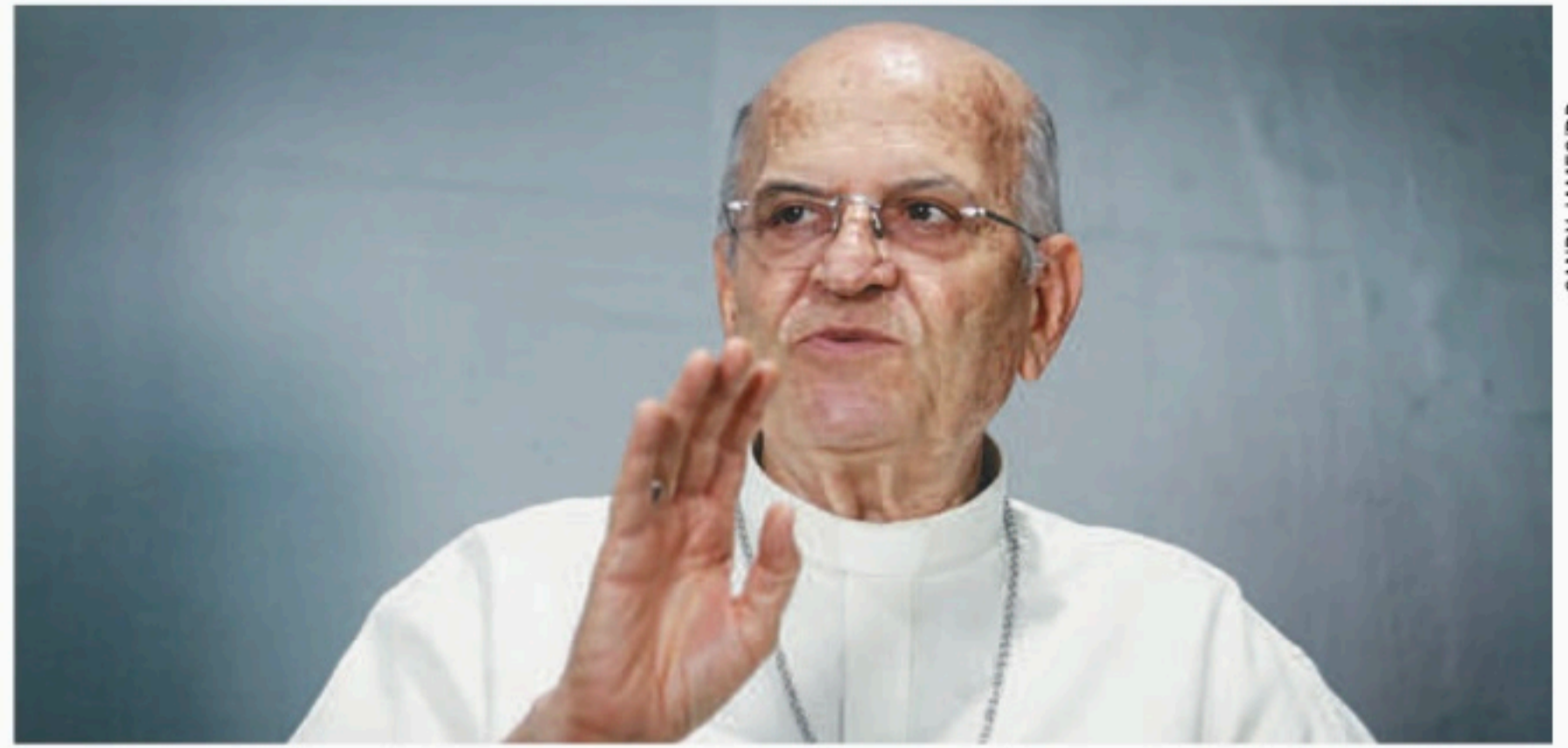
Para dom Saburido, a imprensa tem obrigação de "comunicar a verdade", visando a paz

mindando o cargo de arcebispo de Olinda e Recife. Ele revelou o que deseja que seu substituto tenha. "Espero do meu sucessor amor à igreja, condições intelectuais para gerir a arquidiocese e que tenha, acima de tudo, sensibilidade social", relatou.