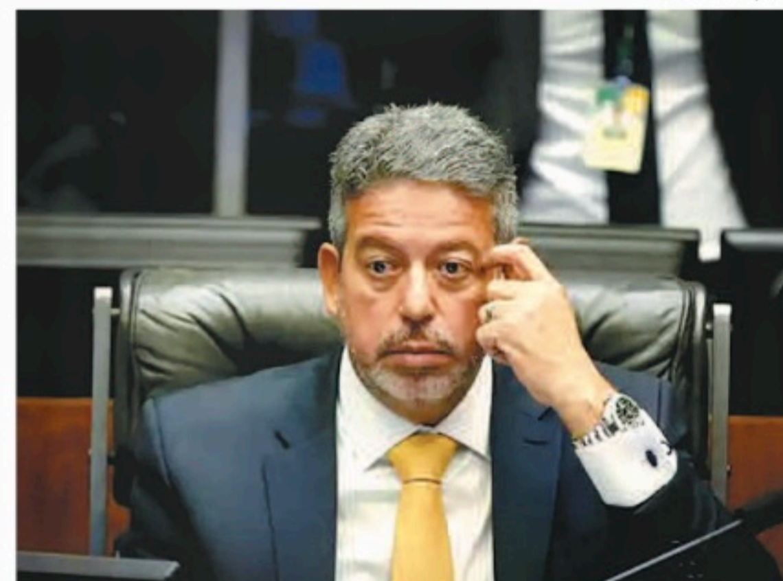
Declaração de Lira foi feita durante sessão do plenário

ma terça-feira (16), por unanimidade, o registro de candidatura de Deltan Dallagnol. Cabe recurso da decisão ao Supremo Tribunal Federal (STF). A Constituição garante aos deputados cassados pela Justiça Eleitoral o direito a ampla defesa dentro da Câmara dos Deputados. De acordo com a Constituição, a perda de mandato será declarada pela Mesa da