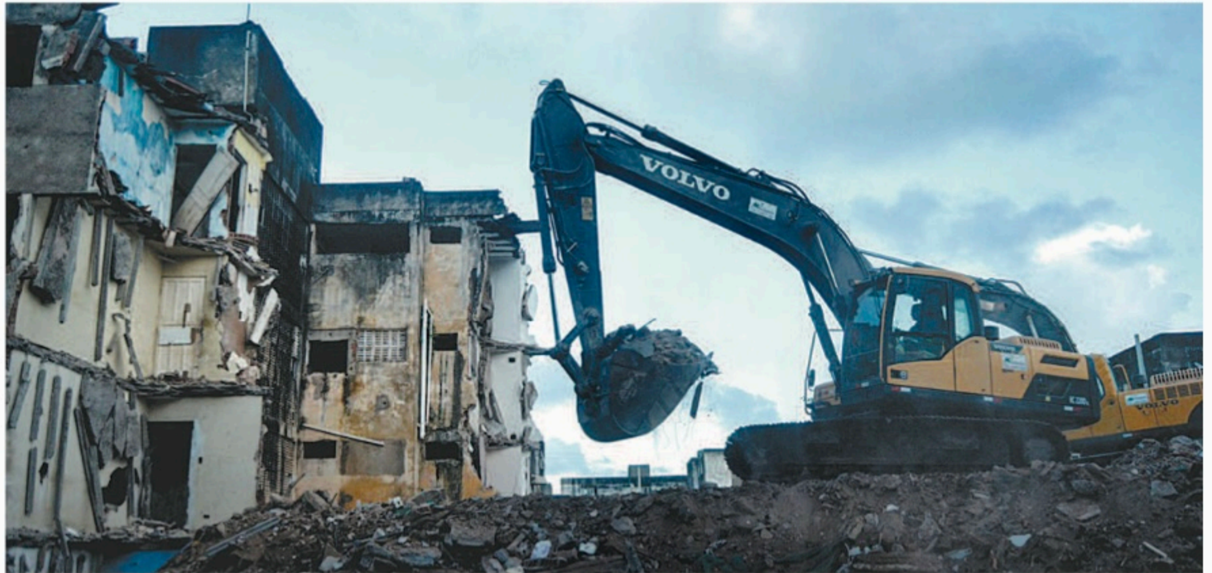
O imóvel já tinha sido desocupado, e os moradores tiveram tempo de retirar seus pertences, antes da demolição

Durante a demolição, as casas que ficam nos arredores do Brooklyn tiveram que ser inter-