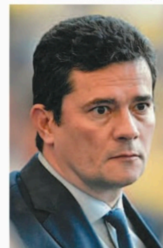
Estratégia seria alegar ser perseguido político

teria feito mudar de opinião foi a garantia de um bom emprego no exterior. "Existe a problematização da esposa [Rosângela Moro]. Ela está muito feliz como deputada e não quer ir embora do Brasil. Mas isso é facilmente contornável", apontou.