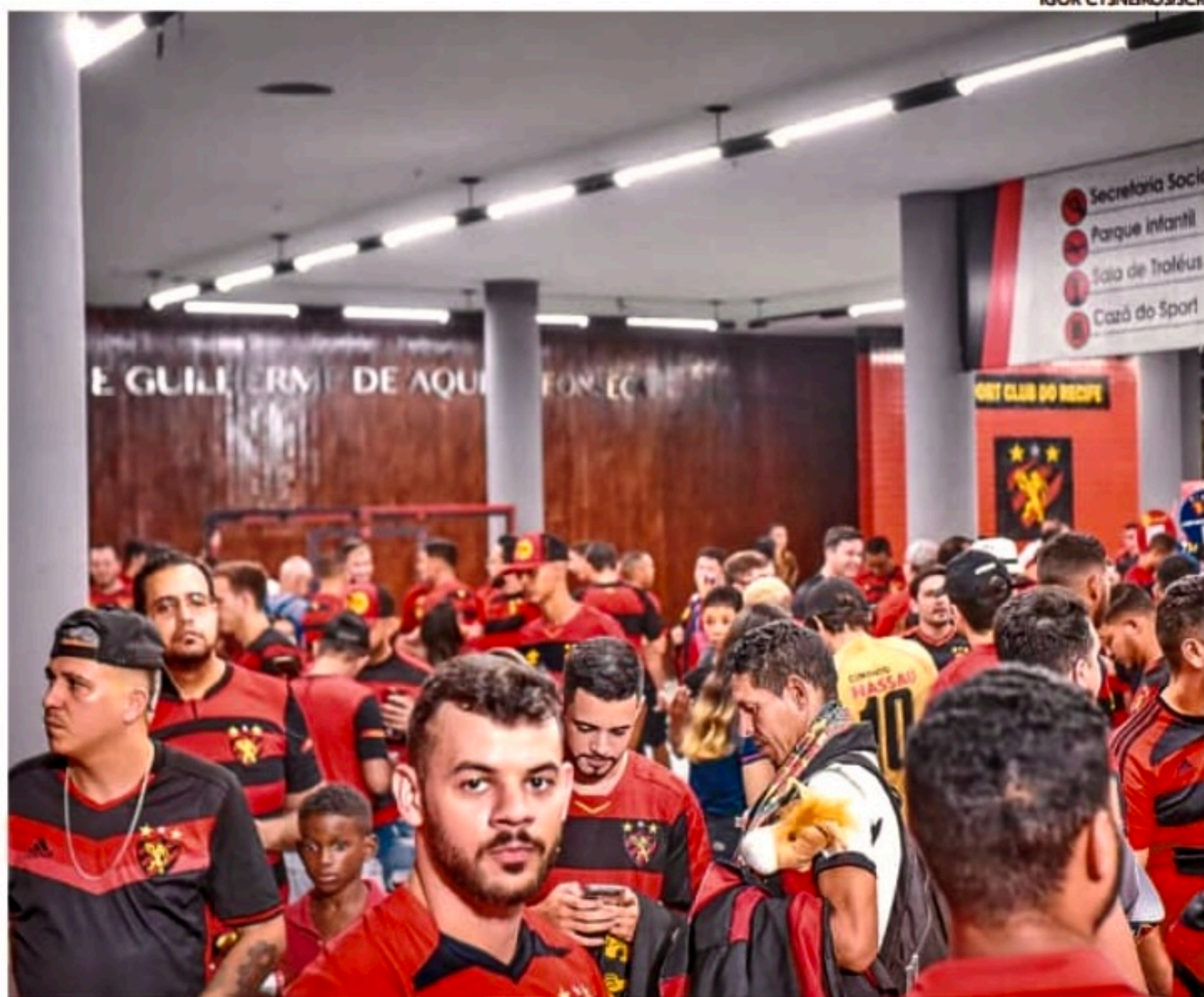
Sport disse estar seguro sobre a quantidade de ingressos que foram vendidos para a final da competição regional

Em nota, o Procon pedia para que o Sport comprovasse a capacidade da Ilha do Retiro, além da quantidade de ingressos vendidos e confeccionados para o jogo realizado na última quarta-feira. À disposição para contribuir com os órgãos competentes, o Leão in-