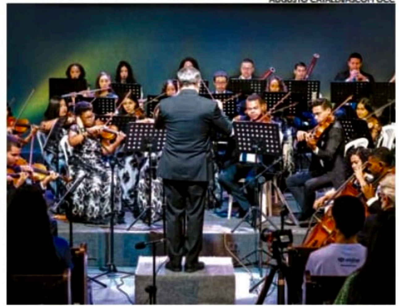
A apresentação será na Igreja Batista Emanuel, em Boa Viagem

Sediada nas instalações do 7º Depósito de Suprimento do Exército Brasileiro, a Orquestra Criança Cidadã é financiada com incentivo do Ministério da Cultura através da Lei de Incentivo à Cultura, conhecida como Lei Rouanet, e conta com patrocínio do Governo Federal e realização da Funarte.