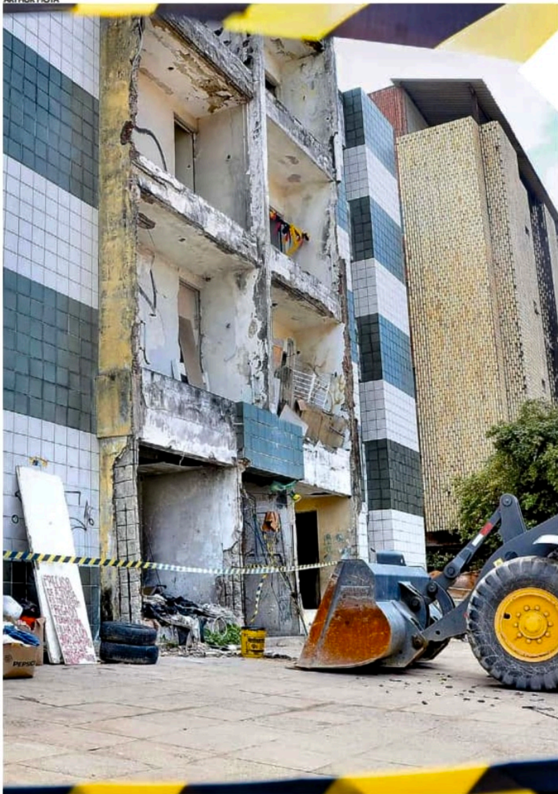
O Marquês de Felipe, em Jardim Atlântico, interditado em 2004, era ocupado por dez moradores