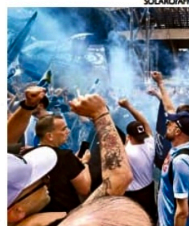
Torcedores do Napoli foram às ruas festejar título histórico

O Napoli havia desperdiçado no último domingo a chance de conquistar o Scudetto em seu estádio. O time precisava vencer e só conseguiu empatar em 1x1 contra a Salernitana.