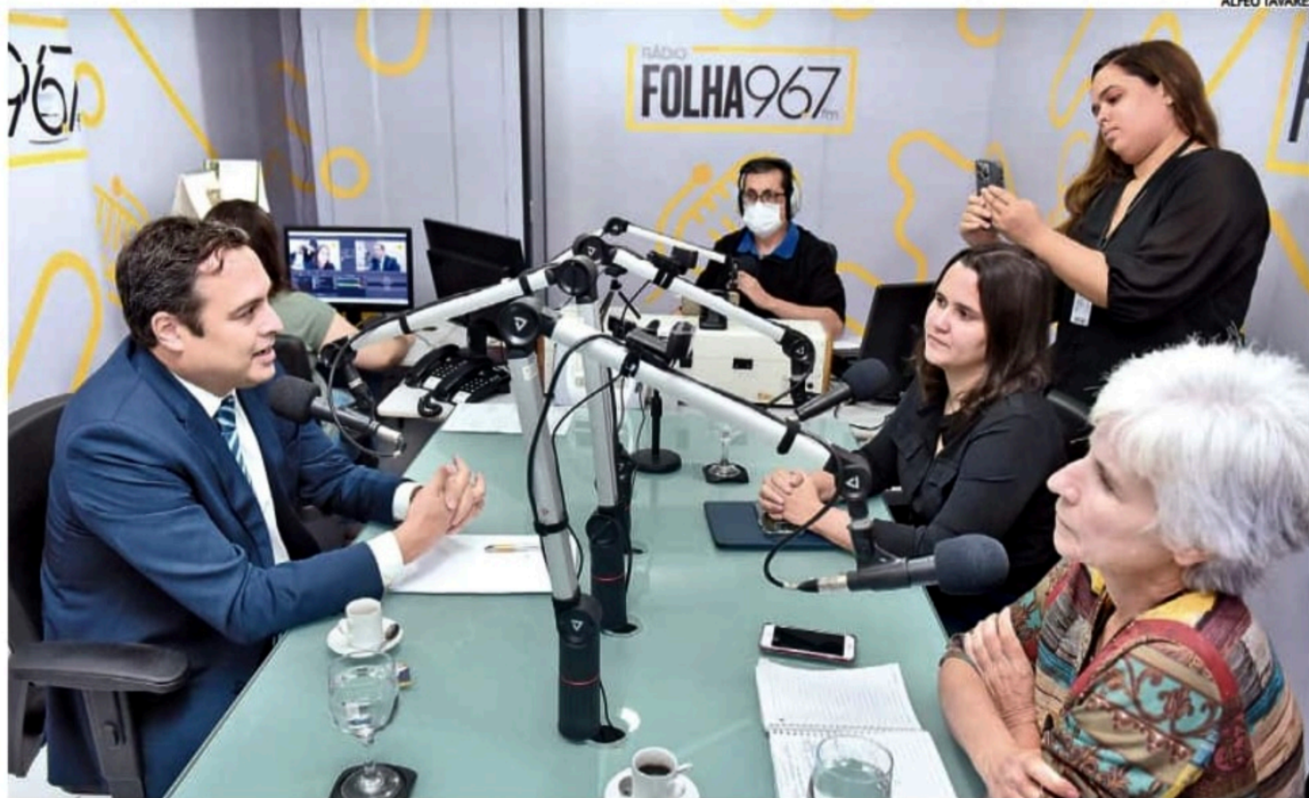
Paulo Câmara: “Eu vou circular muito pelos municípios nordestinos. Quero que o banco tenha uma dimensão dos negócios e do povo”

sempre busquei cumprir o meu papel até porque a população quer isso, quer soluções, não quer desculpas. Então, trabalhei muito e fico muito satisfeito com o legado que a gente deixou: Pernambuco com a melhor educação pública do Brasil, tendo sido um dos estados da federação que menos número de mortes de Covid-19 teve e tem uma rede estruturada e que buscou realmente gerar oportunidades de emprego e de renda a todos os pernambucanos. Nesses oito anos que governamos Pernambuco não houve um só empreendimento que aconteceu em Pernambuco que não teve ajuda do governo e que não teve a solidariedade da população. Tudo isso faz parte de um pacote muito importante de legado que a gente deixa e que eu não tenho dúvida que, se for de maneira adequada, com gestão, com responsabilidade, tem tudo pra gerar muitos frutos no futuro.”