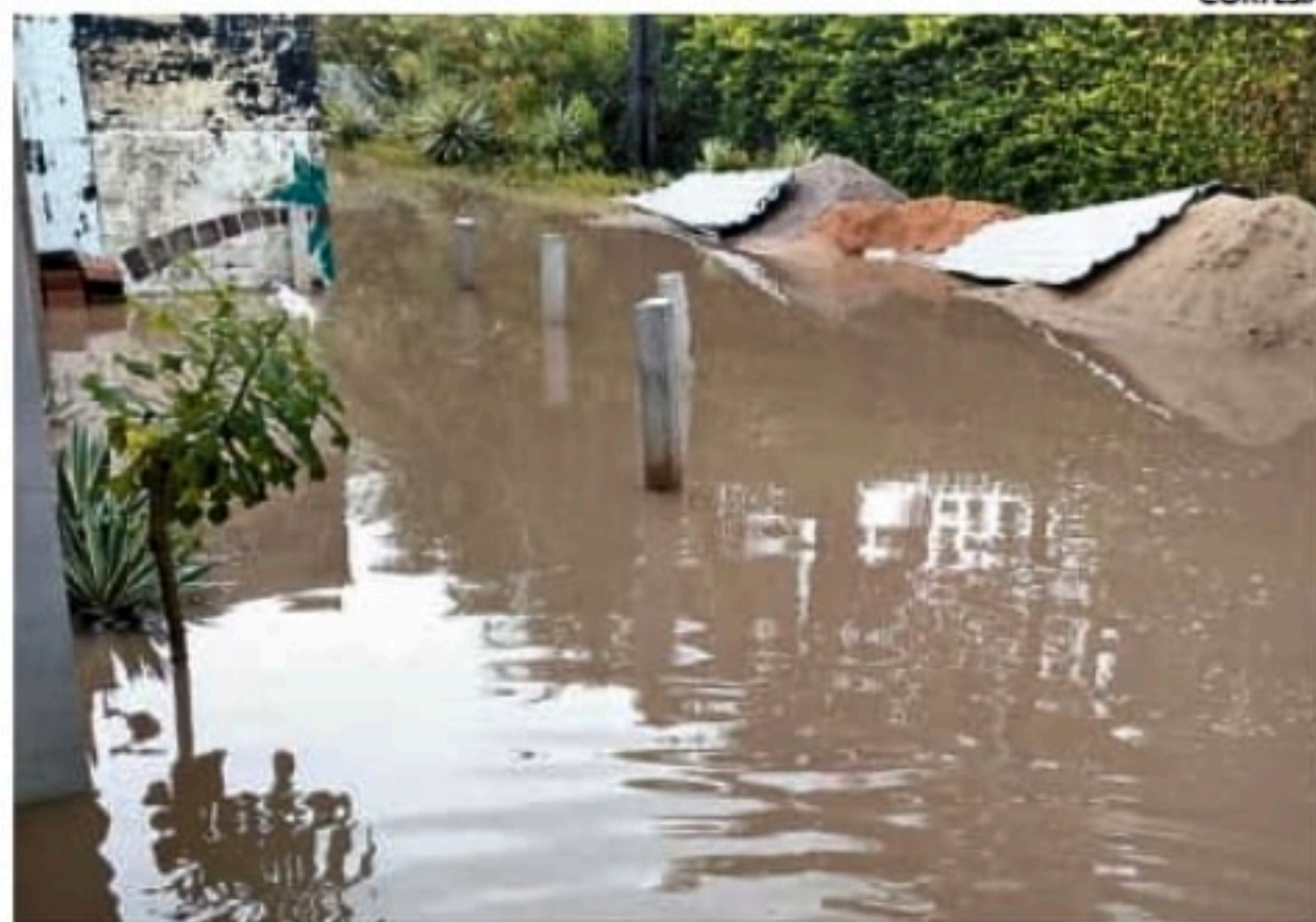
Ruas estão ficando inundadas com as construções, aponta advogado

está definido hipóteses em que o cessionário perderá o direito de explorar a atividade e quais punições definidas pelo poder público municipal para tanto. Não está definido o prazo de vigência do termo de cessão de uso, e se poderá ser renovado ou não, nem está determinada a vedação da sublocação do quiosque", afirmou.