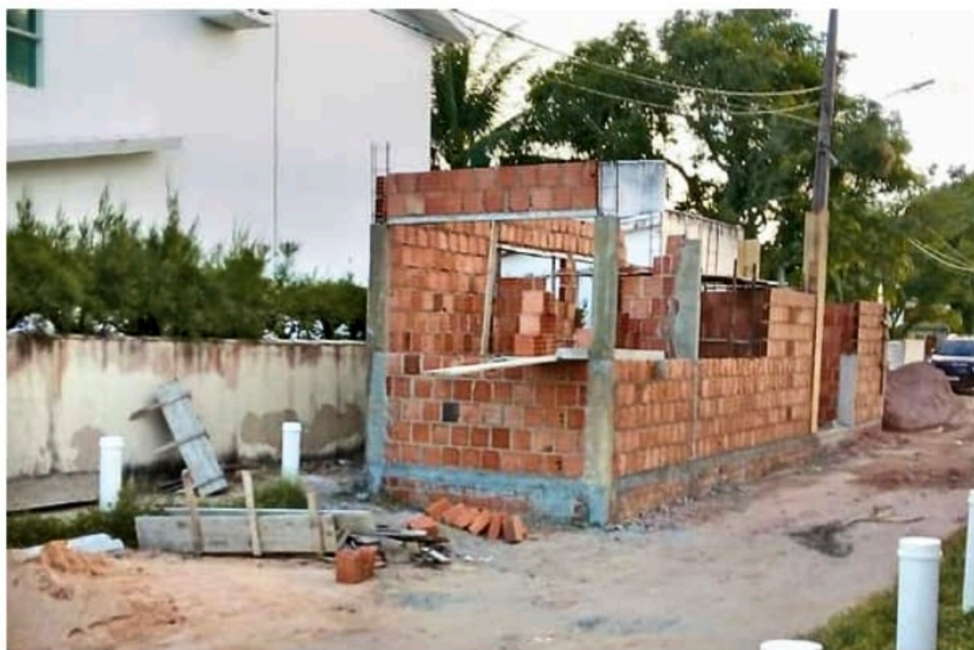
Segundo advogado, projeto não estabelece mínimas condições para utilização dos quiosques

"Ruas estão ficando inundadas com as construções e muitas até impedem o direito de ir e vir dos moradores, inclusive impedindo o acesso às garagens. O projeto não estabelece mínimas condições para utilização, não observa as atividades que poderão ser exploradas, nem aquelas proibidas, especialmente em razão da localização. Não observa nenhuma disposição no sentido de vedar ou permitir a utilização de equipamento sonoro, e quais as condições para uso, não