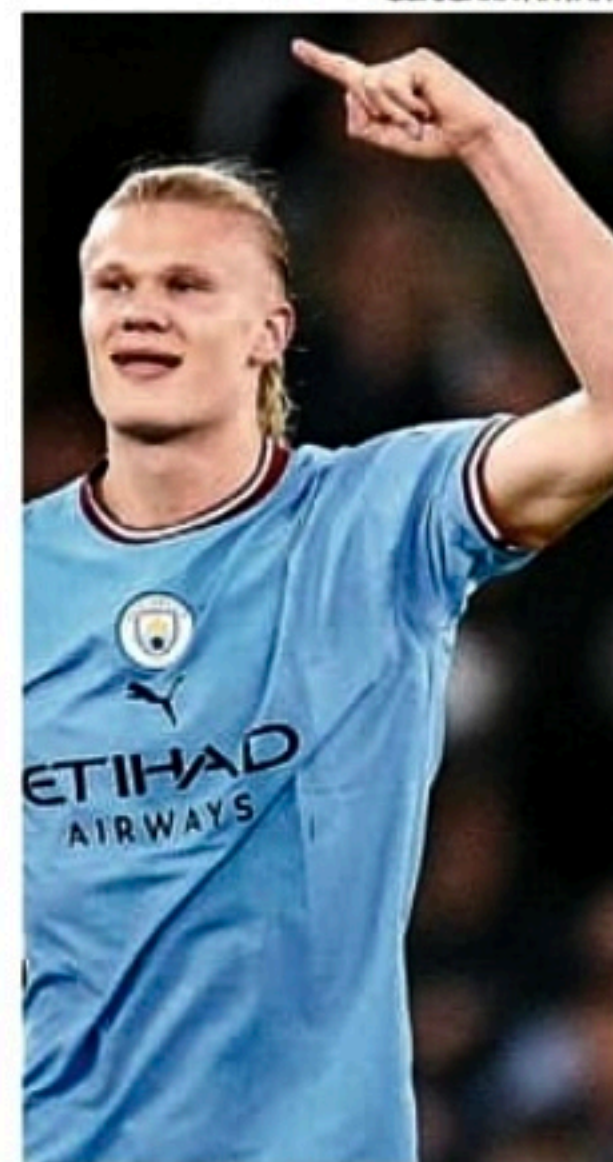
Vini Jr e Erling Haaland estarão frente a frente pela primeira vez