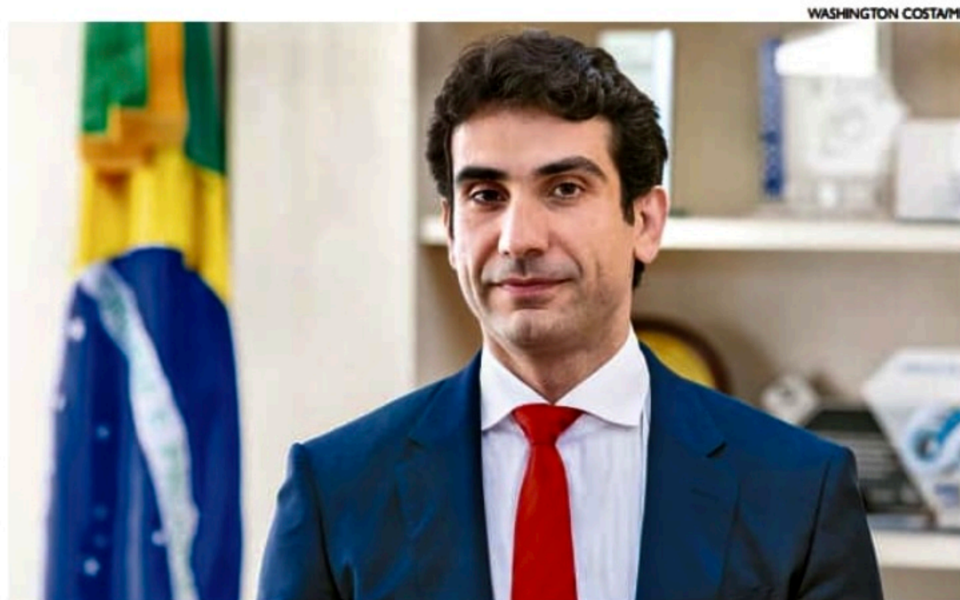
O nome de Gabriel Galípolo teria sido sugerido pelo atual presidente do Banco, Roberto Campos Neto

O ministro diz que a nomeação ajudará a integrar as políticas fiscal e monetária. Para o lugar de Galípolo no Ministério da Fazenda, o ministro vai nomear o advogado Dario Durigan, que foi assessor especial de Haddad na prefeitura de São Paulo entre outubro de 2015 e dezembro de 2016, quando Haddad deixou o cargo.