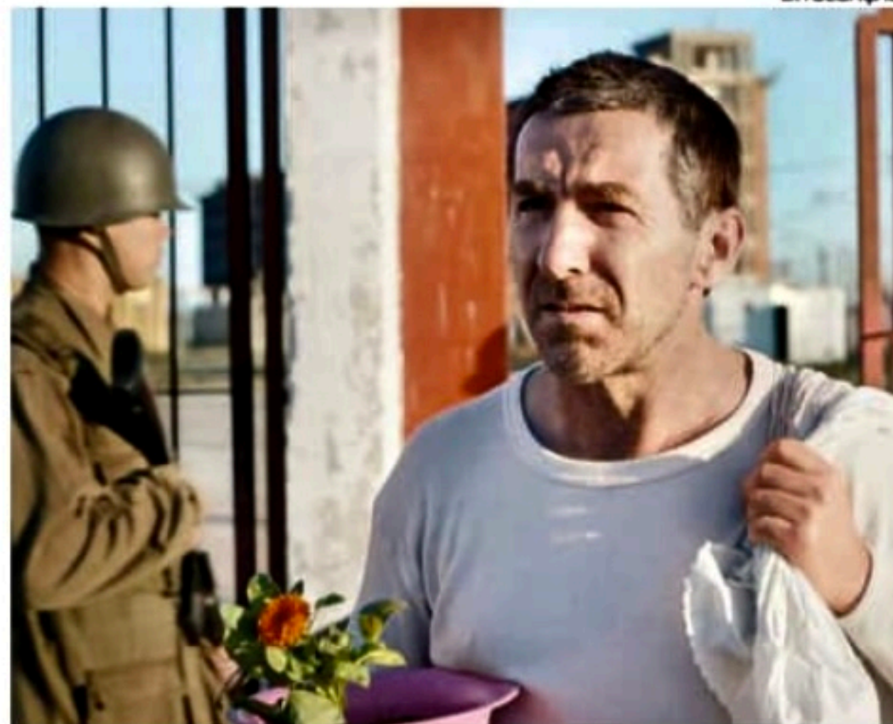
Mostra acontece no Cinema do Porto, no coração do Recife

Em decorrência de problemas técnicos, os ingressos para o Cinema do Porto não podem ser retirados no local e devem ser adquiridos temporariamente pelo site Symply. Os valores dos bilhetes são de R$ 7 (meia-entrada) e R$ 14 (inteira). A programação com os filmes em cartaz e os horários pode ser consultada no site do Festival Filmelien ( www.festival-filmelien.com.br ).