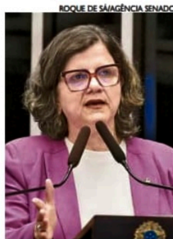
O gabinete da senadora disse que a decisão foi apenas profissional