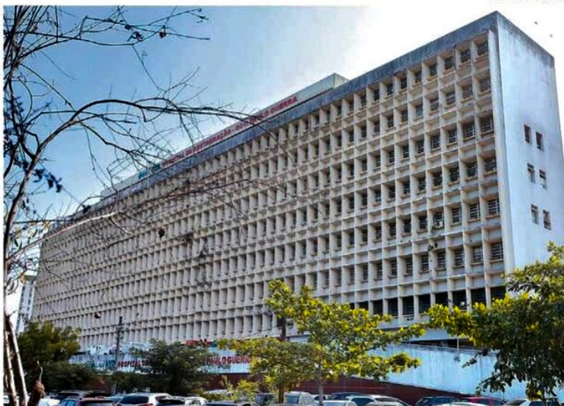
HR precisará contratar profissionais em número adequado para atendimento de qualidade aos pacientes

■ STF determina que Governo de Pernambuco garanta quantitativo suficiente de profissionais de enfermagem em todos os horários e setores