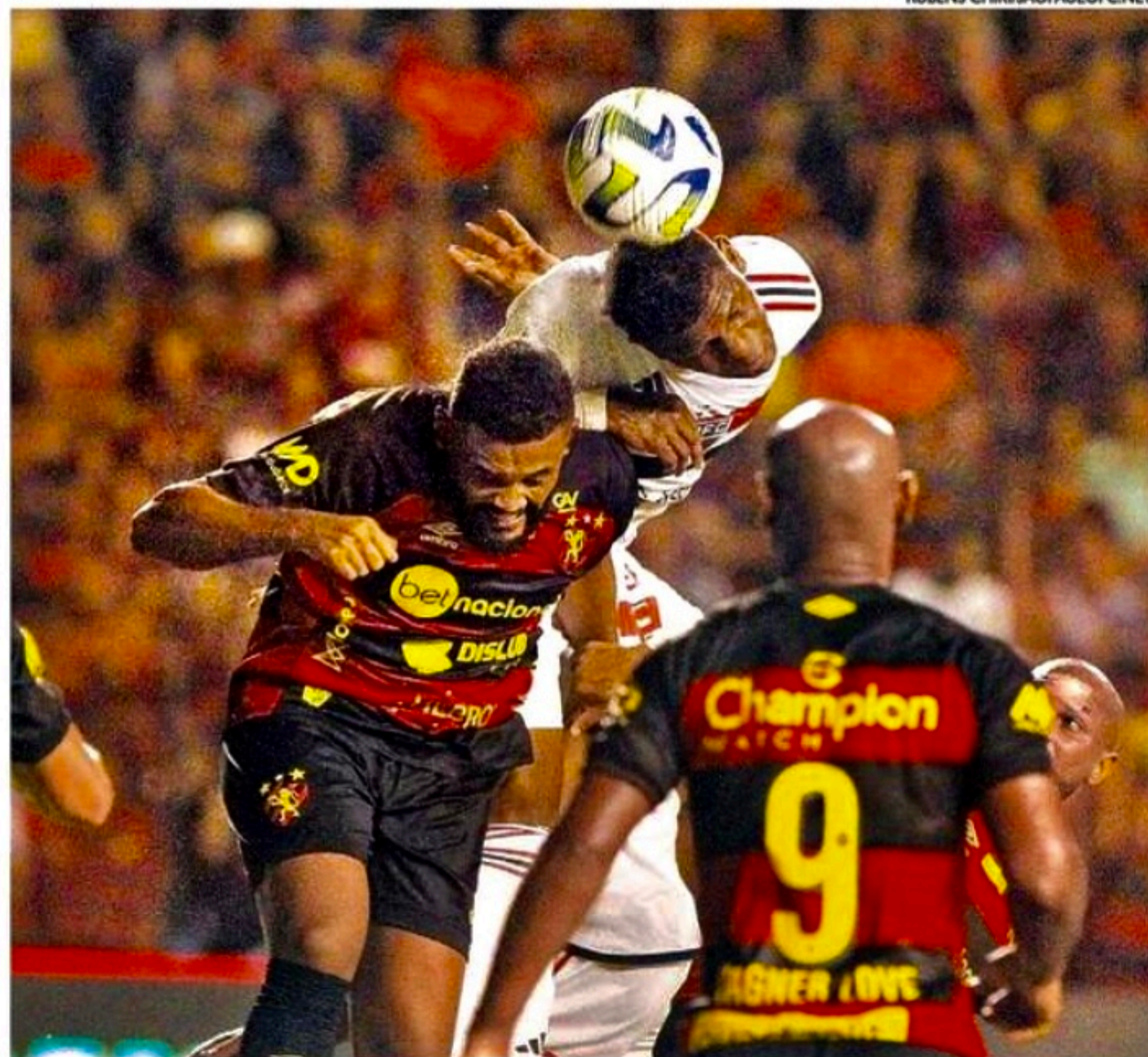
Rubro-negro frustrou torcida ao perder longa invencibilidade de 32 jogos na Ilha do Retiro