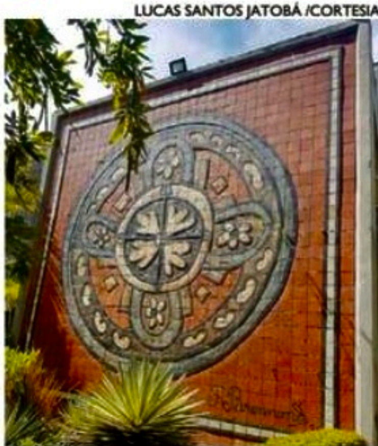
Mural cerâmico "Mandala" está nos jardins da Biblioteca Pública de Pernambuco

O mural cerâmico "Mandala", de cores terrosas, possui forma quadrada, tendo ao centro a figura de grande circunferência ornada por castanhas e uma espécie de distinta flor ao centro da compo-