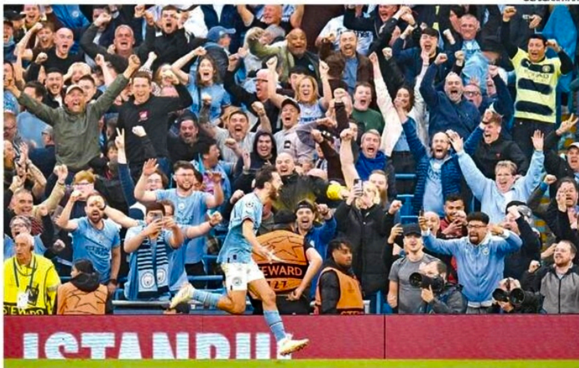
Momento em que Bernardo Silva abre o placar e a torcida do Manchester City comemora

O City, que na ida conseguiu um empate em 1 a 1 no Santiago Bernabéu, controlou a partida jogando em casa diante de um Real Madrid inofensivo no primeiro tempo e que só acordou timidamente depois do intervalo. "O adversário foi superior nesta volta do início ao fim", disse o lateral me-