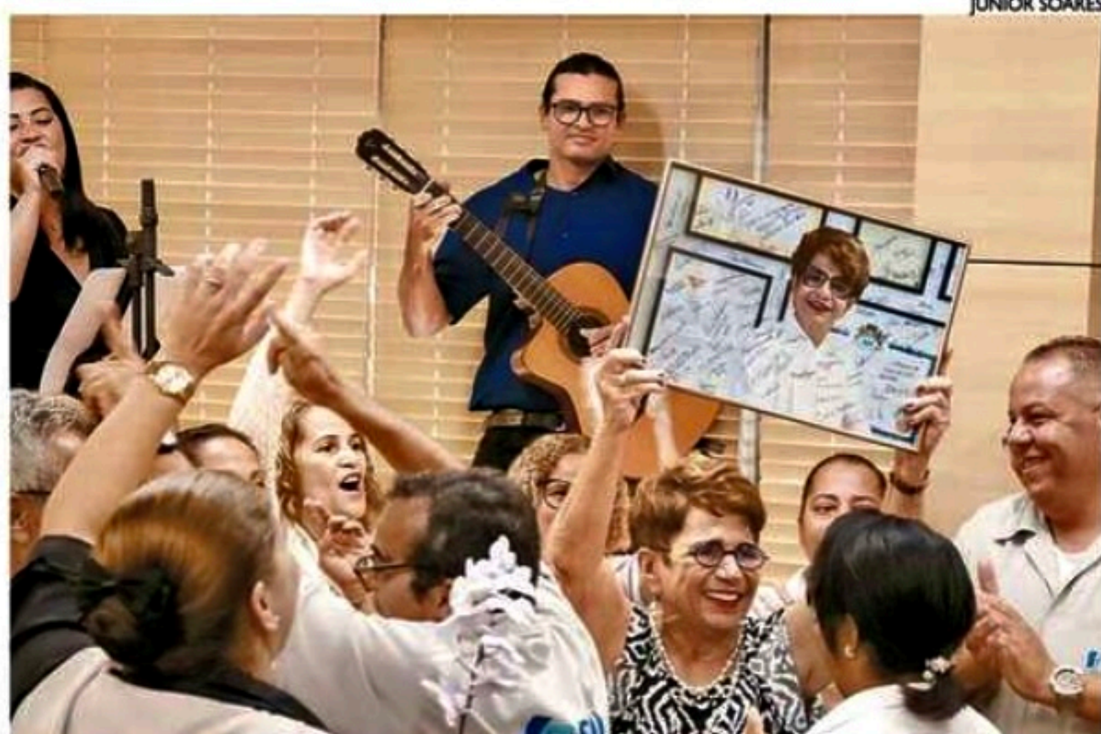
Conselheira fez história ao ser primeira mulher a ocupar um vaga no Tribunal