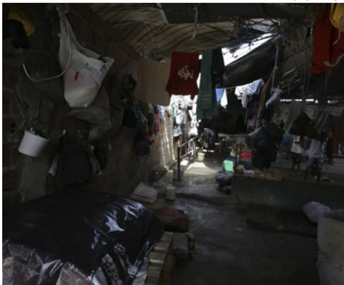
Presídios do Complexo Prisional do Curado têm sérios problemas estruturais e parecem favelas

Em nota, o TJPE informou as “ações para melhorar as condições dos presos se tornaram uma prioridade desde a criação do Gabinete de Crise” e que a redução foi possível por meio “de alvará de soltura, livramento con-