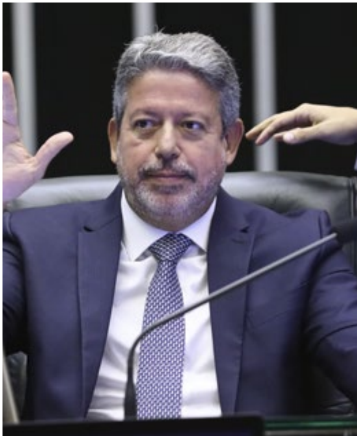
Nesta quarta, o presidente da Câmara voltou a reclamar da articulação do governo com o Congresso

na dado para uma tentativa de acordo, contudo, se esgotou. A derrota do governo em matéria de saneamento acontece num contexto ainda maior de preocupação para Lula.