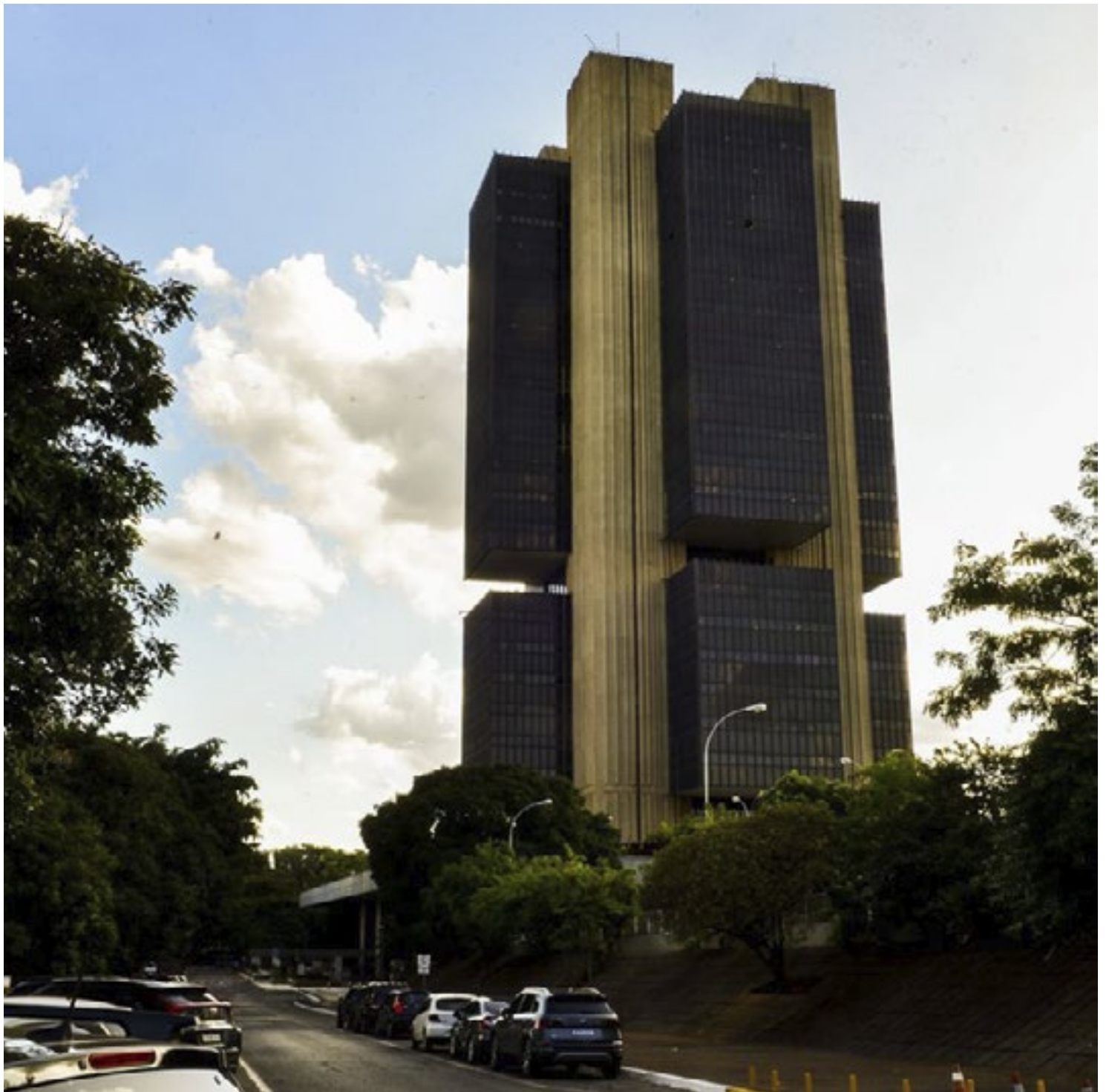
No comunicado, o BC inseriu trecho de que a retomada do ciclo de ajuste é um “cenário menos provável”

É a primeira decisão do Comitê de Política Monetária (Copom) desde a apresentação do novo arcabouço fiscal - regra que deve substituir o teto de gastos no controle das contas públicas