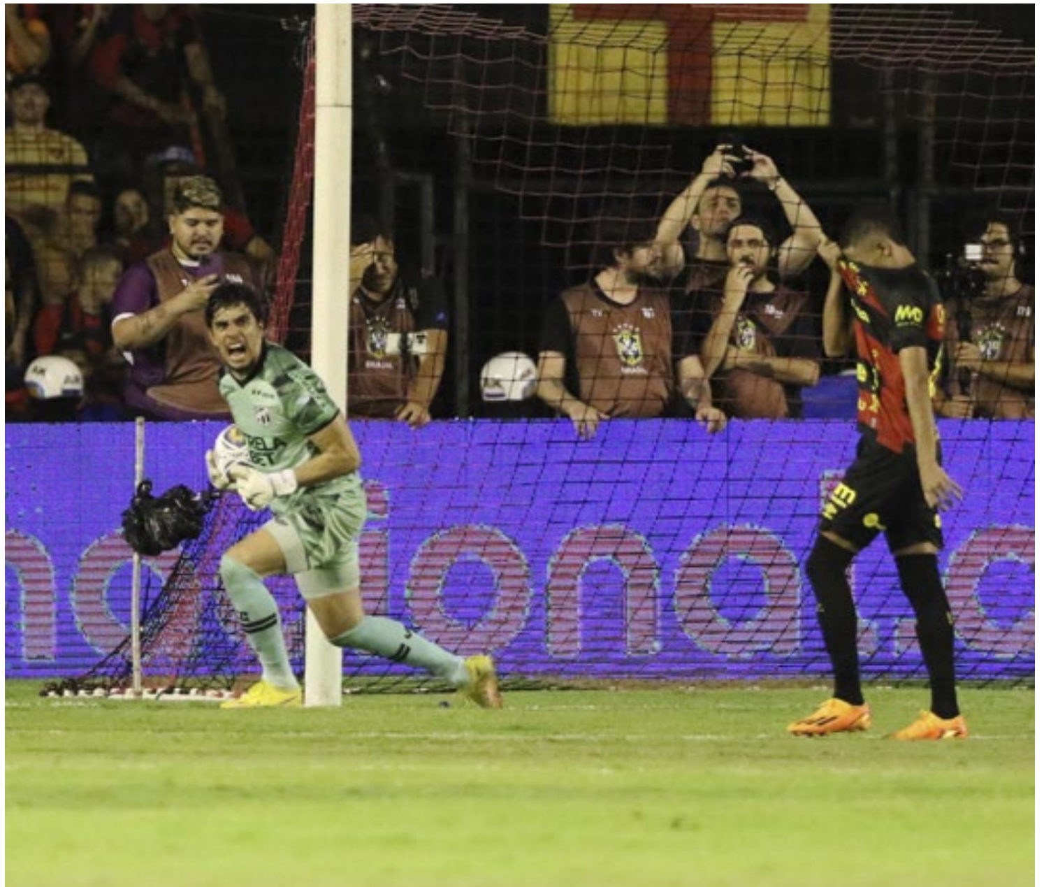
Goleiro do Ceará pegou duas cobranças de pênalti do Sport, dando título ao time

Precisando reverter uma desvantagem de dois gols, o Sport procurou abrir o placar desde o apito inicial. Com muita frieza e disciplina tática, os rubro-negros domina-