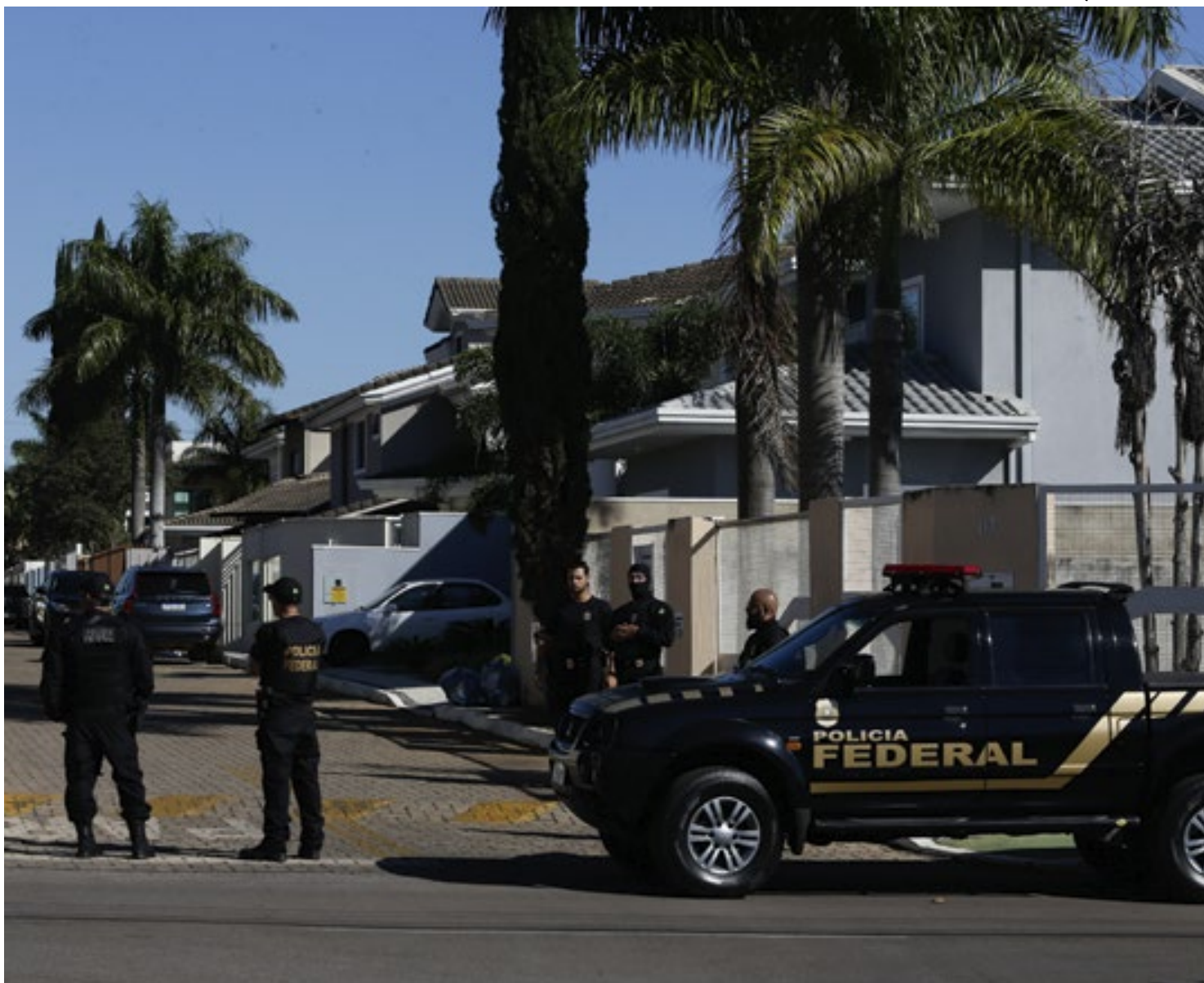
Polícia Federal realizou Operação Venire, que teve como alvo o ex-presidente Jair Bolsonaro (PL) por suspeita de adulteração em seu cartão de vacina

Batizada de Venire, a operação foi determinada pelo ministro do Supremo Tribunal Federal (STF) Alexandre de Mo-