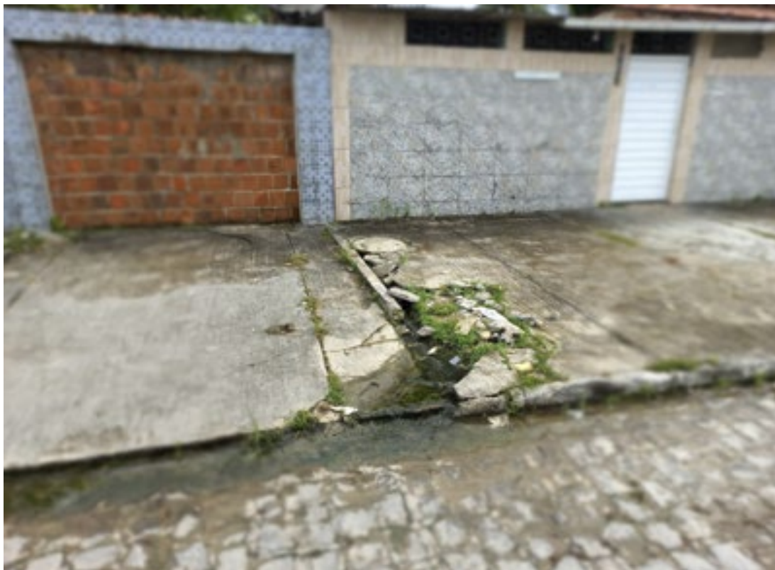
EDÉSIO CRUZ / VOZ DO LEITOR

Vejam a que ponto chegou o morador da casa de 1039, da Rua Dr. Sérgio Loreto, no bairro da Vila Popular, em Olinda: ele fez uma ligação