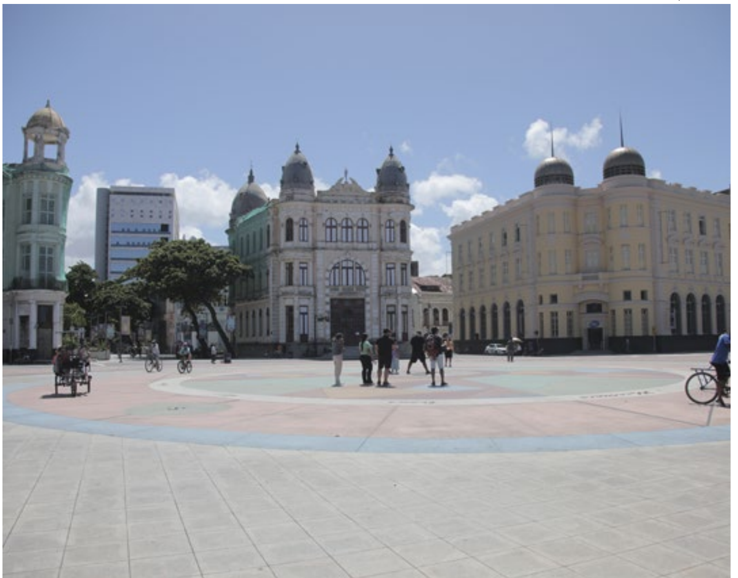
Policimento no Bairro do Recife já é feito pelo efetivo lotado na CIATur, mas a sede fica em Olinda

Mudança foi anunciada pelo governo de Pernambuco como promessa de dar mais segurança aos turistas