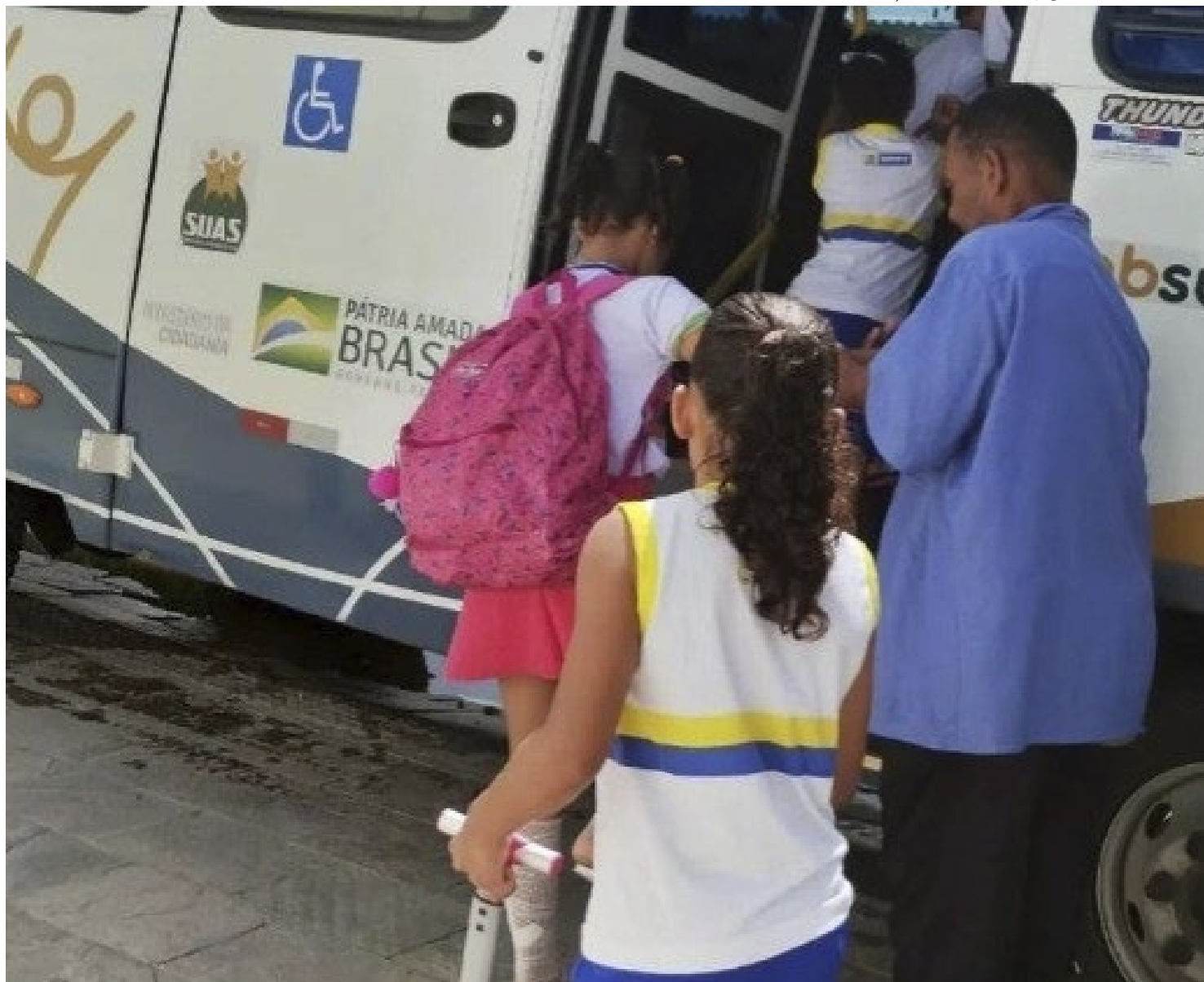
Crianças retomam rotina no dia a dia após trágico incêndio

As contribuições para a Instituição de Caridade