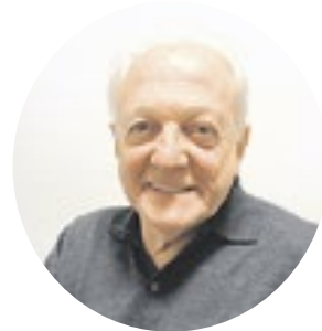
FLÁVIO RICCO Colaboração JOSÉ CARLOS NERY