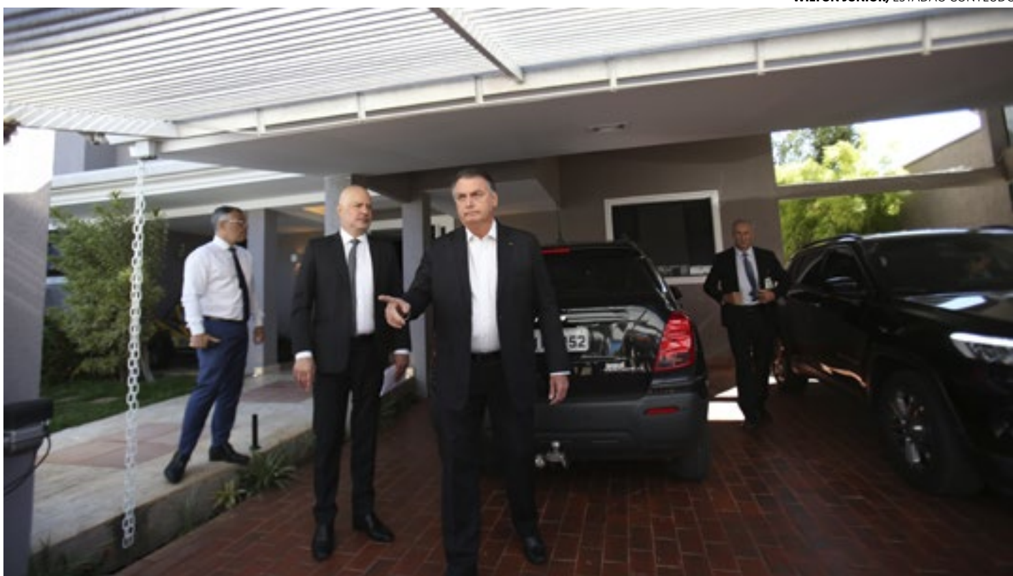
Bolsonaro fala sobre operação Venire, da Polícia Federal, que cumpriu mandado de busca e apreensão em sua residência

De acordo com relatório da PF, há provas de que Bolsonaro sabia da inserção fraudulenta dos dados de vacinação