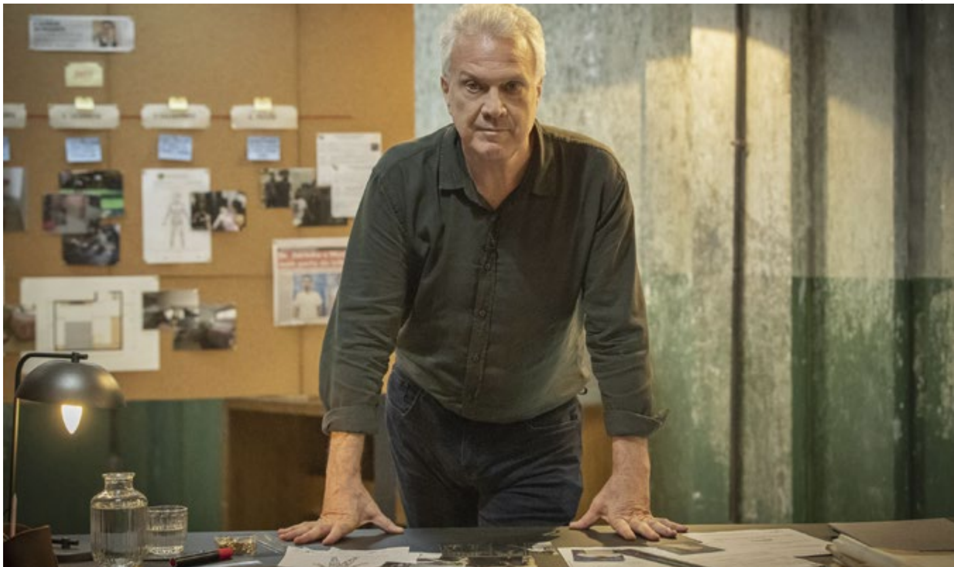
Pedro Bial é apresentador do novo Linha Direta