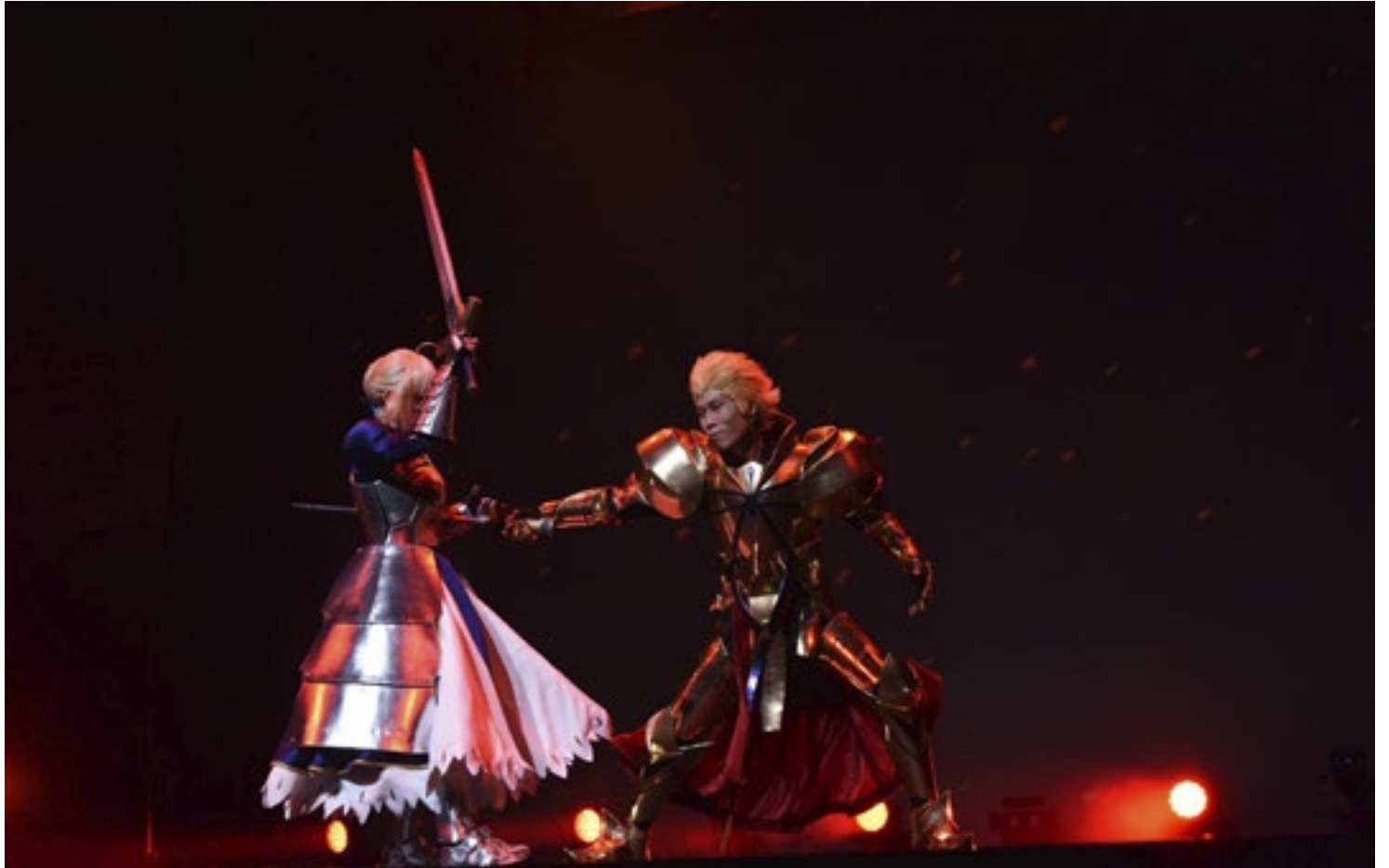
World Cosplay Summit é considerado o maior concurso de cosplay do mundo

Criado para celebrar a cultura pop japonesa, a competição está na 20ª edição e neste ano vai levar uma dupla para concorrer a uma vaga na grande final em São Paulo, que terá a chance de representar o país com tudo pago no Japão. A etapa de Recife terá a presença de cosplayers