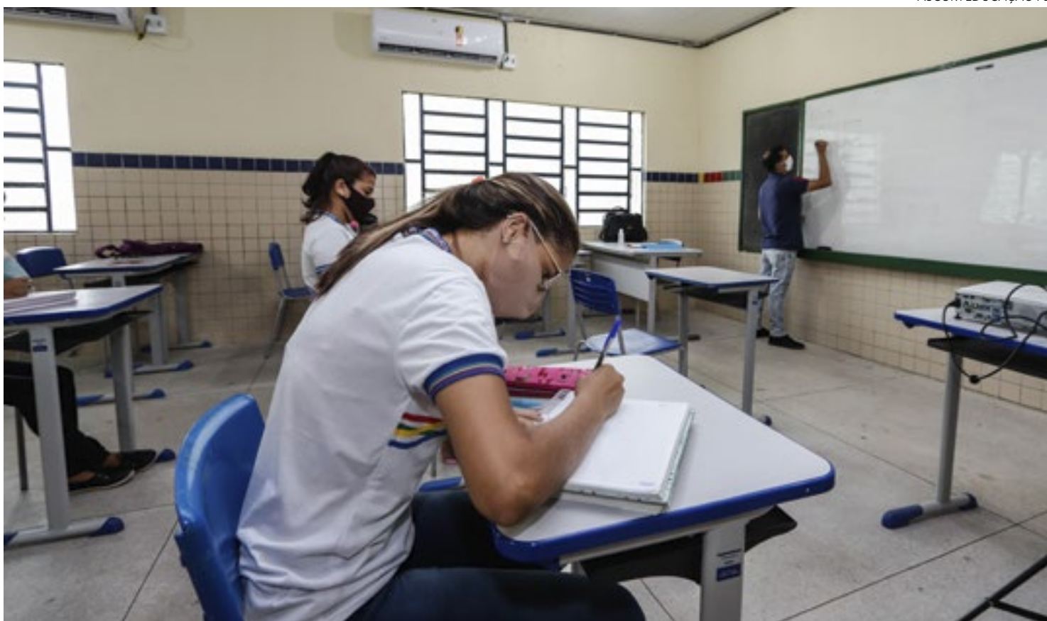
Professores de Pernambuco precisam atualizar cadastro para não terem salários bloqueados

De acordo com o governo de Pernambuco, a atualização cadastral é necessária diante do andamento dos concursos públicos voltados ao preenchimento de vagas do grupo ocupacional magistério do quadro permanente de pessoal da SEE/PE.