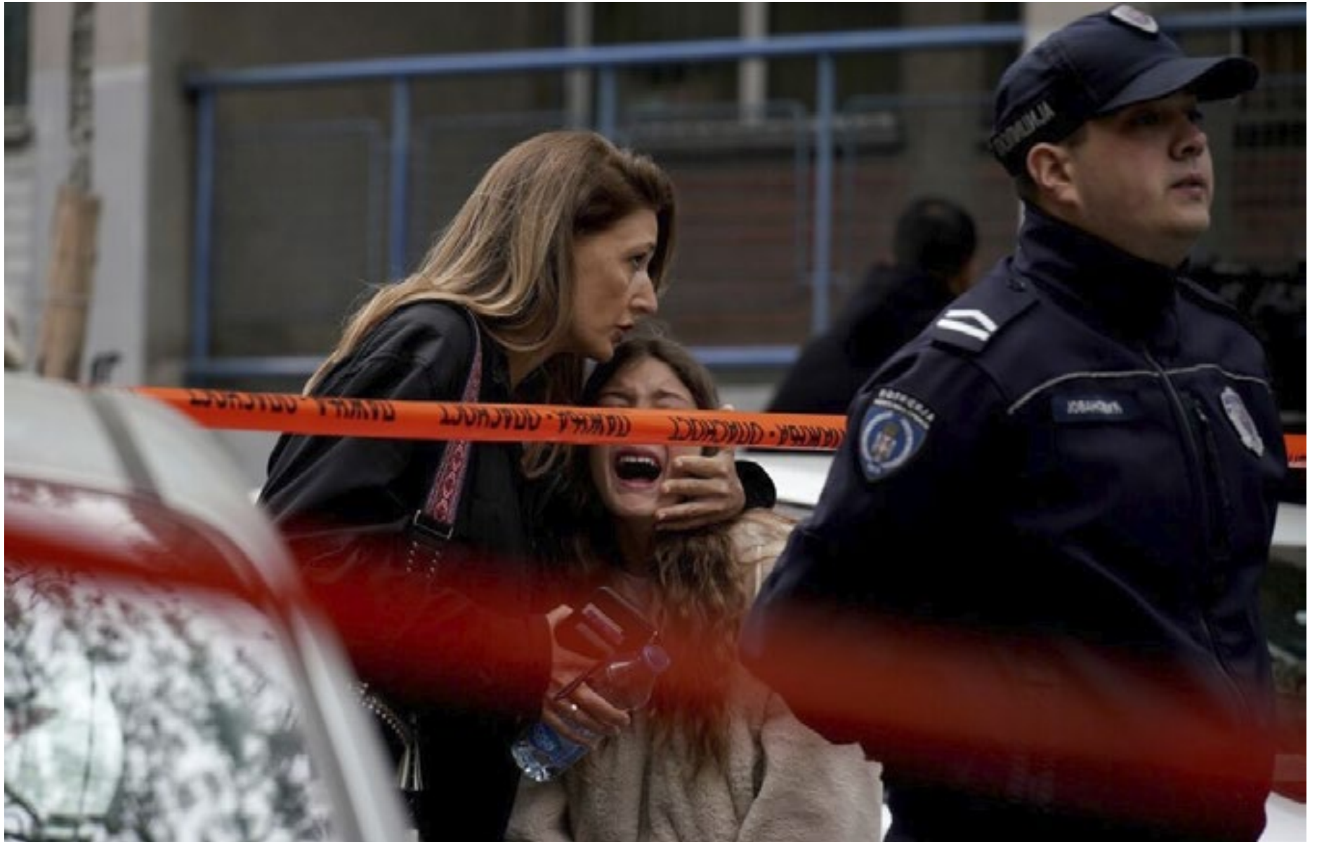
Estudante abre fogo e mata nove pessoas em escola de Belgrado