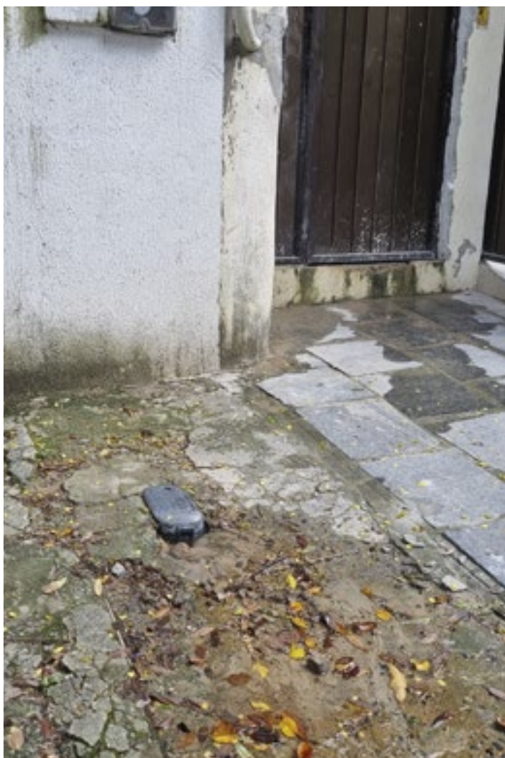
IZABEL WANDERLEY / VOZ DO LEITOR

direta da fossa de sua para para a rua, desrespeitando todas as normas de higiene e saúde. Pedimos que Prefeitura de Olinda e a vigilância sanitária adotem uma medida urgente, pois essa podridão é