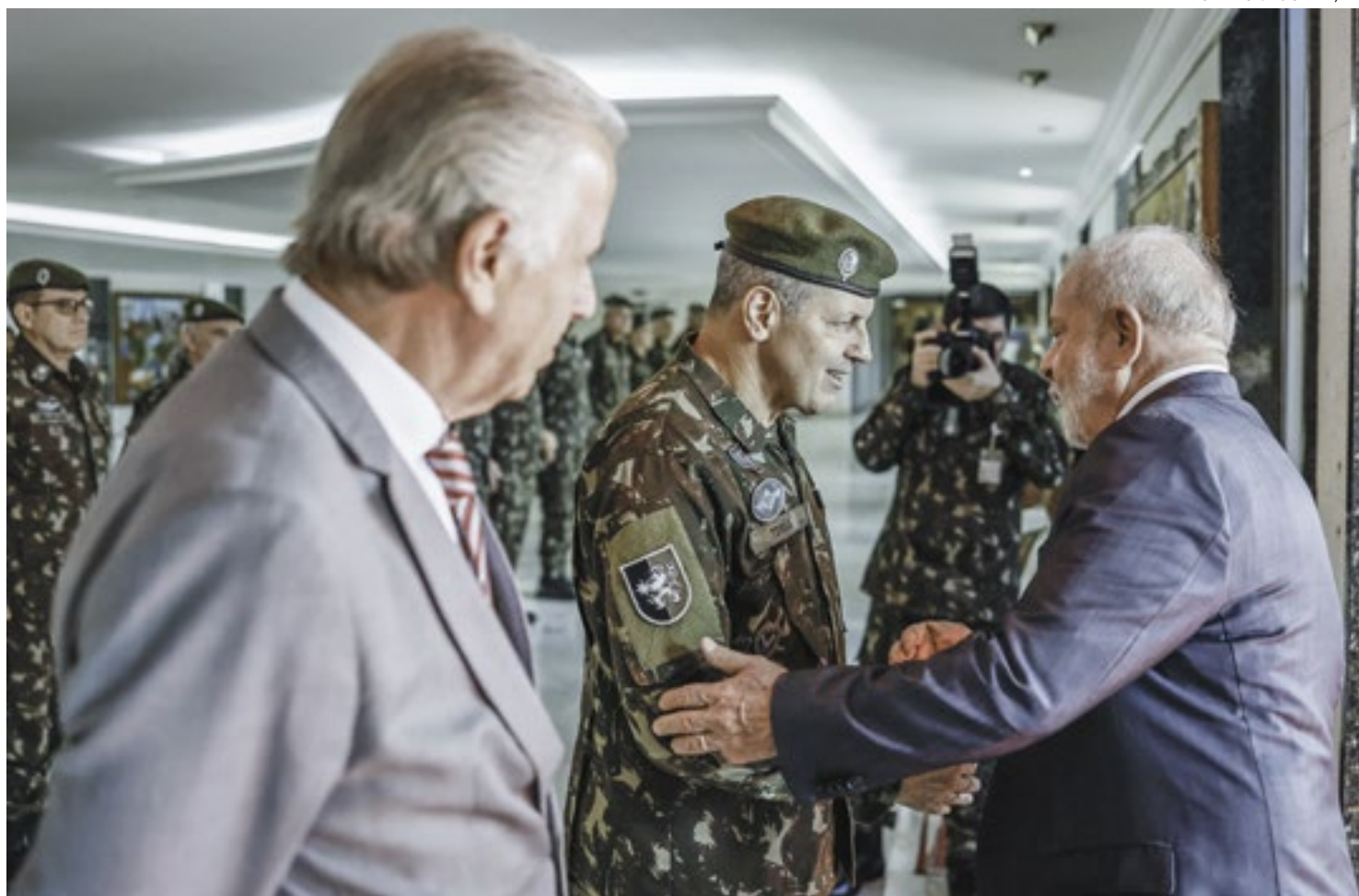
Presidente Lula chega ao quartel-general do Exército de Brasília para almoço com o Alto Comando da força