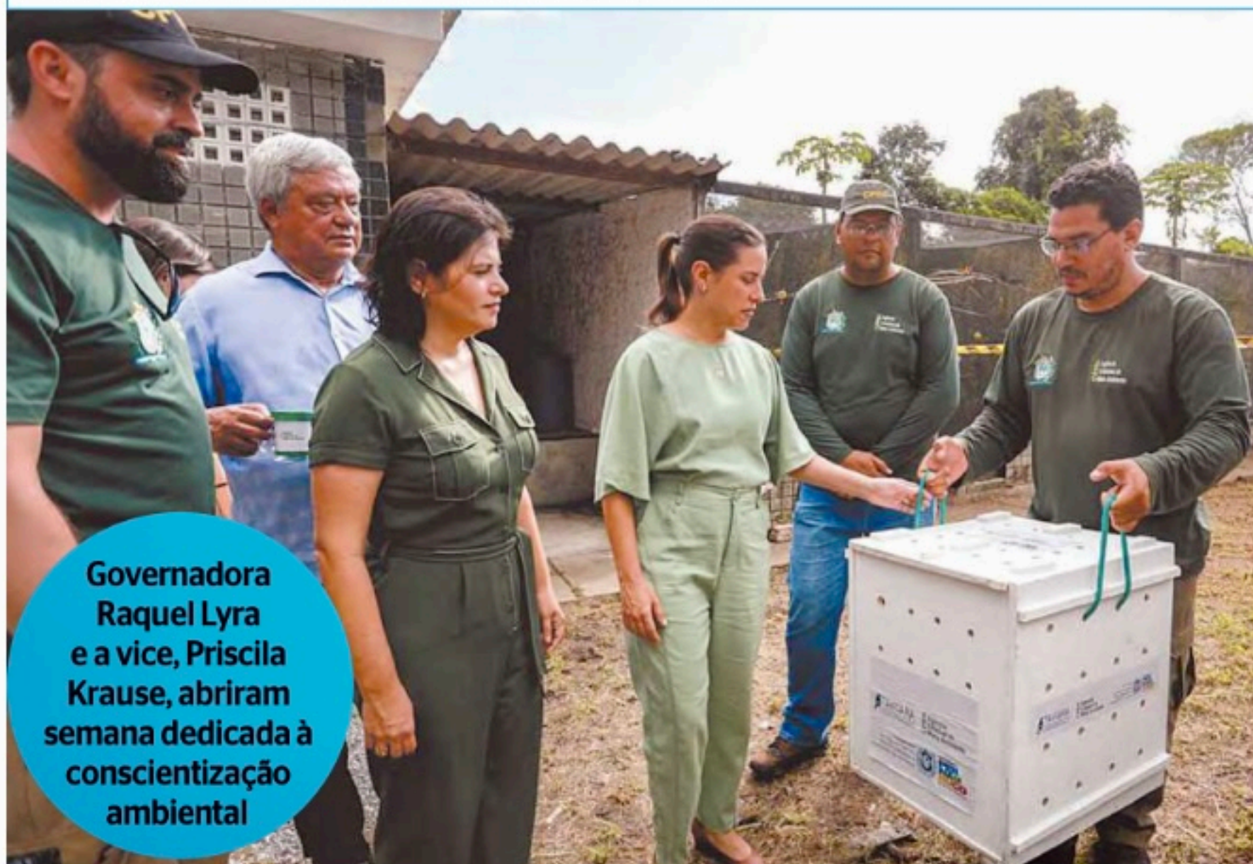
Governadora Raquel Lyra e a vice, Priscila Krause, abrem semana dedicada à conscientização ambiental