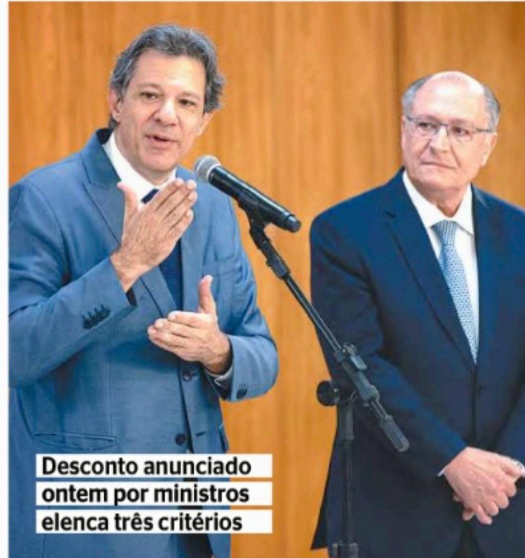
Desconto anunciado ontem por ministros elenca três critérios

No caso de ônibus e de caminhões, o desconto varia conforme o tamanho do veículo e será usado para a renovação da frota com mais de 20 anos. Micro-ônibus (vans) e pequenos caminhões receberão desconto de R$ 36,6 mil. Os ônibus de tamanho normal e grandes caminhões terão redução de R$ 99,4 mil. O grau de poluição do veículo tam-