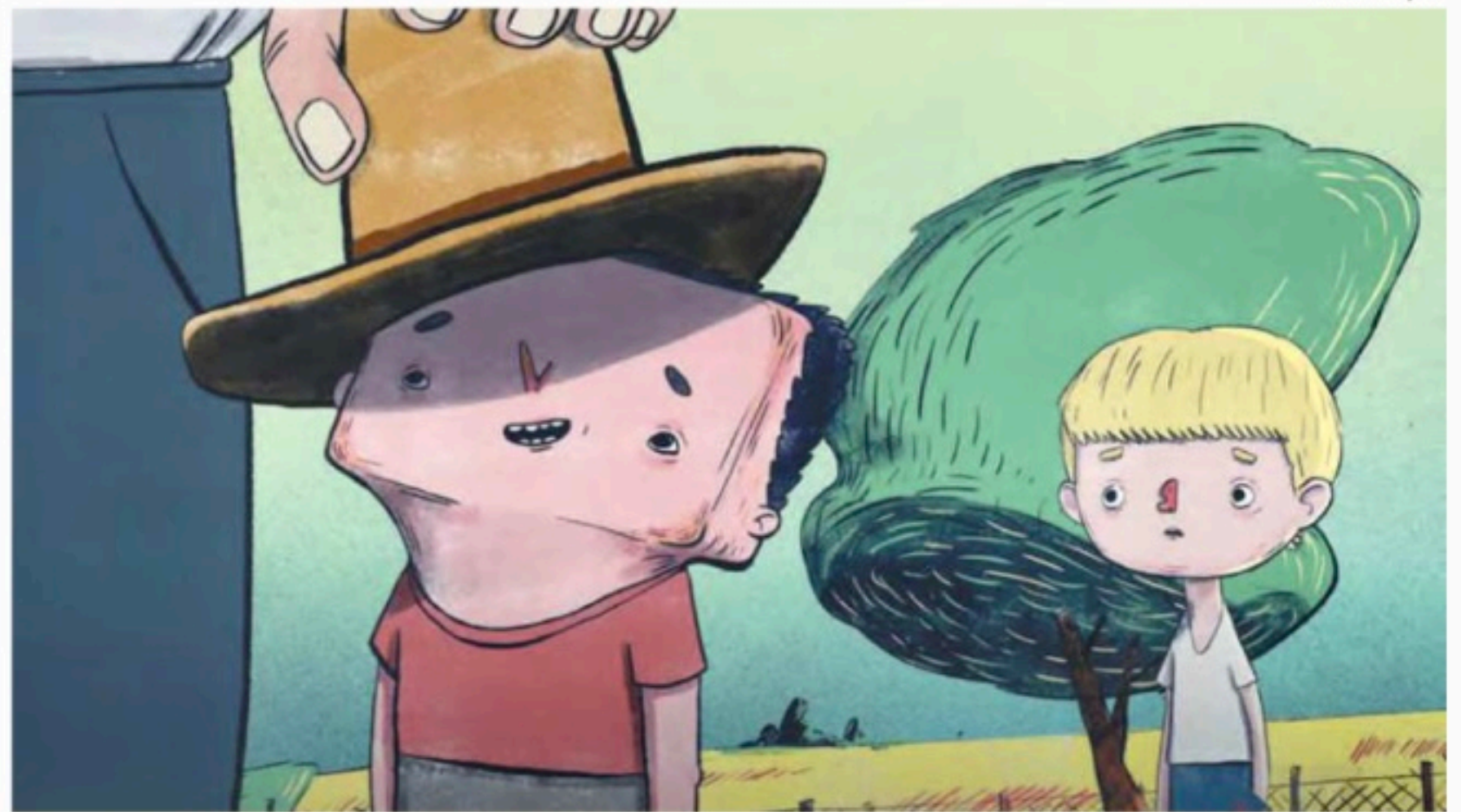
O programa é dividido em cinco categorias para crianças e jovens de 3 a 18+ anos

letramento midiático e educação da imagem (Prêmio Global Media and Information Literacy Awards). Naquela edição, o festival atingiu um público de 500 mil pessoas em 115 países. Em 2020, pela primeira vez, o projeto foi selecionado no edital realizado com recursos do Fundo de Apoio à Aprendizagem, da Fundação Lemann e