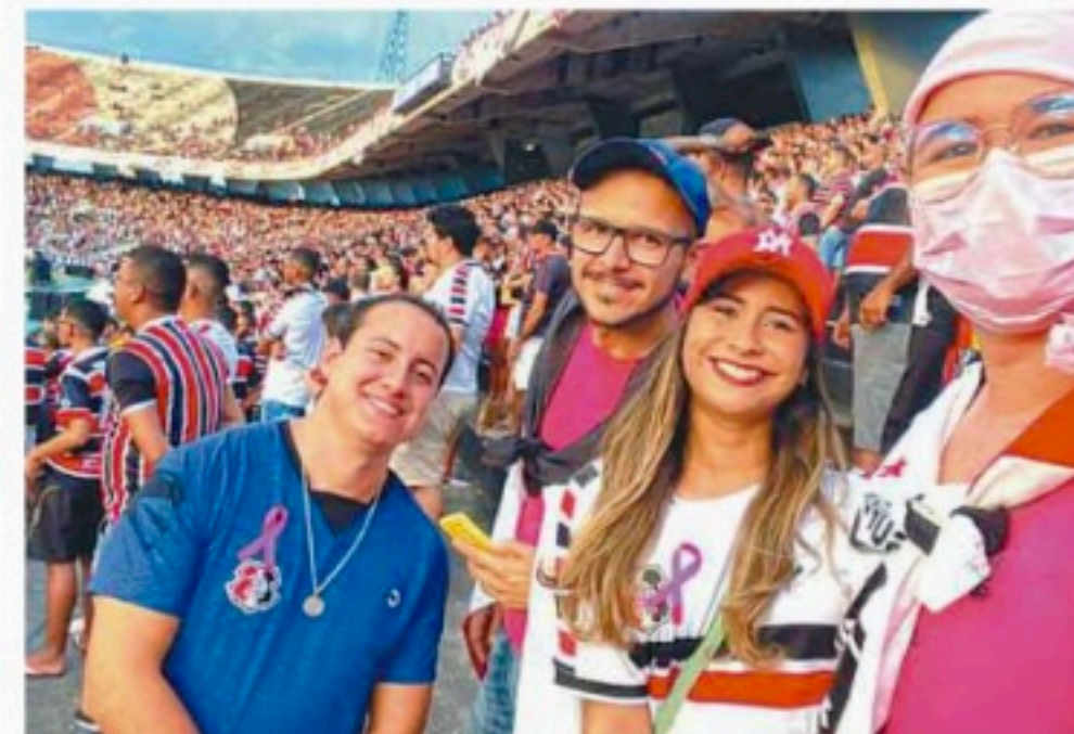
Nyanne foi ao Arruda pela 1ª vez no sábado

FELIPE HOLANDA felipe.silva@diariodepernambuco.com.br