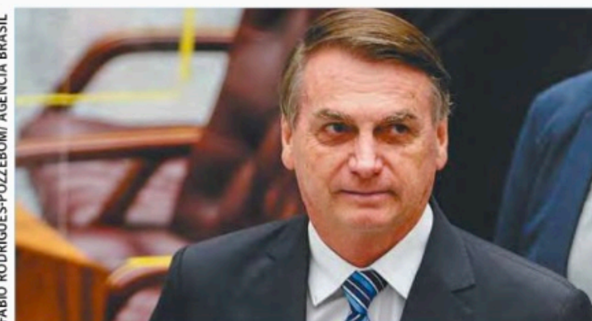
Os presentes foram recebidos em novembro de 2021