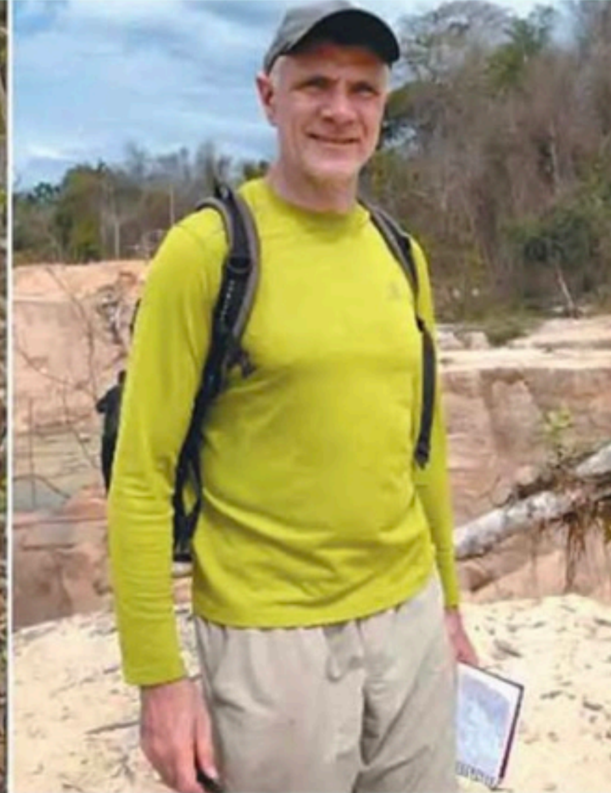
Outros três suspeitos de participação no assassinato de Bruno e Dom estão presos