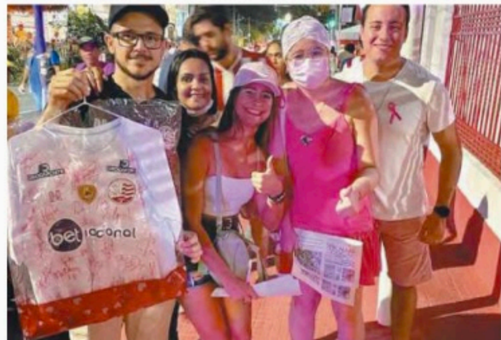
Jogadores do Náutico autografaram camisa