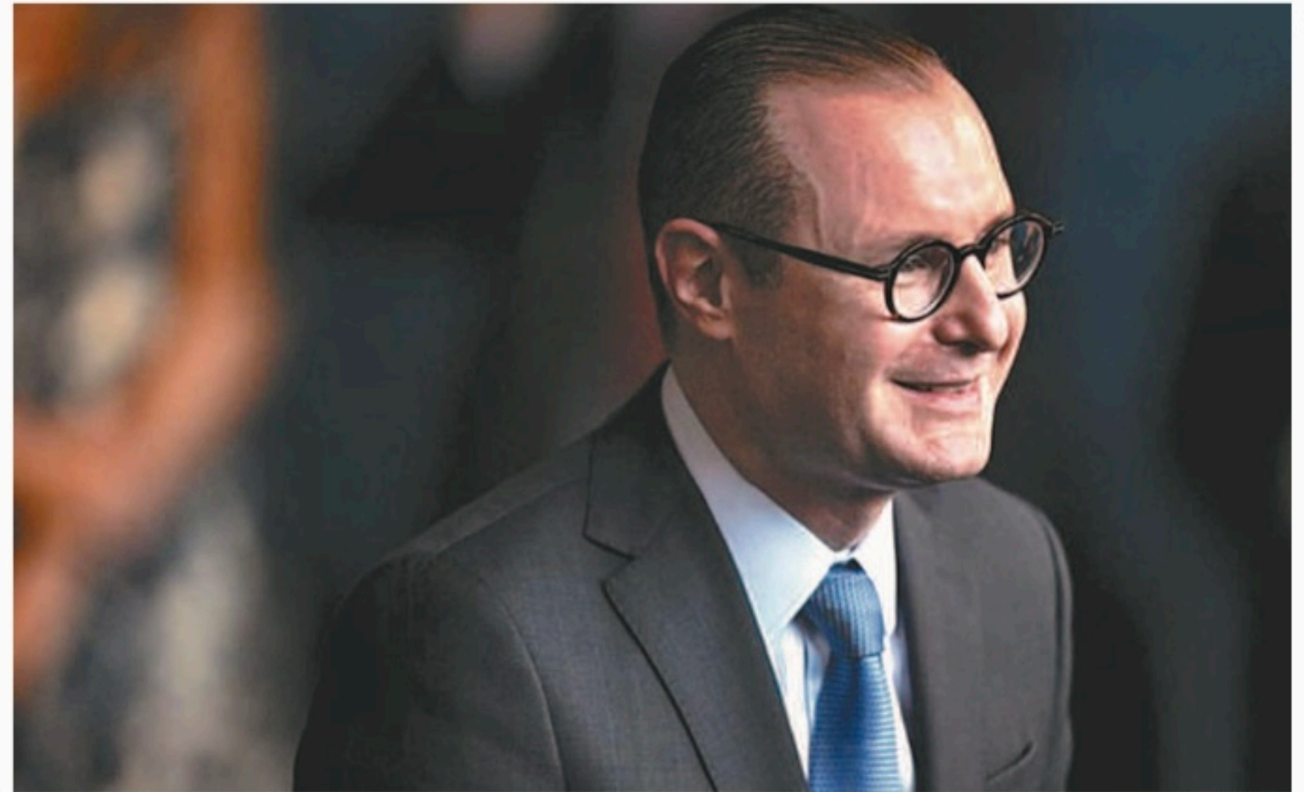
O advogado Cristiano Zanin é candidato à vaga do ex-ministro Ricardo Lewandowski

Presidente da Comissão de Constituição e Justiça, Davi Alcolumbre marcou a entrevista do indicado de Lula ao Supremo Tribunal Federal para 21 de junho