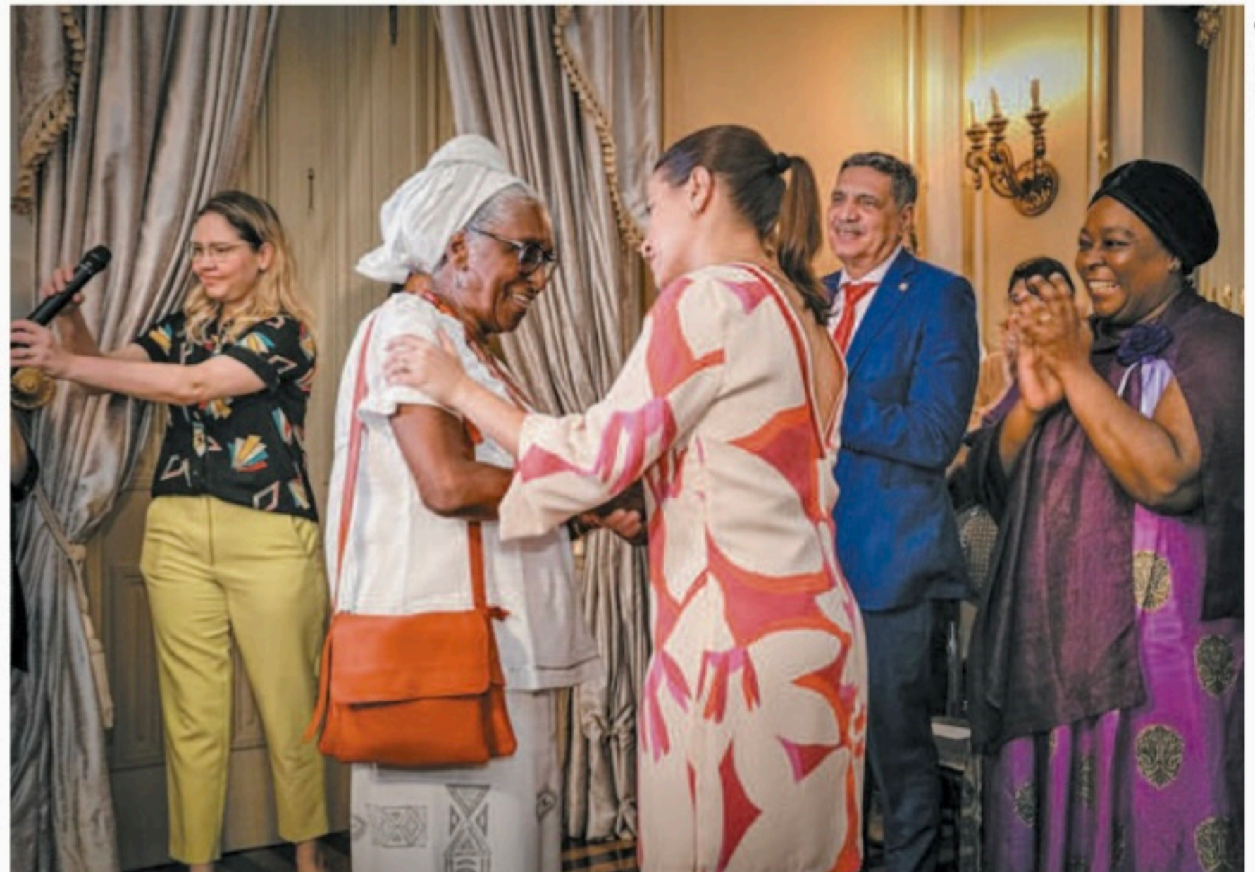
Governadora recebeu vários membros de entidades que lutam pelos direitos dos negros

Raquel Lyra sancionou a lei, aprovada em maio pela Assembleia Legislativa de Pernambuco. Movimentos sociais comemoraram aumento de proteção