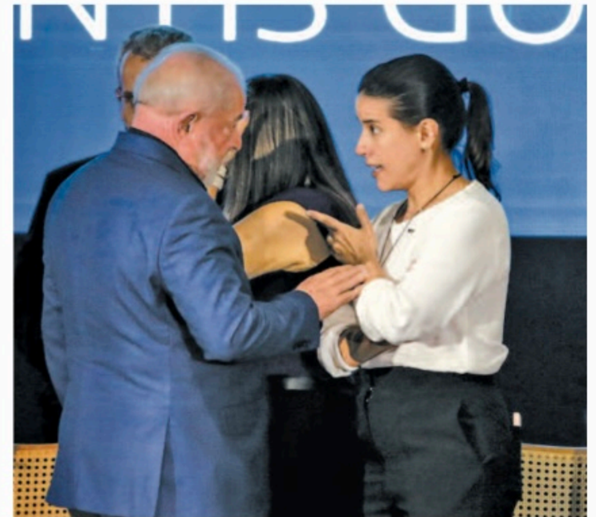
Parceria foi um dos assuntos tratados na visita de Lula

“O nosso objetivo é viabilizar a chegada dos recursos na ponta, no setor cultural, o quanto antes. Pernambuco terá o quinto maior repasse do país de recursos da Lei Paulo Gustavo e a nossa responsabilidade é fazer