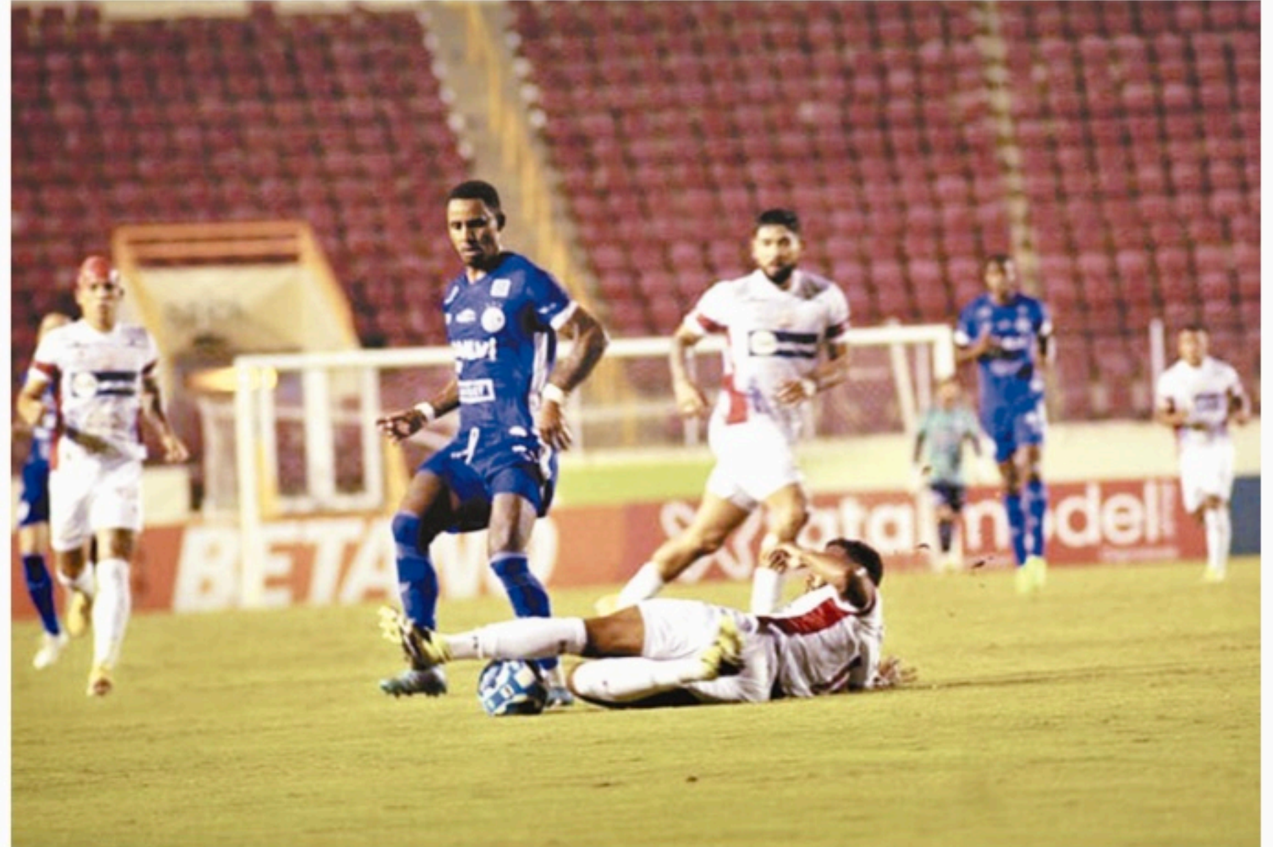
Timbu abriu 2 a 0 no placar, mas acabou cedendo o empate com um gol nos acréscimos