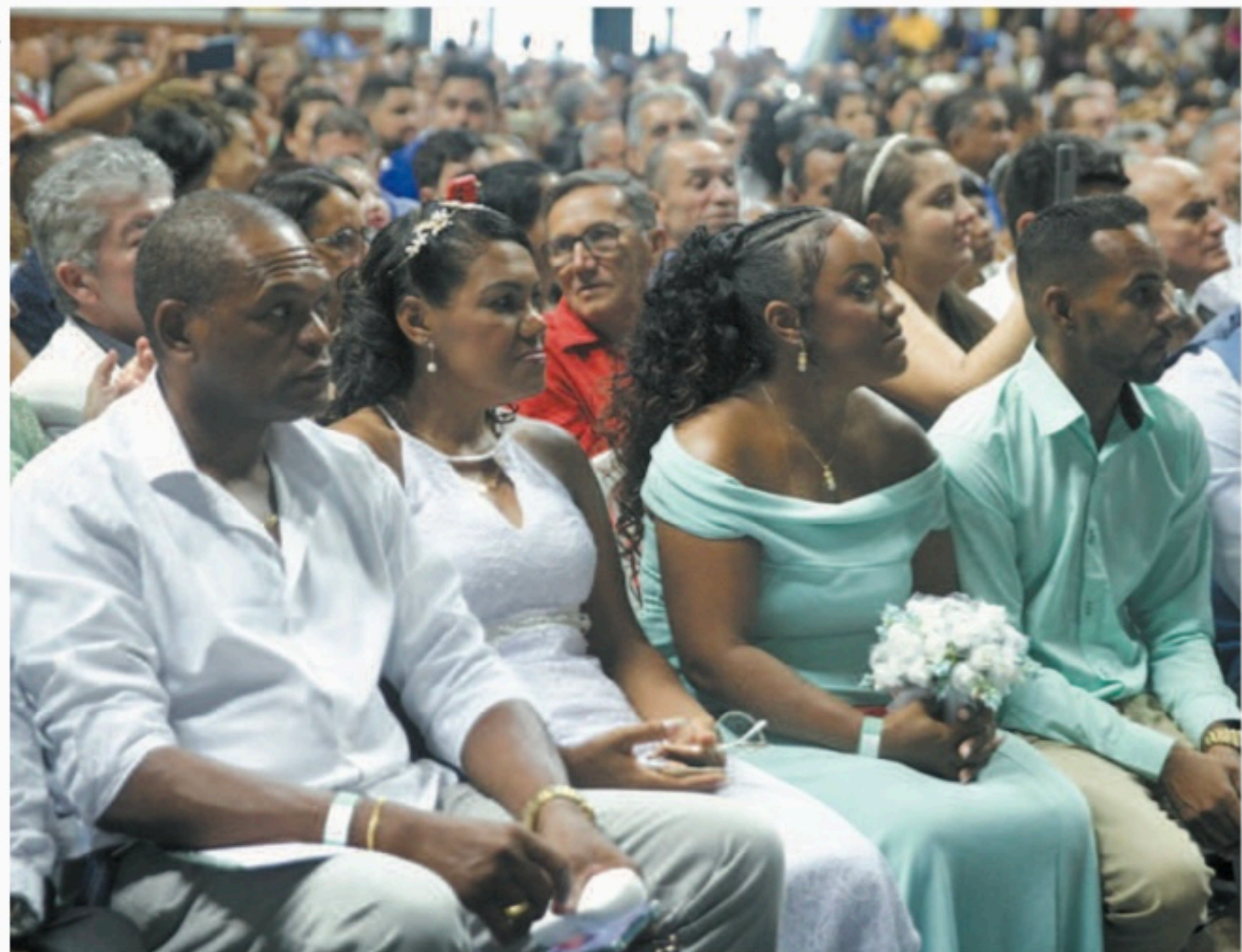
Parceria entre órgãos permitiu a união civil comunitária, no ginásio do Geraldão