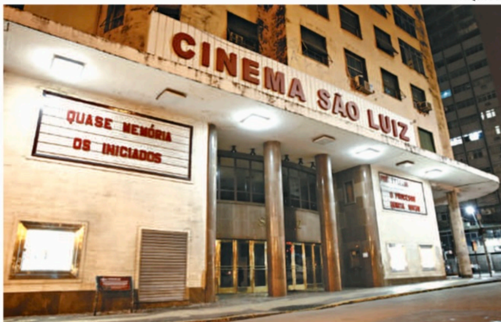
O cinema passou por quatro obras, mas problemas no esgotamento de águas persistiram