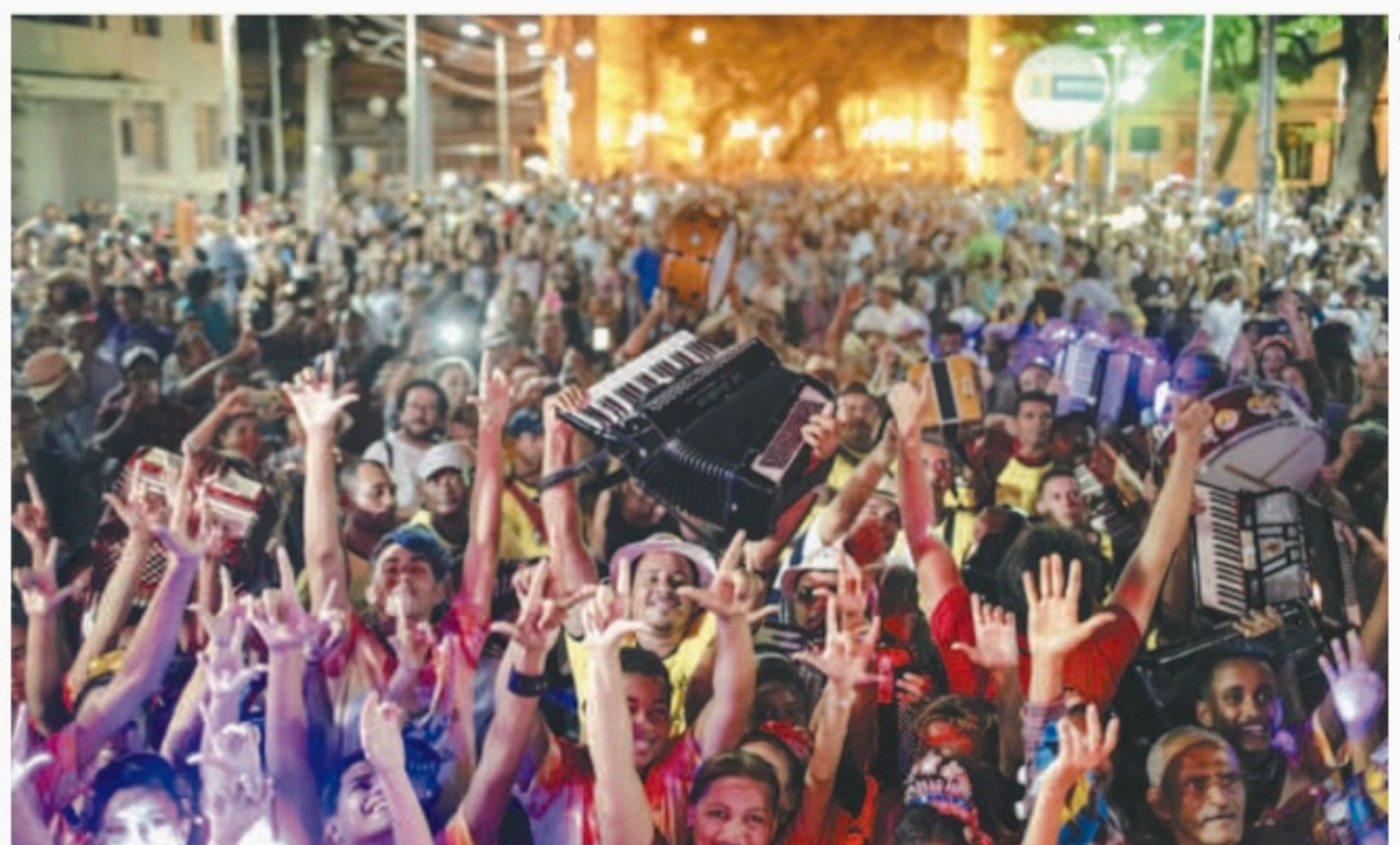
Evento não acontecia desde 2019, por causa das restrições da pandemia da Covid-19

Concentração será na Rua da Moeda. Arrastão seguirá em direção à Praça do Arsenal, com dezenas de músicos de forró