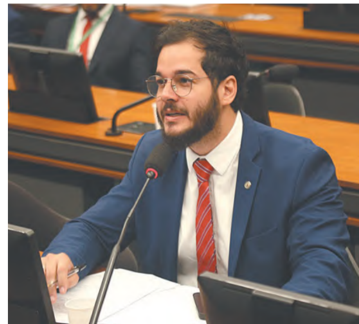
Gadêlha cobrou ações bilaterais contra o preconceito

A Embaixada do Brasil em Portugal não se manifestou publicamente sobre o caso até o fechamento desta edição.