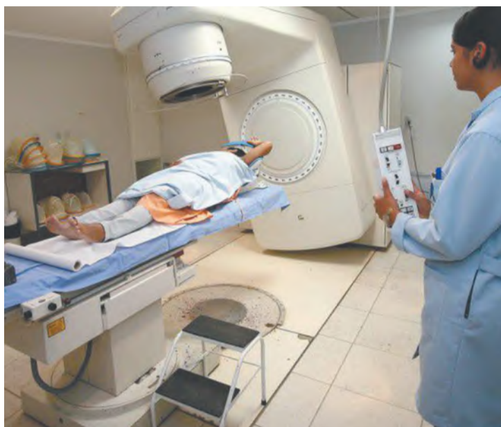
O acordo entre as duas instituições vai funcionar por meio de grupos de pesquisa específicos

“O acordo prevê desdobramentos do ponto de vista do diagnóstico, do uso das ferramentas de sequenciamento genômico para identificar as melhores alterna-