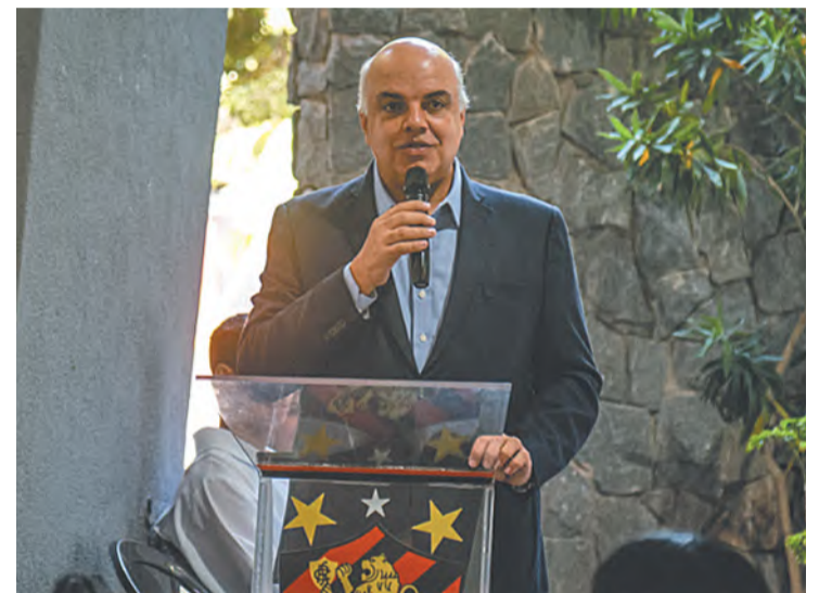
Mandatário leonino detalhou negociação com ingleses