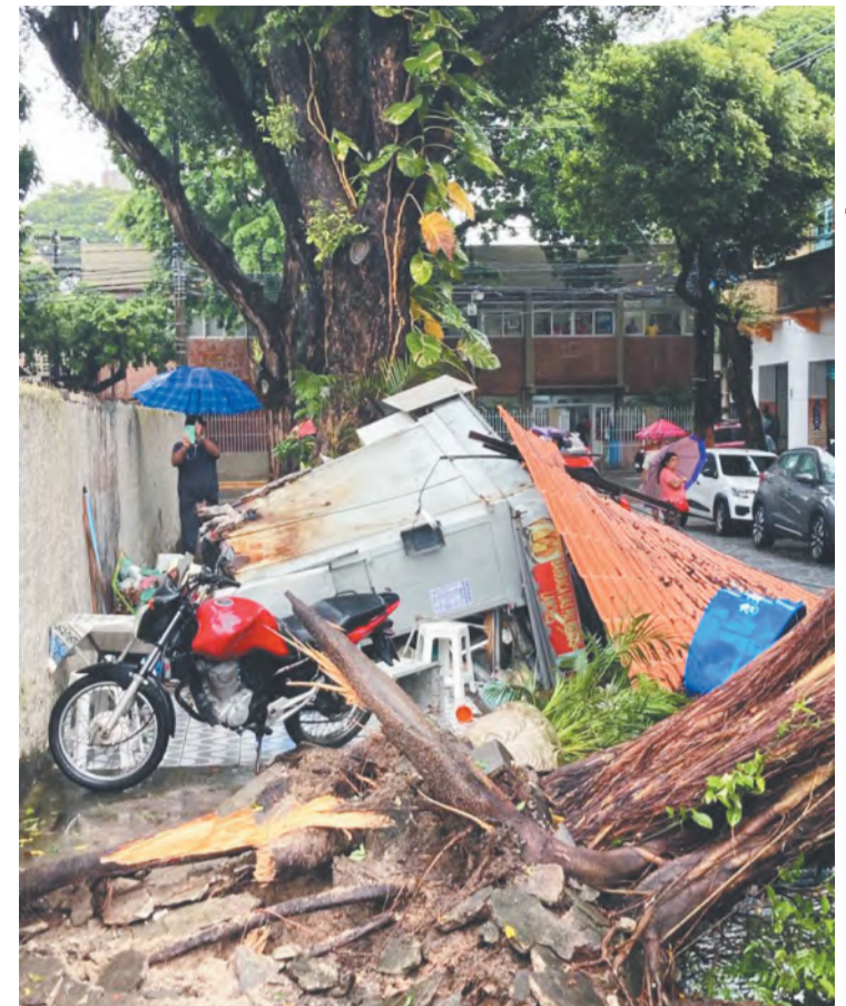
No Recife, houve transtornos, como quedas de árvores

A Apac divulgou que deve continuar chovendo hoje no Grande Recife, mas com menor intensidade. Segundo a agência, durante e madrugada e manhã desta sexta, a tendência é a de chuvas fracas, o que vale para as zonas da Mata. Já no Sertão, é de intensidade fraca a moderada.