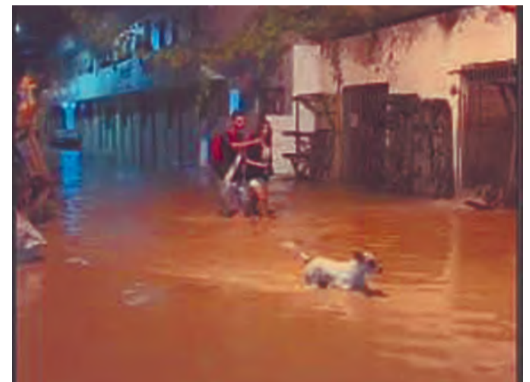
Chuva forte coincidiu com a subida da maré