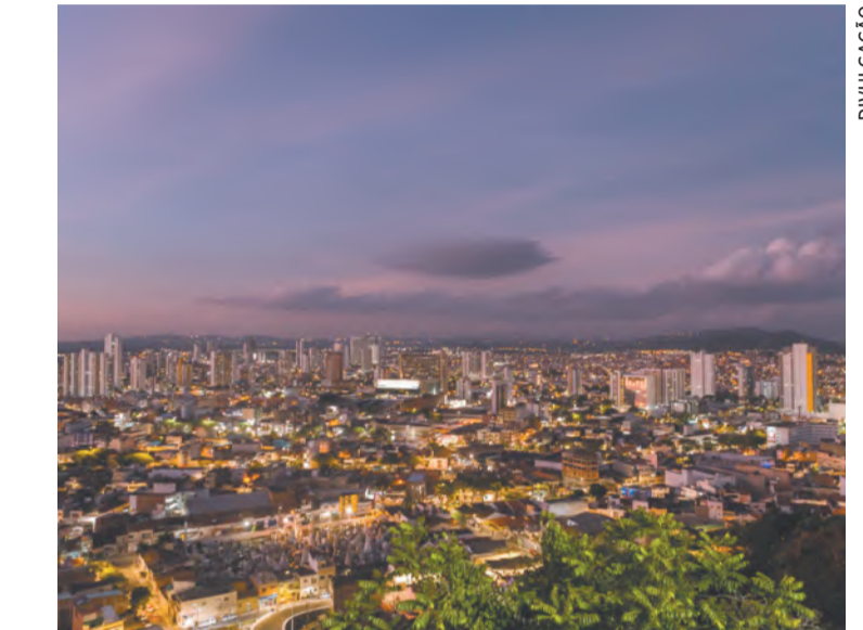
Capital do Agreste tem ampliado o atendimento digital

De acordo com a prefeitura, a plataforma garantiu ao município economia em impressões e redução considerável na utilização de papel; agilidade e rapidez na tramitação e localização de processos internos, e melhora significativa na comunicação entre os órgãos da administra-