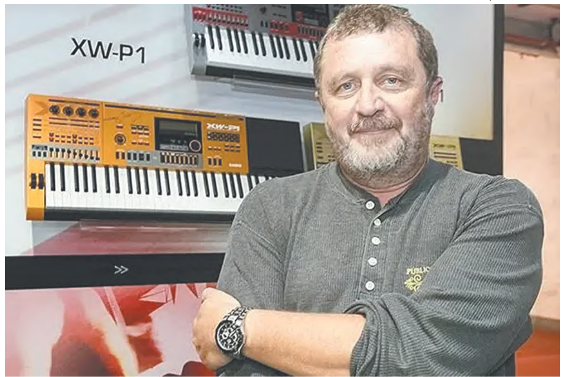
Schiavon fundou a RPM na década de 1980, juntamente com o vocalista Paulo Ricardo

Banda paulista ganhou notoriedade após as faixas ‘Olhar 43’ e ‘Rádio Pirata’ se tornarem hits aclamados pelo público