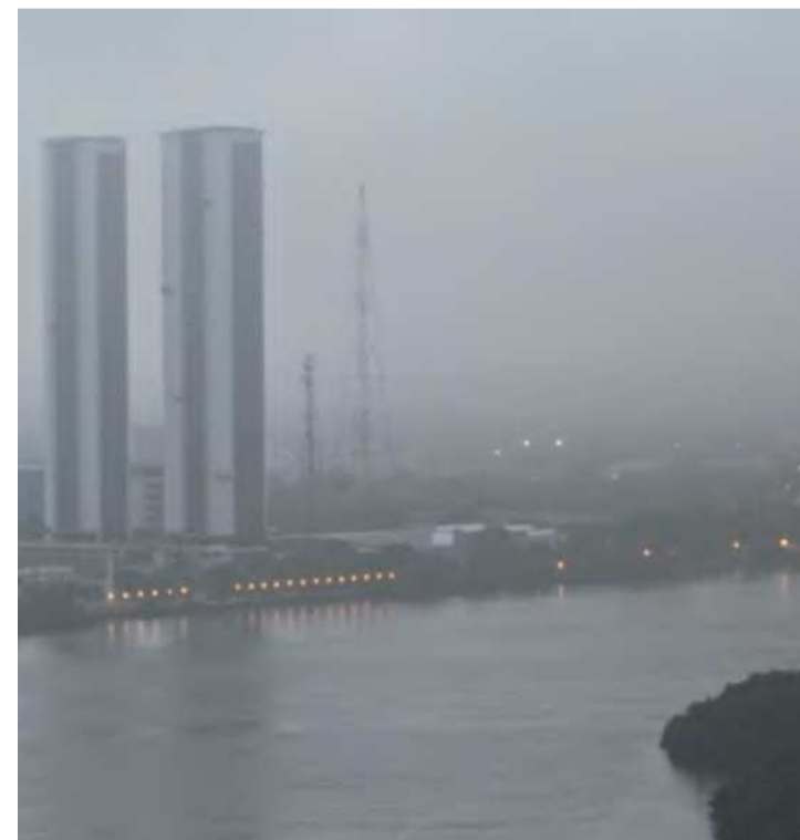
De acordo com a Apac, deve chover até julho no estado