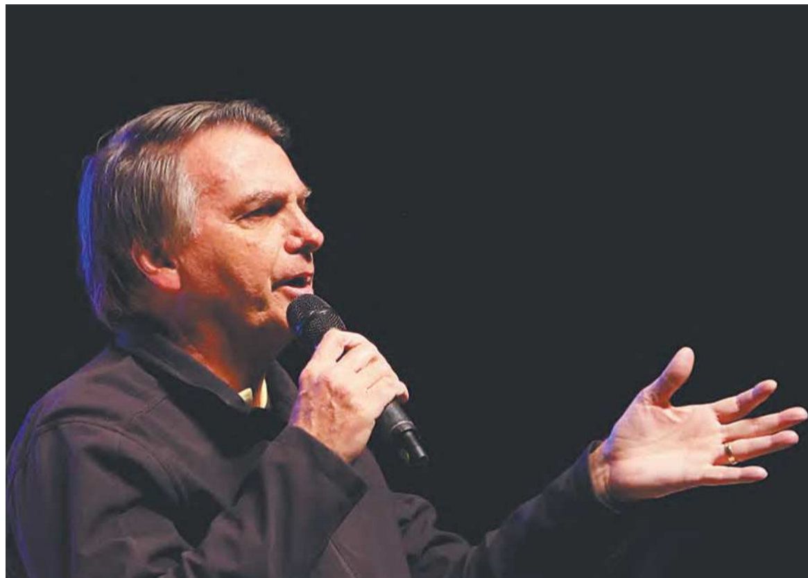
Defesa do ex-presidente contesta provas e tenta aliviar peso de falas a embaixadores

O Tribunal Superior Eleitoral (TSE) retoma, nesta terça-feira (27), a partir das 19h, o julgamento da Ação de Investigação Judicial Eleitoral (Aije) 0600814-85, que analisa a inelegibilidade de Jair Bolsonaro (PL) e de Walter Braga Netto (PL), candidatos à Presidência da República nas eleições de 2022. Ambos são acusados de abuso de poder político e uso indevido dos meios de comunicação.