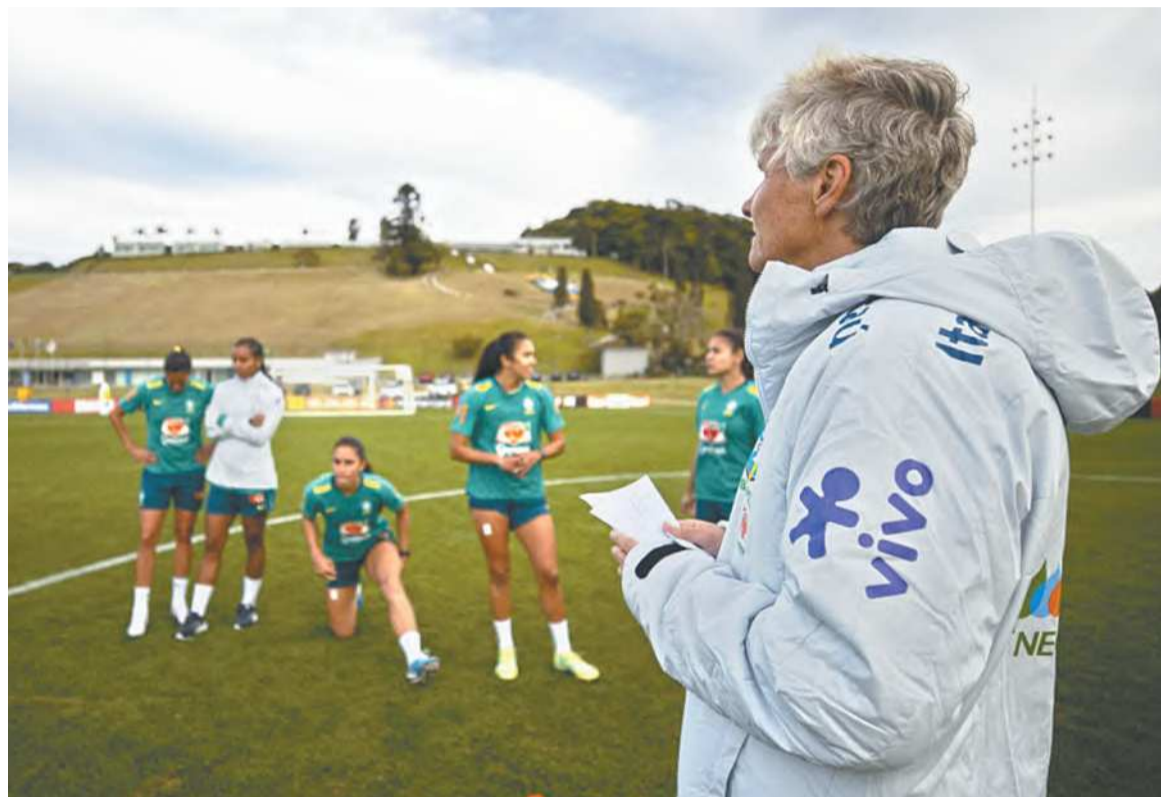
A convocação acontecerá na sede da CBF, no Rio, com transmissão ao vivo da CBFTV

A técnica Pia Sundhage anunciará hoje (27), a lista das 23 convocadas que irão representar a Seleção Brasileira na Copa do Mundo Feminina. Na oportunidade, a treinadora também irá divulgar as três suplentes que viajarão com a equipe para a Austrália. A convocação acontecerá às 16h (horário do Recife), na sede da CBF, no Rio de Janeiro (RJ), com transmissão ao vivo da CBF TV.