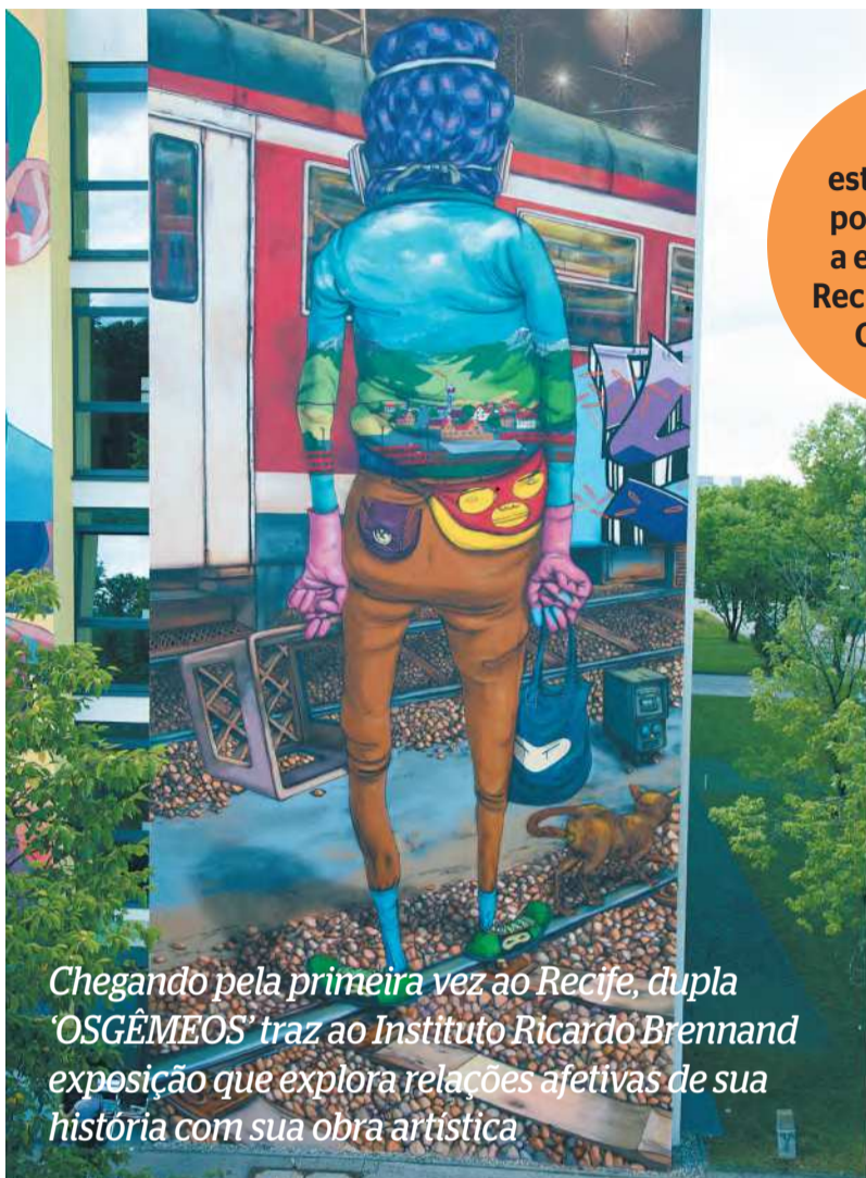
Chegando pela primeira vez ao Recife, dupla 'OSGÊMEOS' traz ao Instituto Ricardo Brennand exposição que explora relações afetivas de sua história com sua obra artística

'A gente está muito feliz por apresentar a exposição no Recife', ressaltam OSGÊMEOS