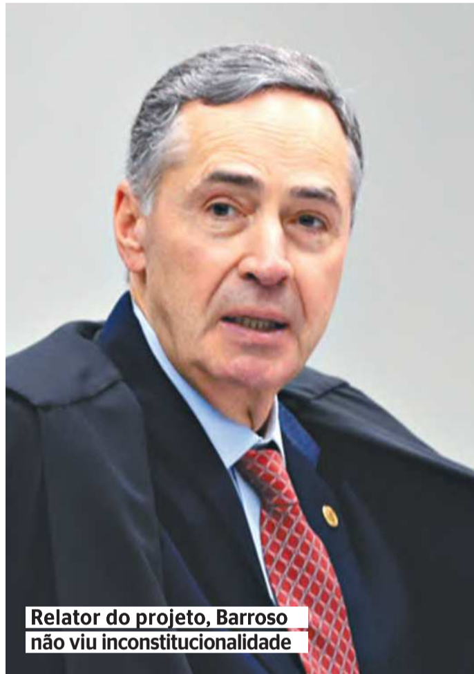
Relator do projeto, Barroso não viu inconstitucionalidade

ao retrocesso, que ainda desperta controvérsias na doutrina, não pode ser interpretado como uma proibição a qualquer atuação restritiva do legislador em matéria de direitos fundamentais, sob pena de violação ao princípio democrático”, afirmou.