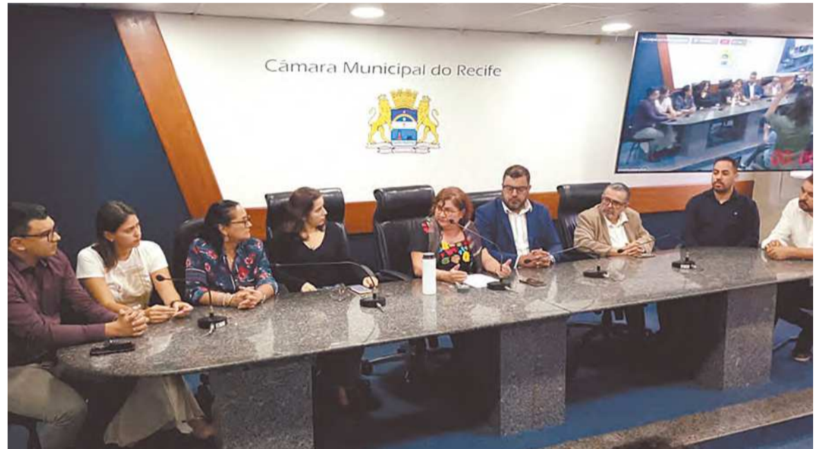
Vereadores e representantes do setor da saúde defenderam readequações na legislação

TAINÁ MILENA politica@diariodepernambuco.com.br