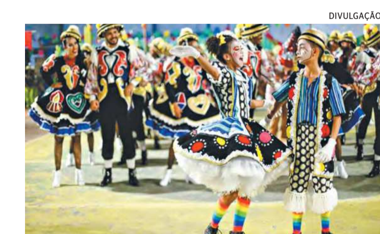
Neste ano, 14 grupos foram qualificados para a disputa

No Polo de Barra de Jangada, a festa será animada no sábado (1º) pelo Forró Xodó, Magia Nordestina e Anjos do Forró. E fechando a programação junina de Jaboatão, no próximo domingo (2), em Barra de Jangada, a animação ficará por conta