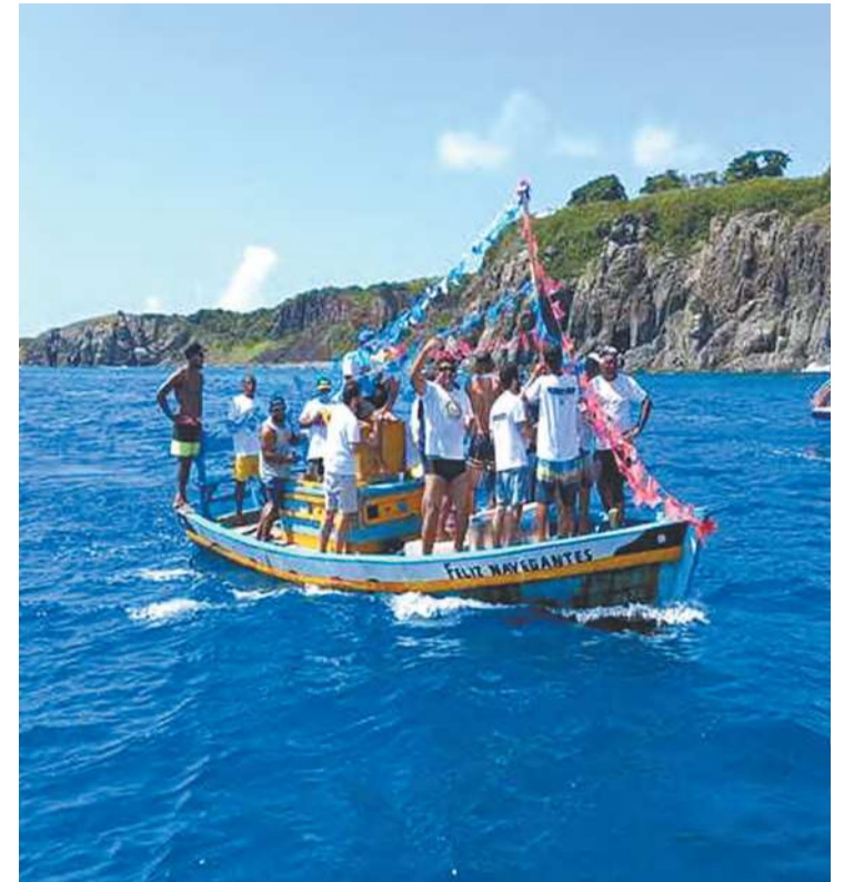
Organizadores esperam a participação de 100 barcos

Na volta, em torno das 13h, os participantes da barqueata são recebidos com a peixada, servida para quem estiver presente, de forma gratuita. Os shows começam às 17h.