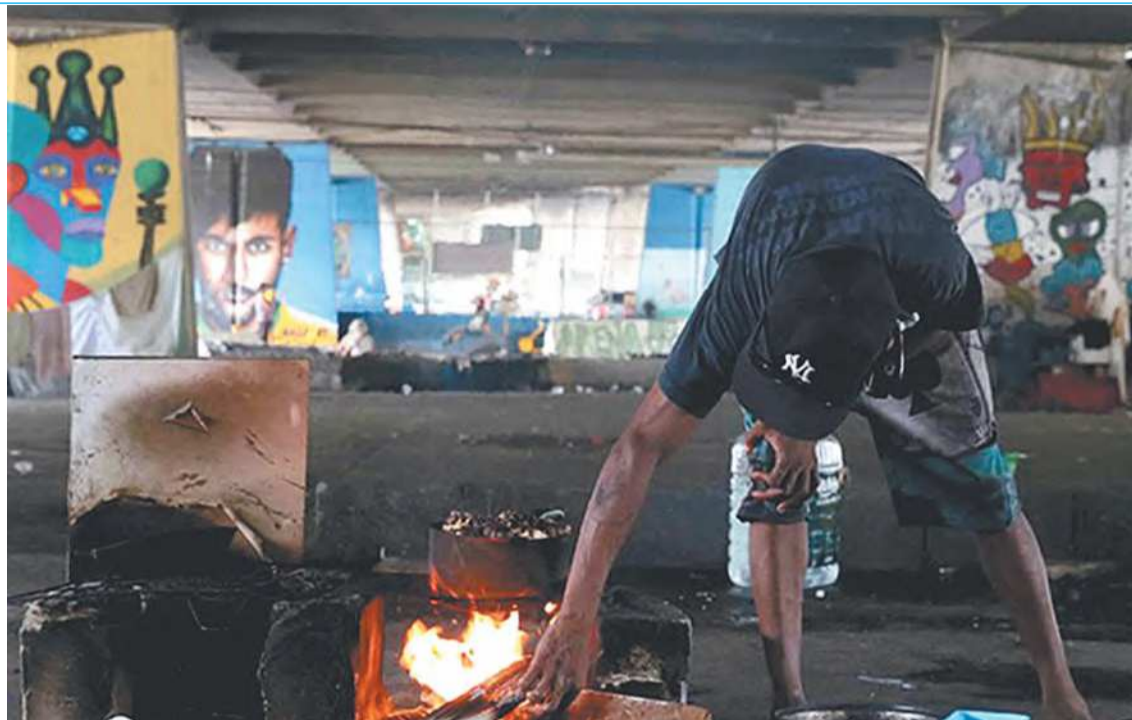
Dados divulgados são referentes ao período entre novembro de 2021 e abril de 2022