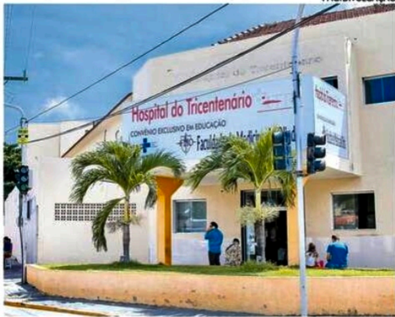
Mais duas pessoas são diagnosticadas no Tricentenário