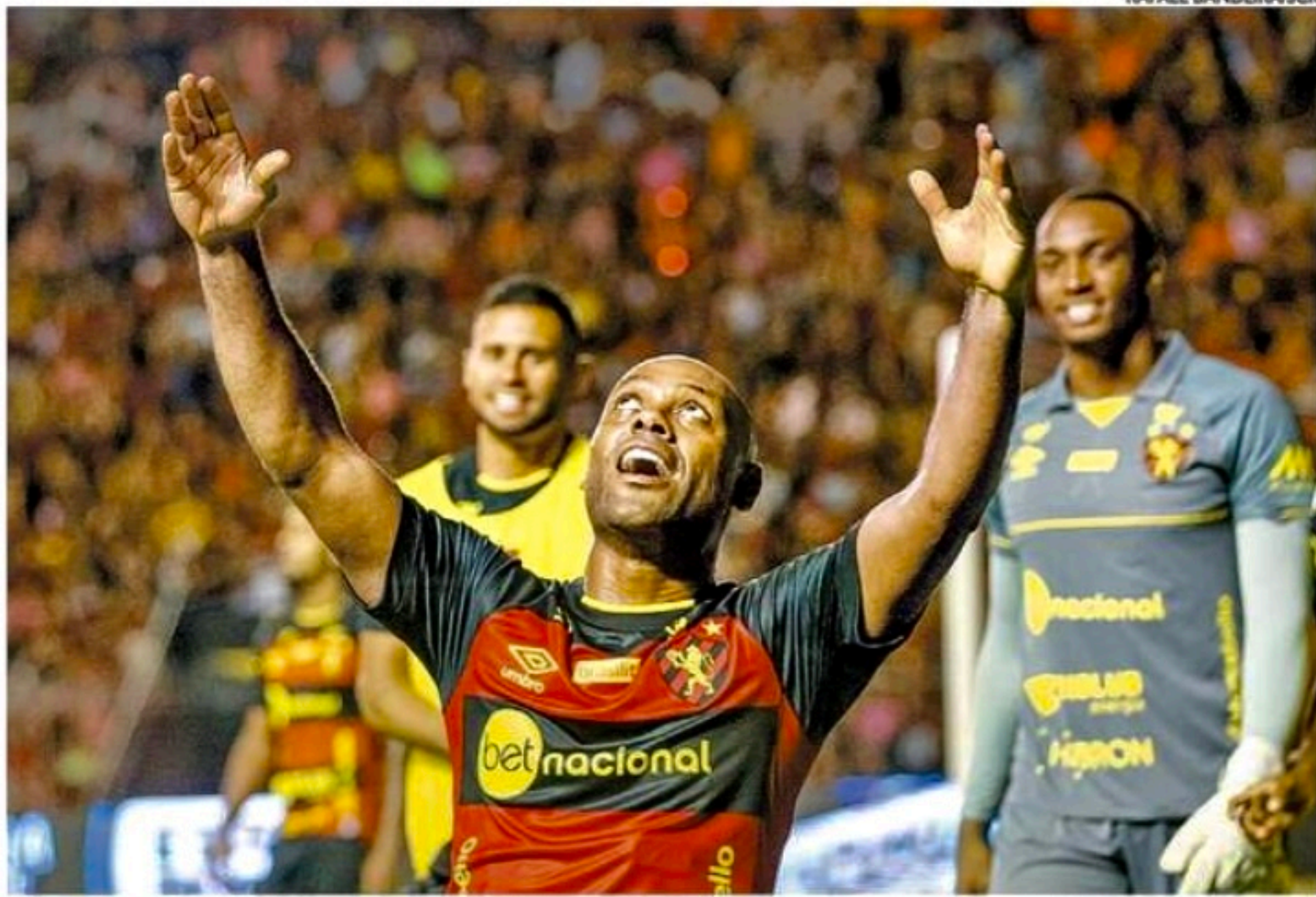
Vagner Love é o terceiro maior goleador do ano no Brasil empatado com Hulk, do Atlético-MG