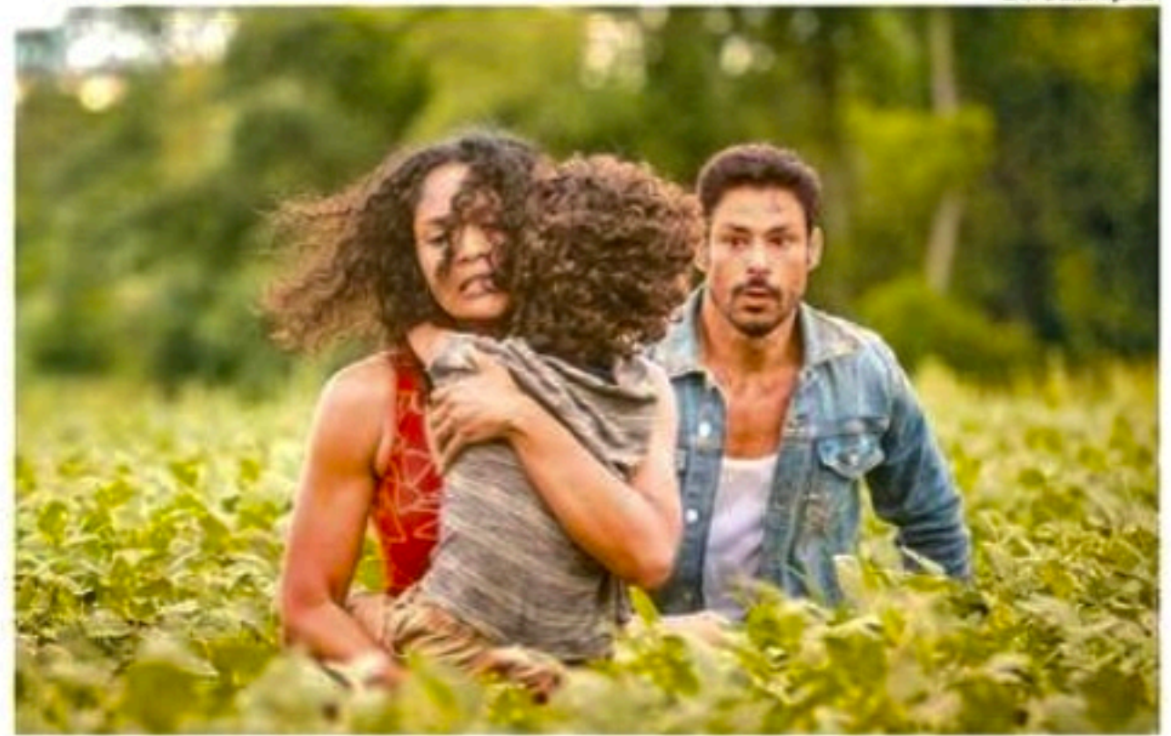
"Terra e Paixão" é mais um roteiro bem-sucedido de Carrasco