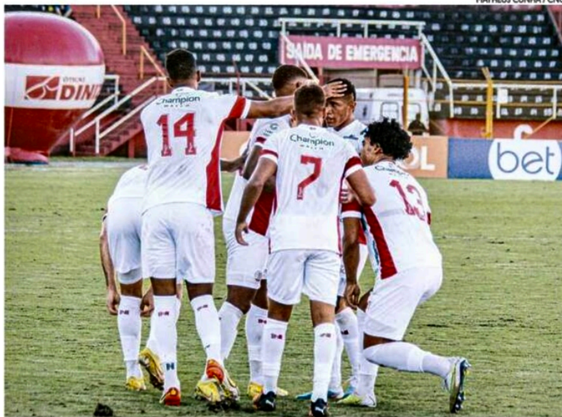
Alvirrubros vêm de triunfo por 1x0, fora de casa, diante do Pouso Alegre

“Jogaremos ao lado do nosso torcedor. Na Série C, é importante ter uma sequência de vitórias para se manter sempre entre os oito e buscar o acesso”, afirmou o