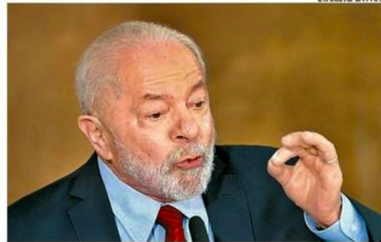
Presidente vem pela segunda vez a Pernambuco desde a posse em janeiro

O presidente do Tribunal Superior Eleitoral, ministro Alexandre de Moraes, pautou para o próximo dia 22 de junho o julgamento da ação que pode tornar o ex-presidente Bolsonaro inelegível por oito anos. Corregedor-geral da Justiça Eleitoral, o ministro Benedito Gonçalves liberou o relatório final da ação para ir a plenário na última quinta.