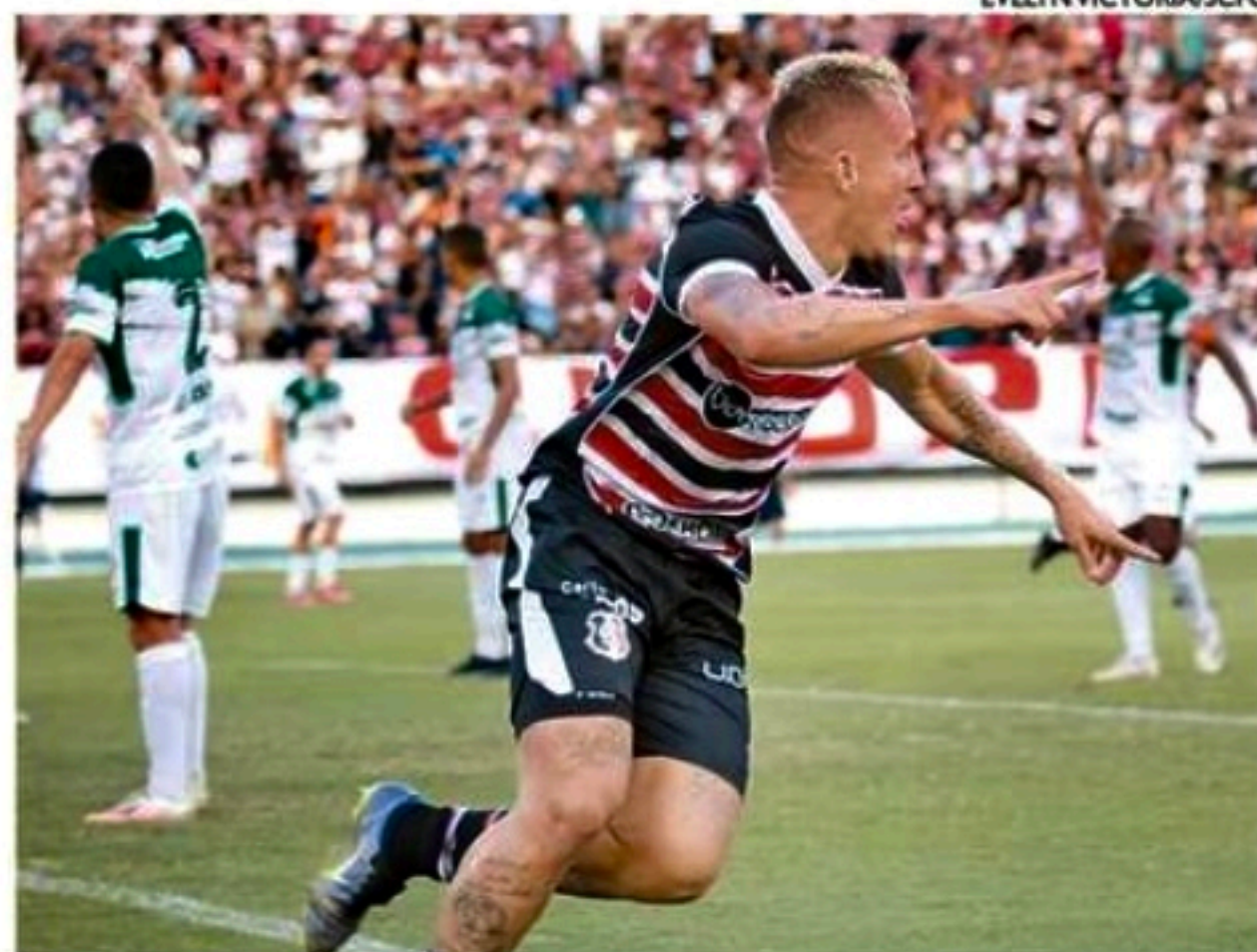
Expectativa é que atacante continue como titular no jogo desta quinta

A expectativa é que o jogador continue titular no confronto da próxima quinta-feira, diante do Pacajus, pela sexta rodada da Série D. O confronto envolve os dois primeiros colocados do Grupo 3, ambos com 10 pontos, podendo definir o líder isolado.