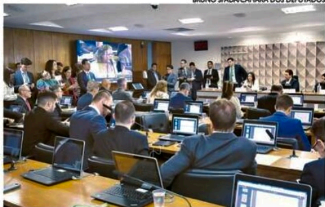
Na semana passada, a CPMI se reuniu e aprovou o plano de trabalho