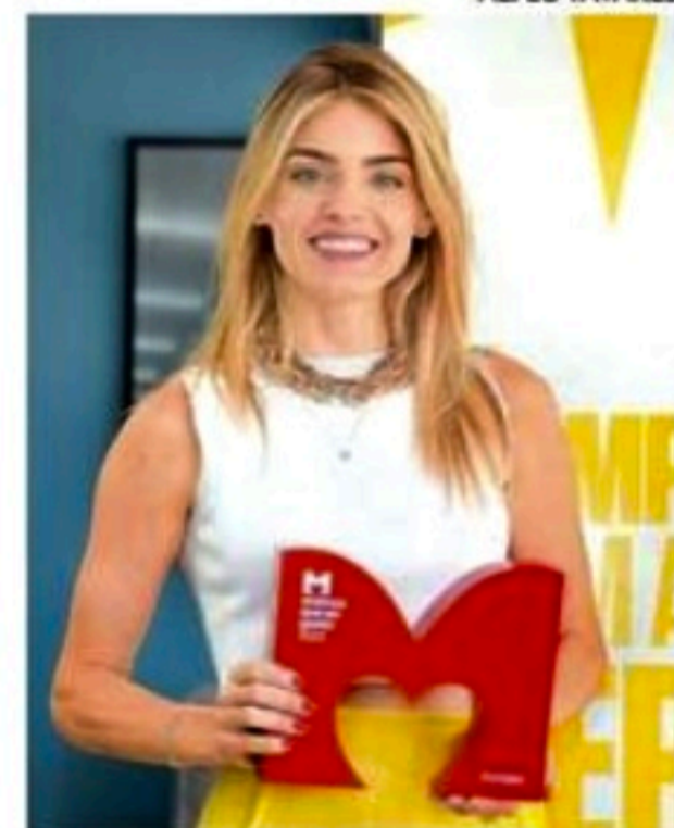
Mariana explica que também é fundamental trazer a discussão sobre o papel social das marcas