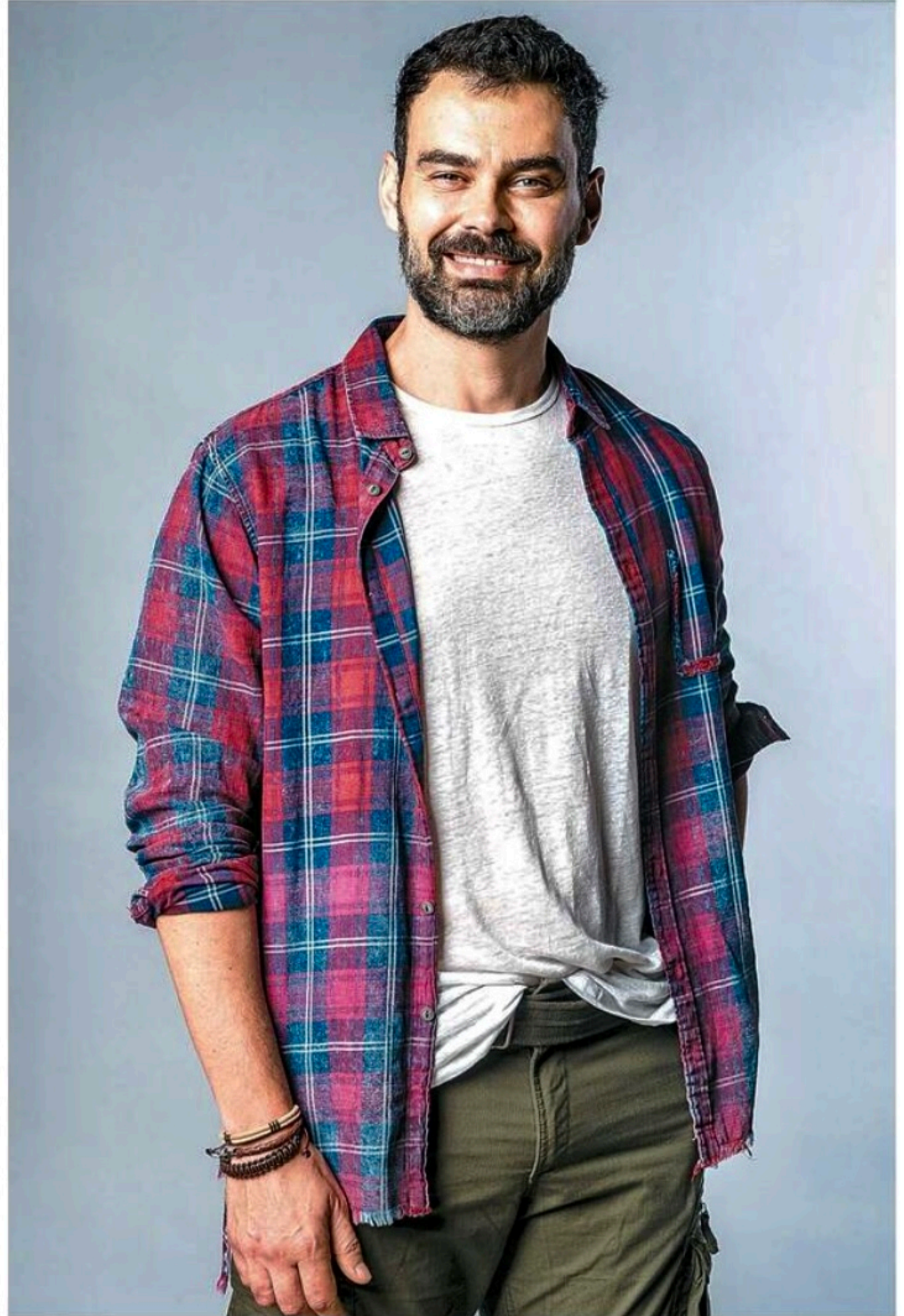
Ator interpreta personagem homossexual que sofre preconceito, por volta da década de 1940

1940, a gente já tenha muitos homens como eu, na vida real, que passaram por circunstâncias parecidas. E por muito tempo tiveram de se esconder, negar seus sentimentos. Tive de resguardar a minha identidade e orientação sexual.