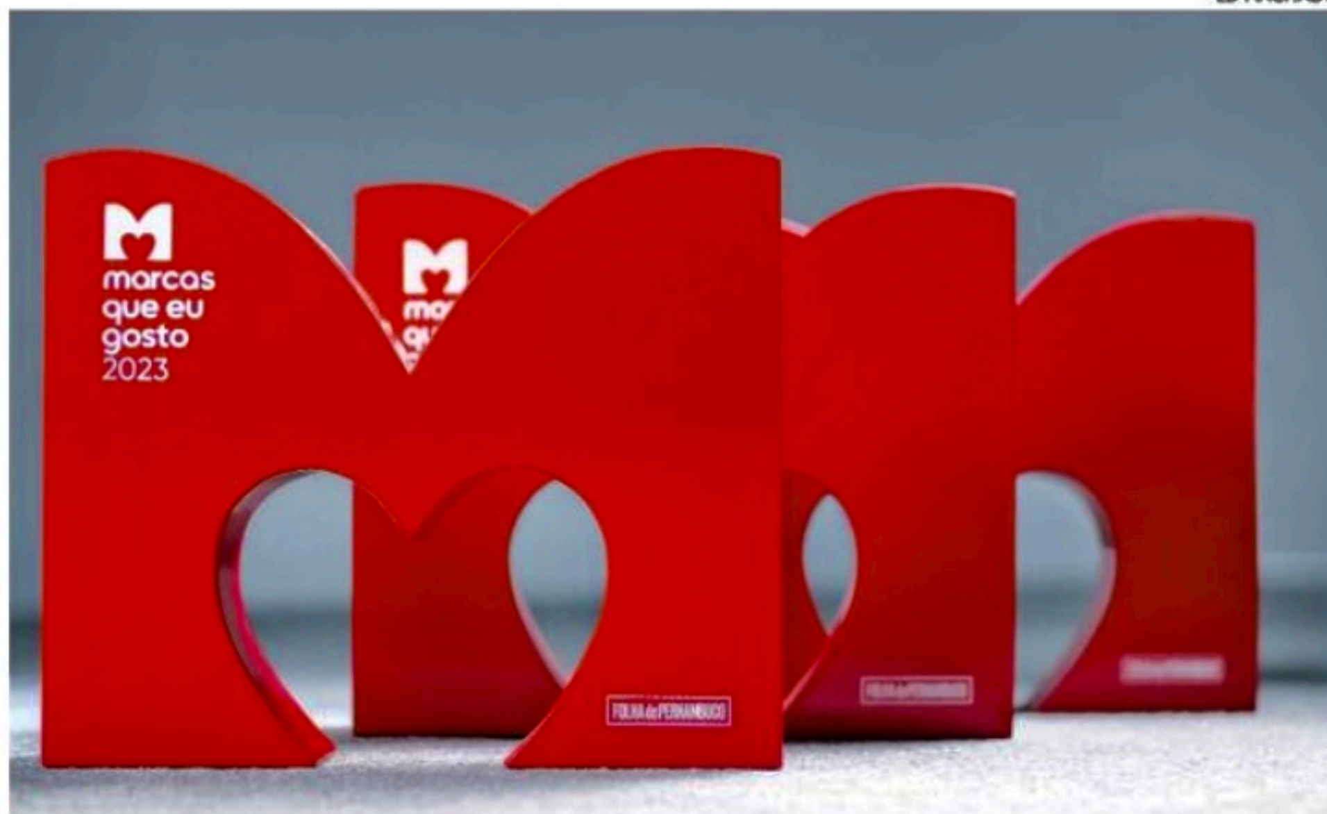
Troféus serão entregues em evento para convidados, hoje à noite, no Museu Cais do Sertão