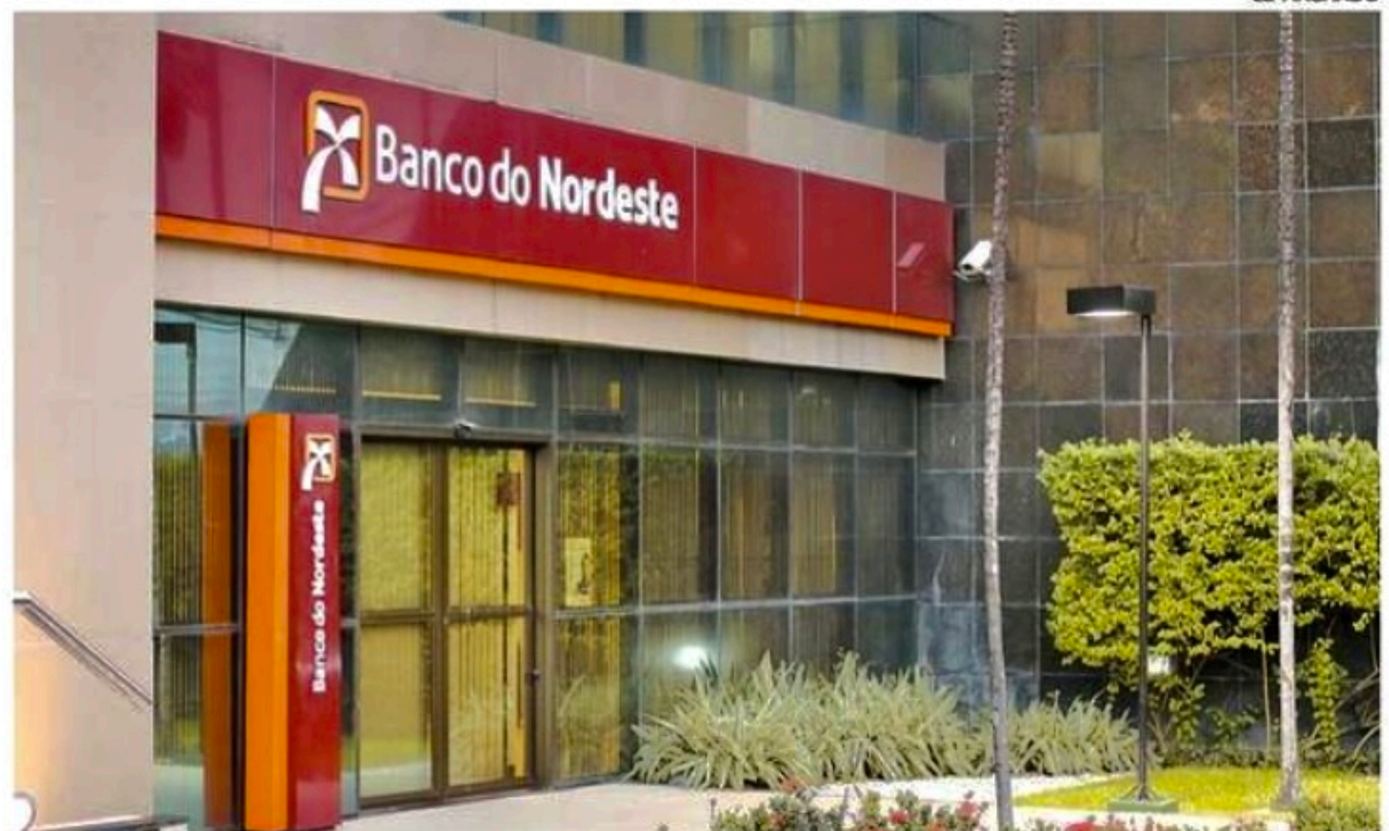
O projeto do BNB prevê o repasse de recursos não reembolsáveis para promover melhorias na produção

Por meio dessa medida, a instituição argumenta que busca a criação de metodologias replicáveis para impulsionar a produção rural das unidades familiares. Dessa forma, eles afirmam promover “a melhoria nas condições para o