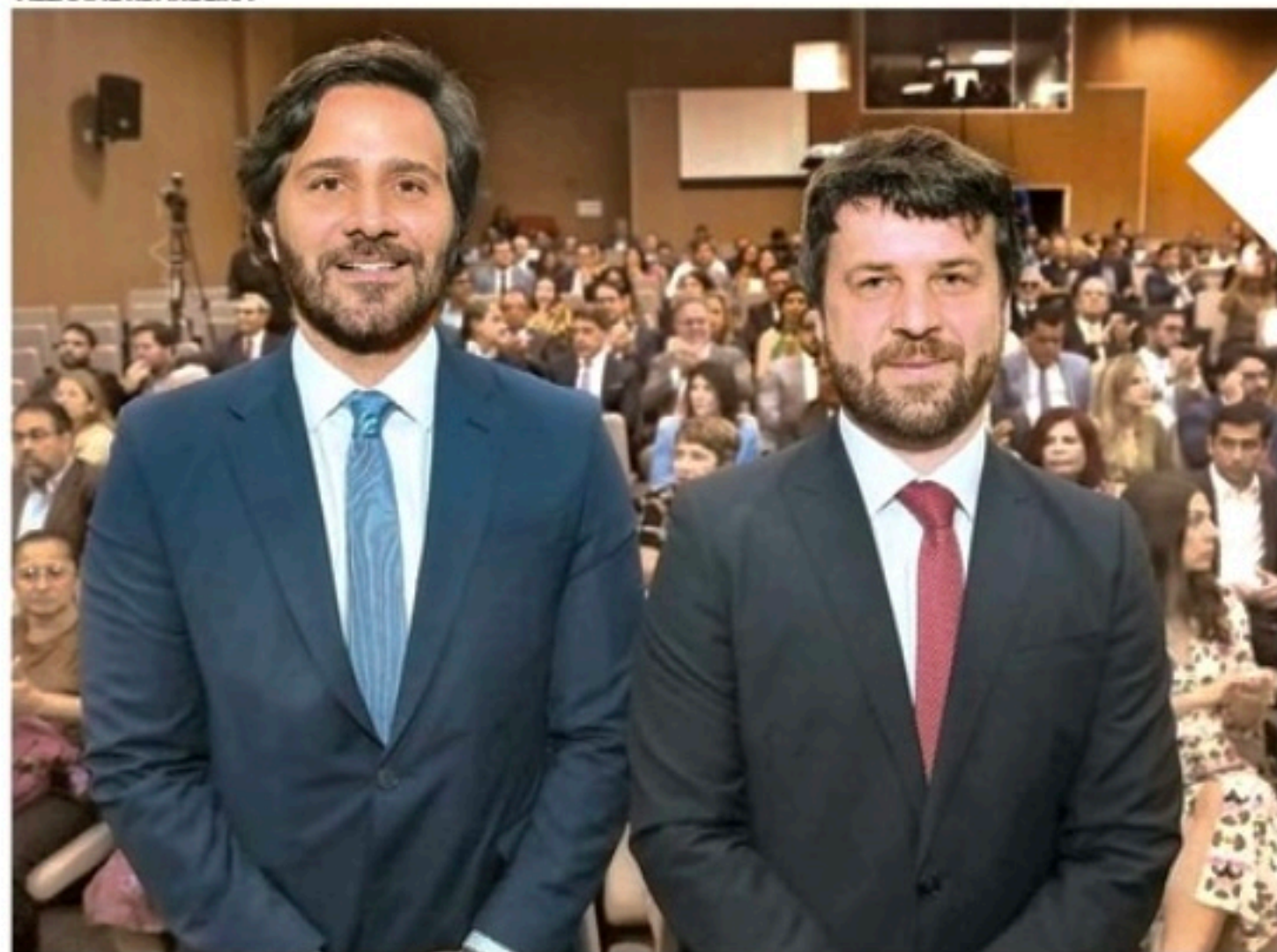
Posse de Novaes e Porto lotou auditório da Escola de Magistratura de Pernambuco