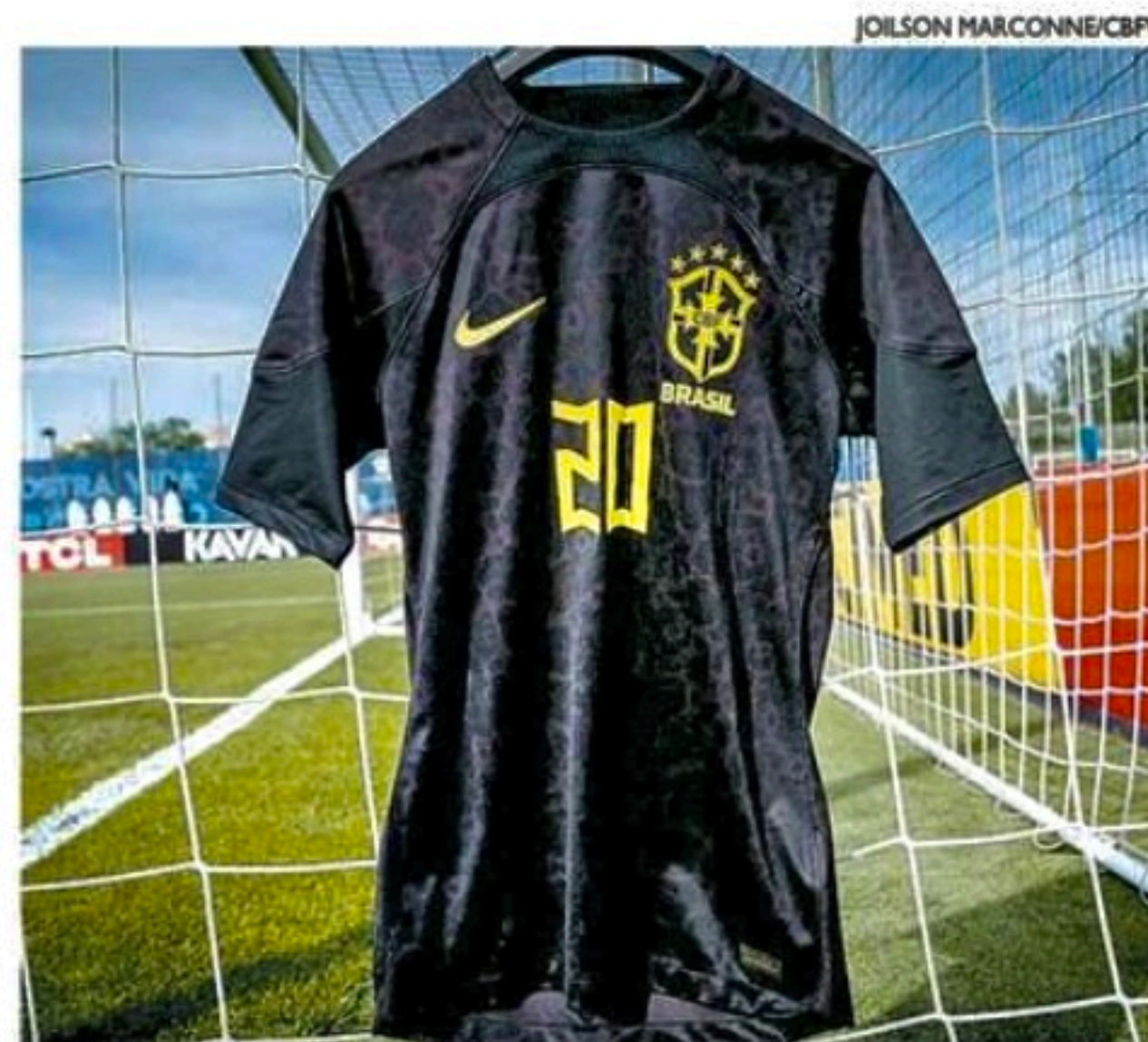
Vestimenta faz parte da ação da CBF no combate ao racismo

Neste sábado, a Seleção atua o primeiro tempo com o uniforme inteiramente preto. Na volta do intervalo, a equipe muda a vestimenta e usará a tradicional combinação de camisas amarelas e shorts azuis.