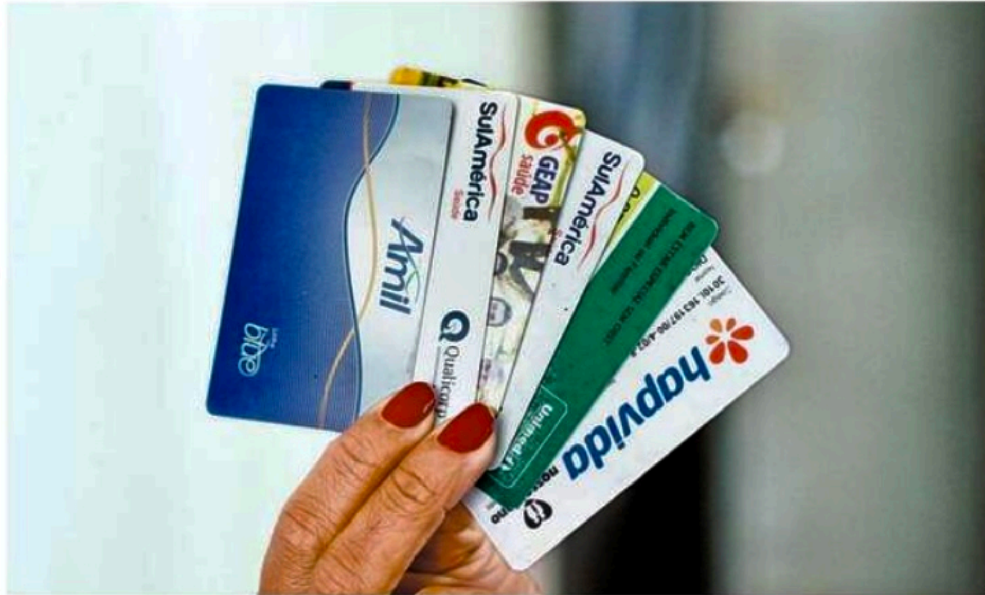
As operadoras dos planos podem aplicar o aumento a partir da data de aniversário dos contratos