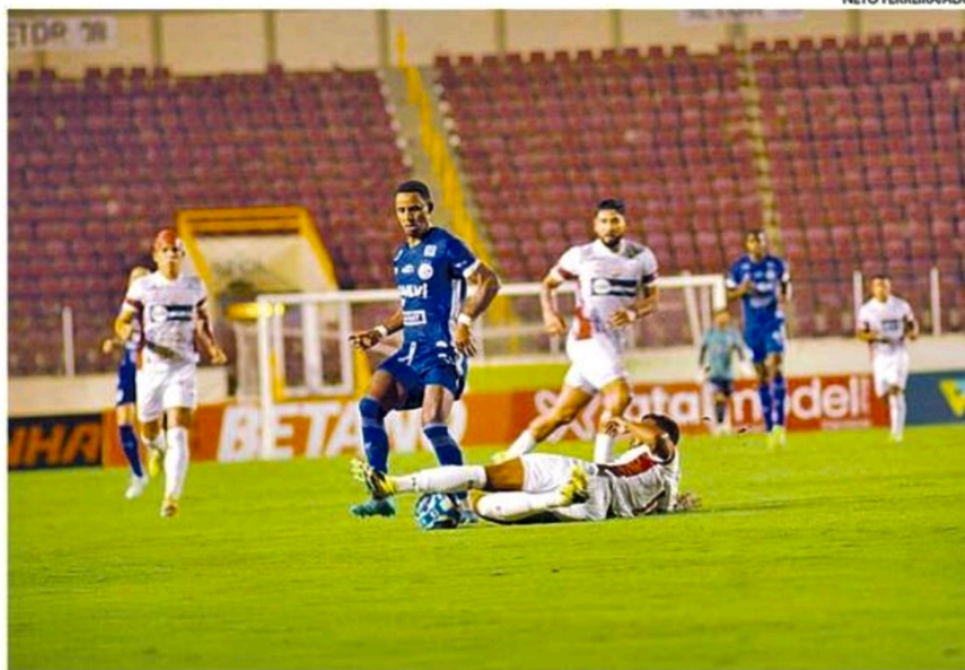
Equipe alvirrubra desperdiçou as chances de terminar a rodada na liderança