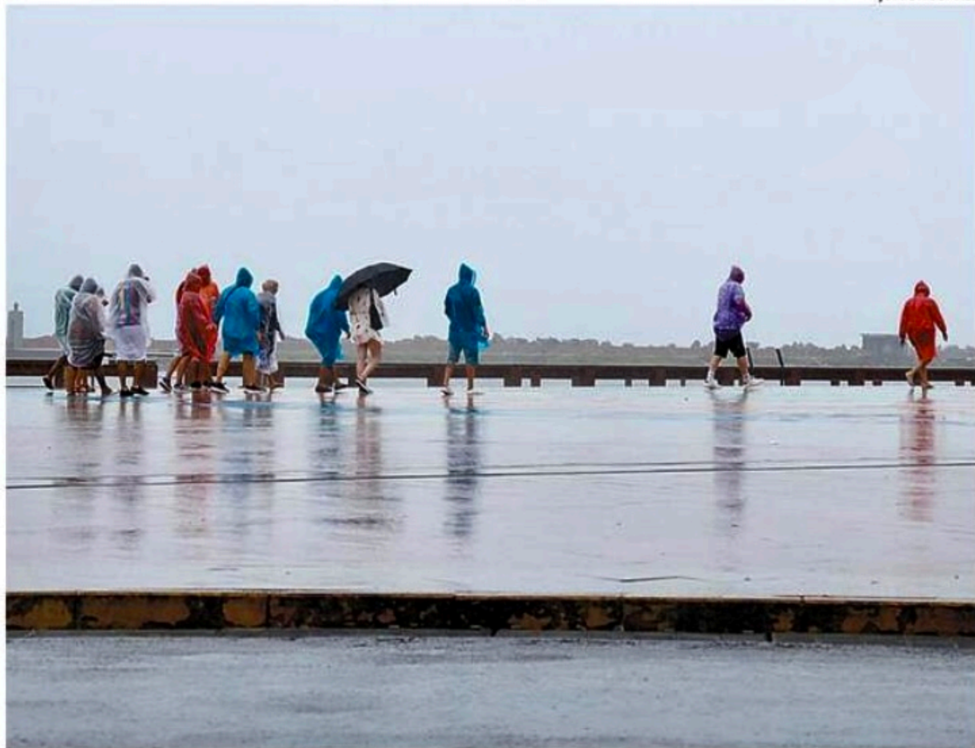
Na RMR, o maior volume de chuva foi no Alto do Mandu e Bairro do Recife, ambos na Capital

■ Segundo a Apac, há também risco de transbordamento nos rios Capibaribe-Mirim e Sirinhaém, que estão em "cota de alerta"