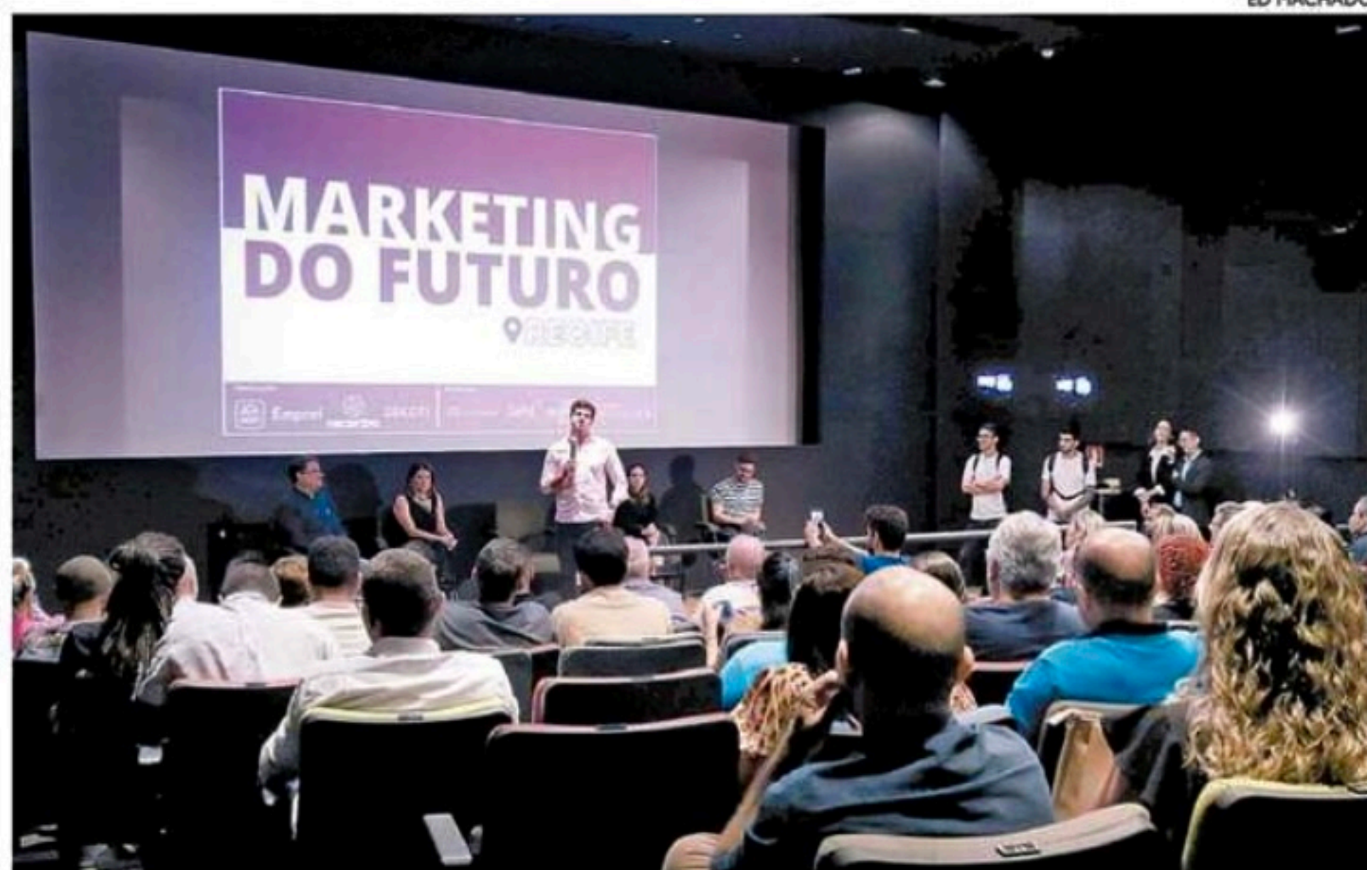
Prefeito João Campos falou sobre a importância do projeto, durante o lançamento no Porto Digital

João Campos acrescentou que, com a capacitação, os lojistas vão adquirir competências de marketing, habilidades que precisam para fortalecer o negócio e a entrada no ambiente digital. “Entendemos que a força hoje se dá no digital, que é o físico com o digital. Não adianta ser 100% físico nem 100% digital. É preciso juntar”, pontuou.