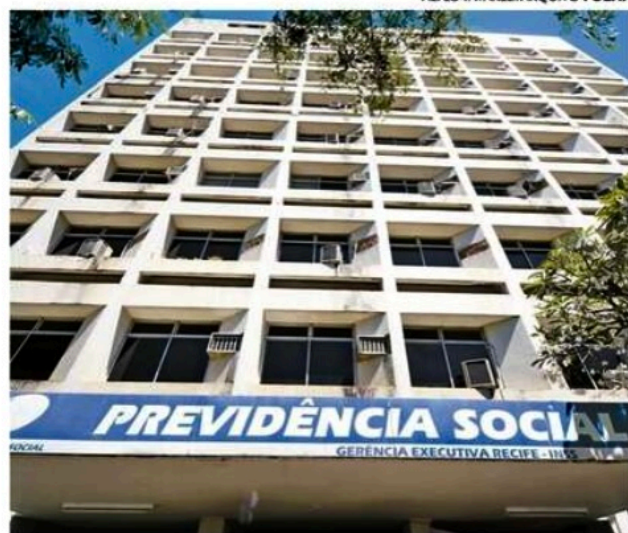
Para o Supremo, cálculo do benefício é constitucional