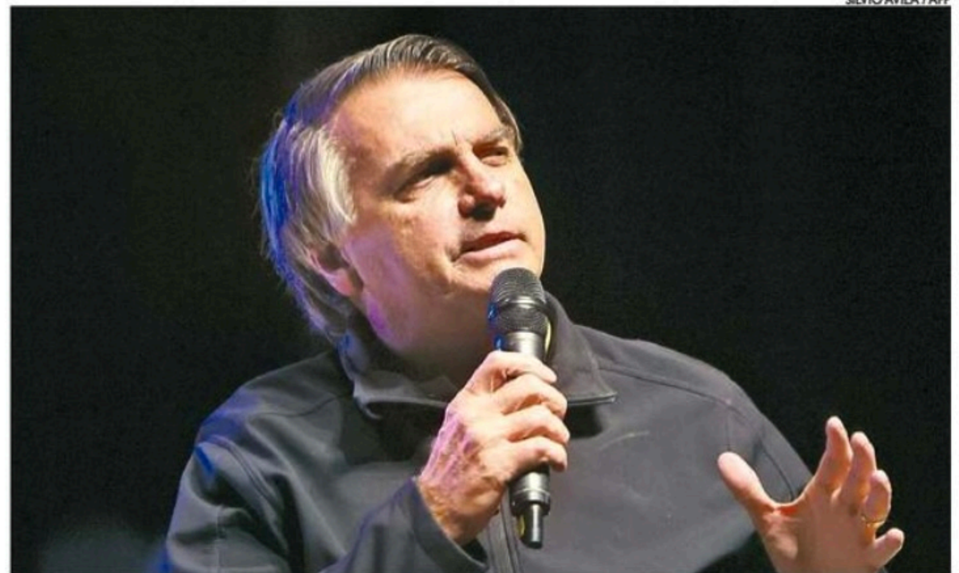
Ex-presidente disse ser "injusto" alegar que ele atacou a democracia ao reunir embaixadores em Brasília

■ Tribunal Superior Eleitoral retoma julgamento que poderá tornar o ex-gestor inelegível pelos próximos oito anos. Sessão começa com voto do relator