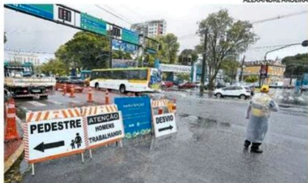
Previsão é que serviços sejam finalizados neste sábado