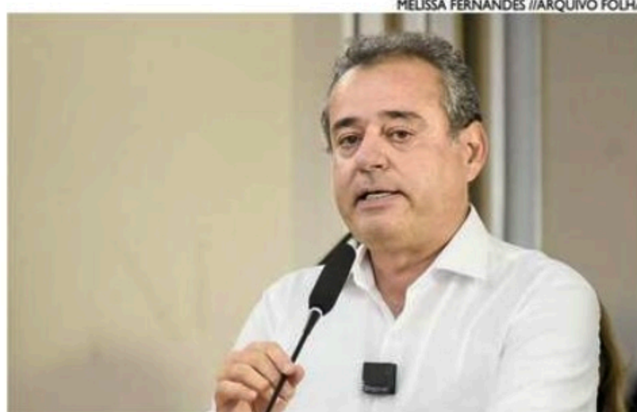
Superintendente diz que objetivo é refletir interesses da população

A Sudene já reuniu contribuições técnicas de instituições do Governo Federal, representantes dos governos dos 11 estados da área da Sudene, além de especialistas no tema. O PRDNE está em sintonia com outras iniciativas do Governo Federal