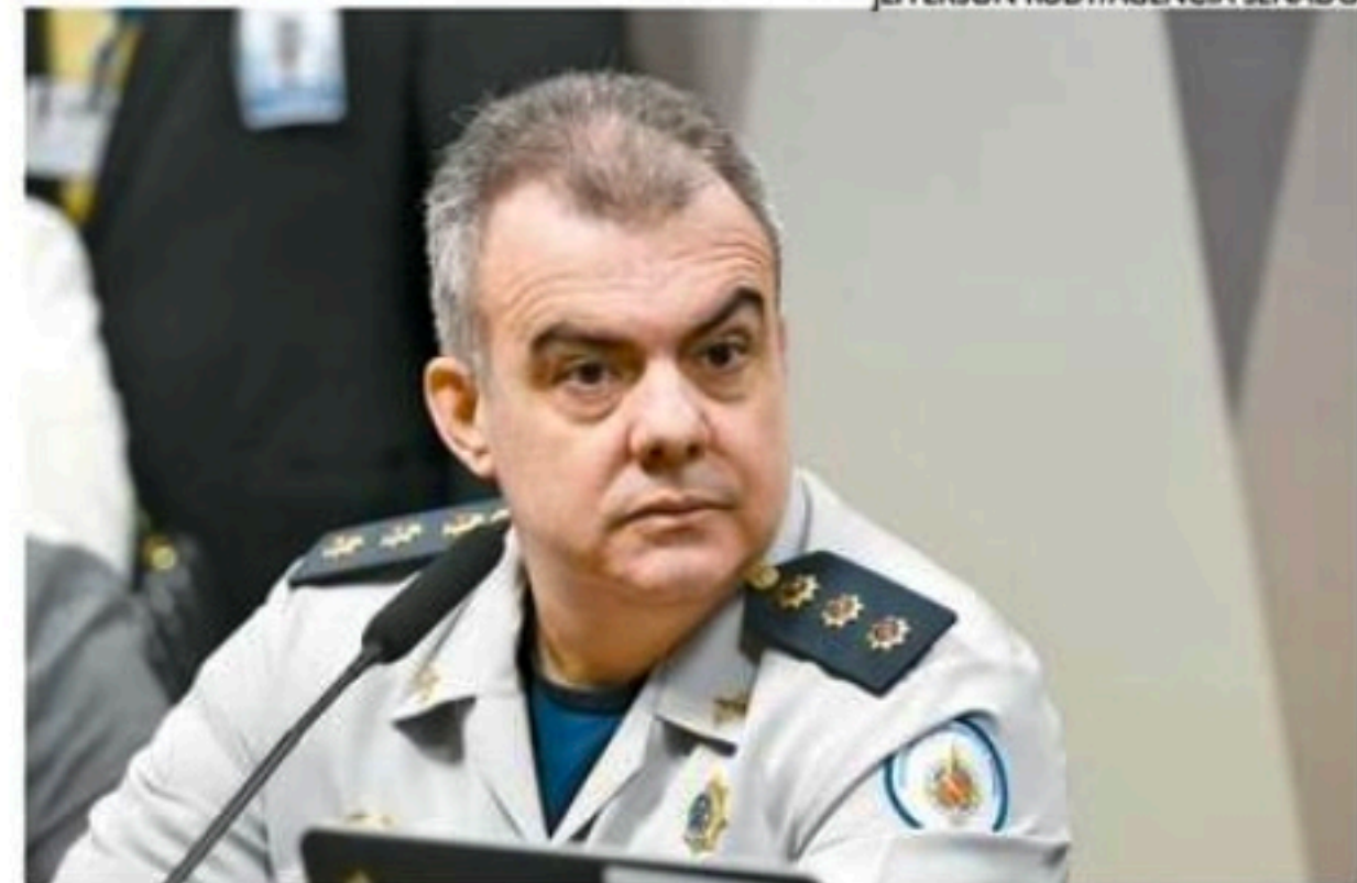
Naime apresentou atestado médico para não depor, mas recuou