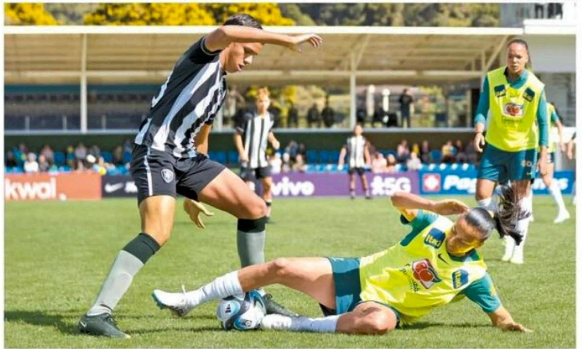
Durante uma semana, treinadora observou, na Granja Comary, as atletas que devem representar o Brasil

Mundo. No ciclo de quatro anos, a sueca convocou 92 atletas, e liderou a Canarinho em 53 jogos, somando 32 vitórias, 12 empates, nove derrotas, além de 120 gols marcados e 40 sofridos. Vale citar que, além das convocadas, também serão chamadas três suplentes que integrarão a delegação e poderão ser utilizadas em caso de algum corte de alguma jogadora. Antes da convocação, Pia comandou a seleção em um período de treinamentos na Granja Comary,