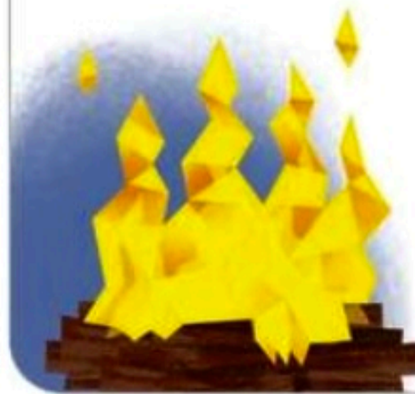
ARTE: FOLHA PE