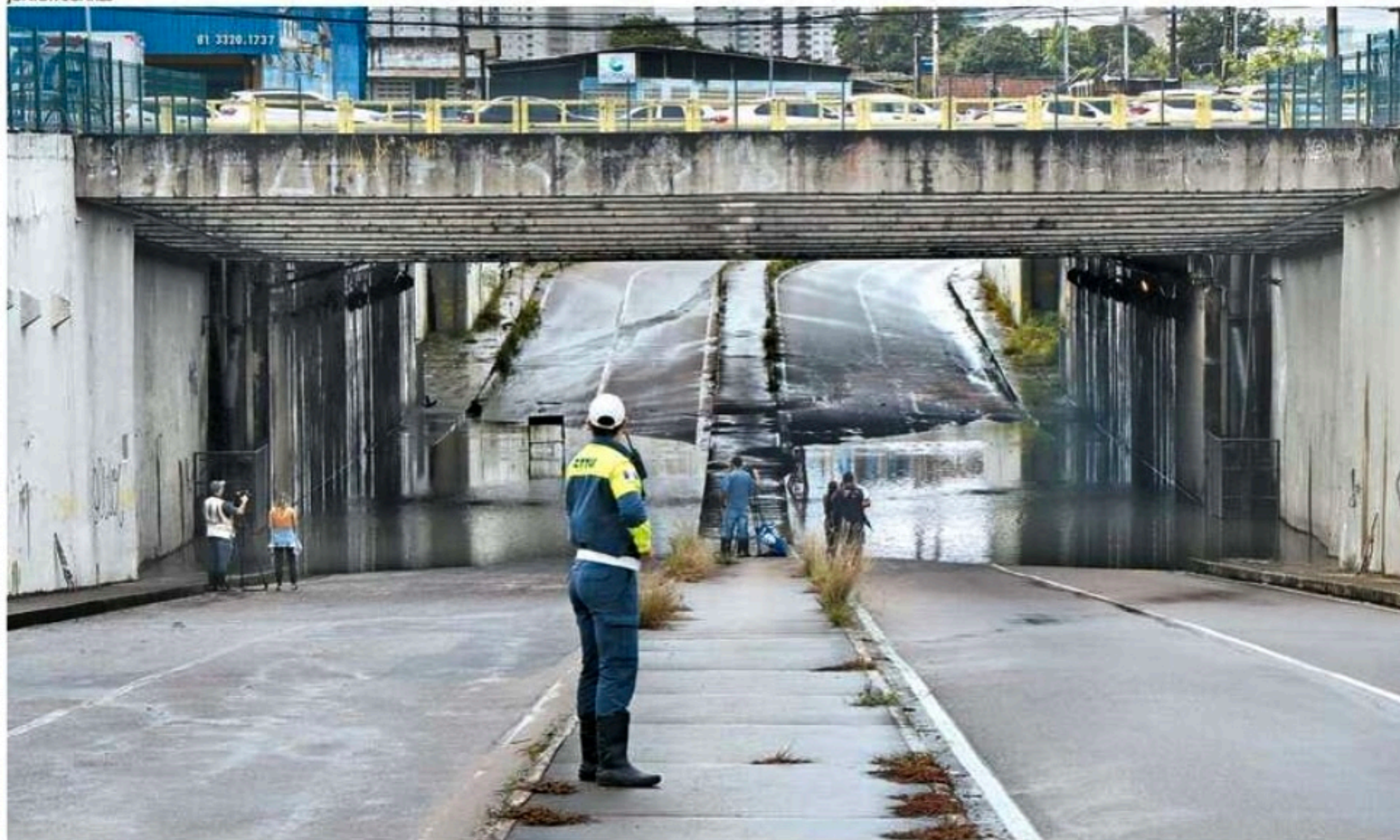
O túnel Felipe Camarão, que voltou a registrar uma morte, foi interditado em razão do alagamento

Mais um dia de muita chuva, alagamentos e tristeza na Região Metropolitana do Recife. No túnel Felipe Camarão, no Jordão, que inundou, um ciclista de 41 anos foi encontrado morto. Há suspeita de que ele tenha sofrido uma descarga elétrica. Em Muribeca, Jaboatão dos Guararapes, uma pedra gigante deslizou junto a uma casa, que foi interditada. Confira os detalhes.