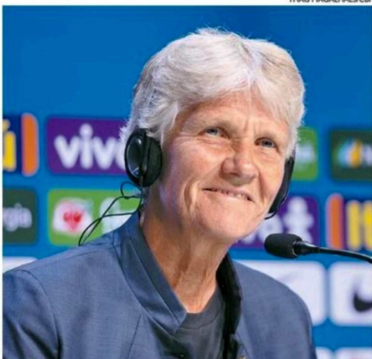
Treinadora da seleção feminina convocou 23 atletas e três suplentes