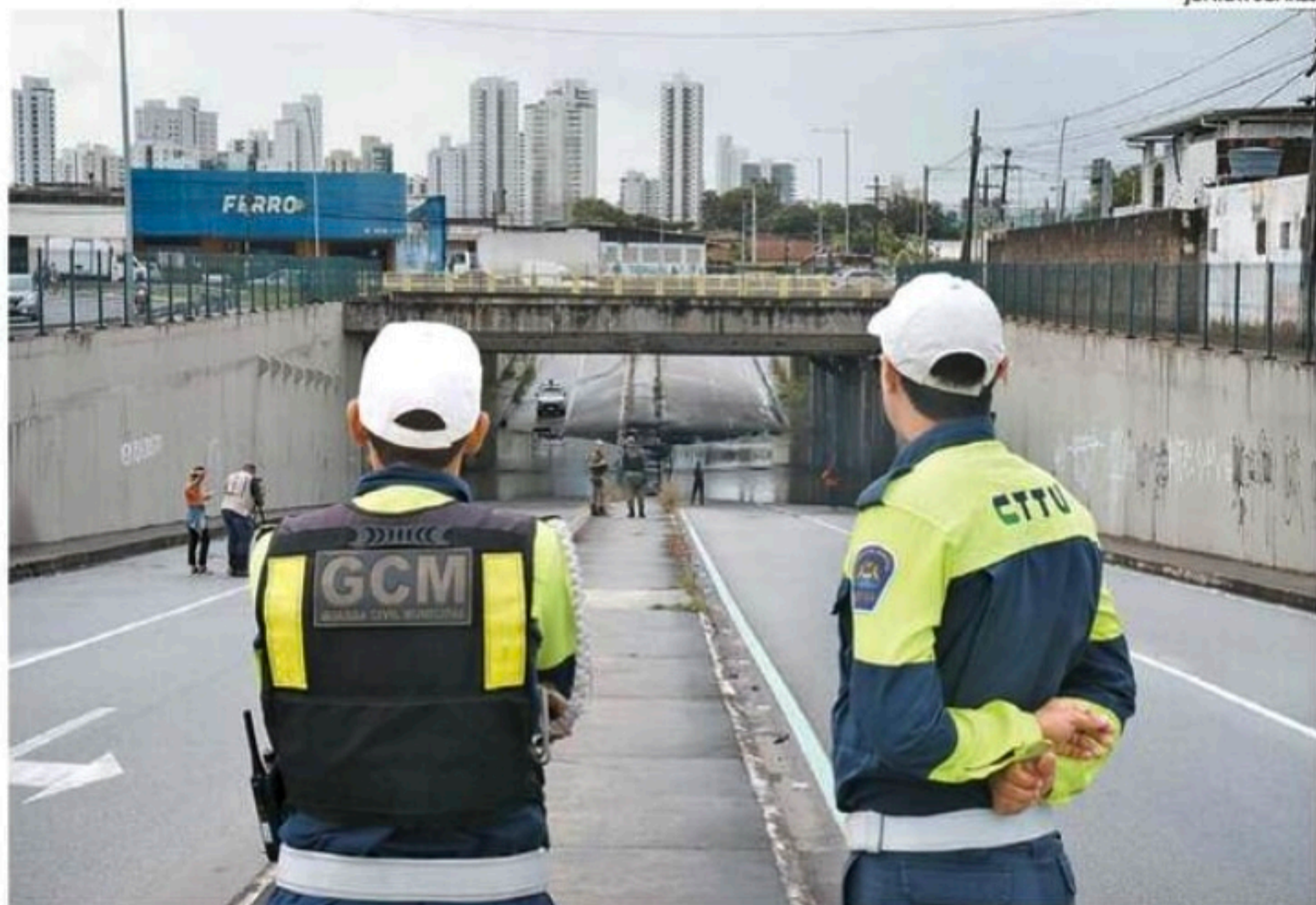
Túnel Felipe Camarão - no Jordão (Recife) - foi interditado. É a segunda morte em menos de um ano

■ O dia foi marcado pela morte de um ciclista no Túnel Felipe Camarão, que estava alagado, e transbordamento de rios em vários municípios