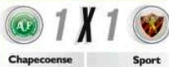
Rubro-negro deixou vitória escapar aos 90 minutos e perdeu chance de reassumir a liderança da Série B