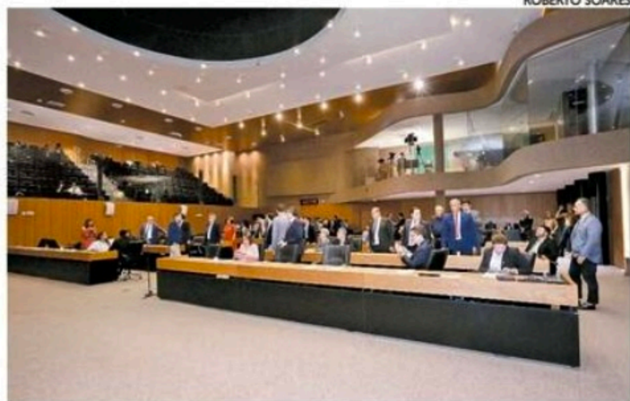
Plenário da Alepe ficou lotado para a votação do projeto do Governo

“Todos os 30 defendem, sem exceção, que o Governo mande o reajuste para o restante da categoria. E a governadora se comprometeu, assim que tiver um retrato preciso do equilíbrio fiscal e fi-