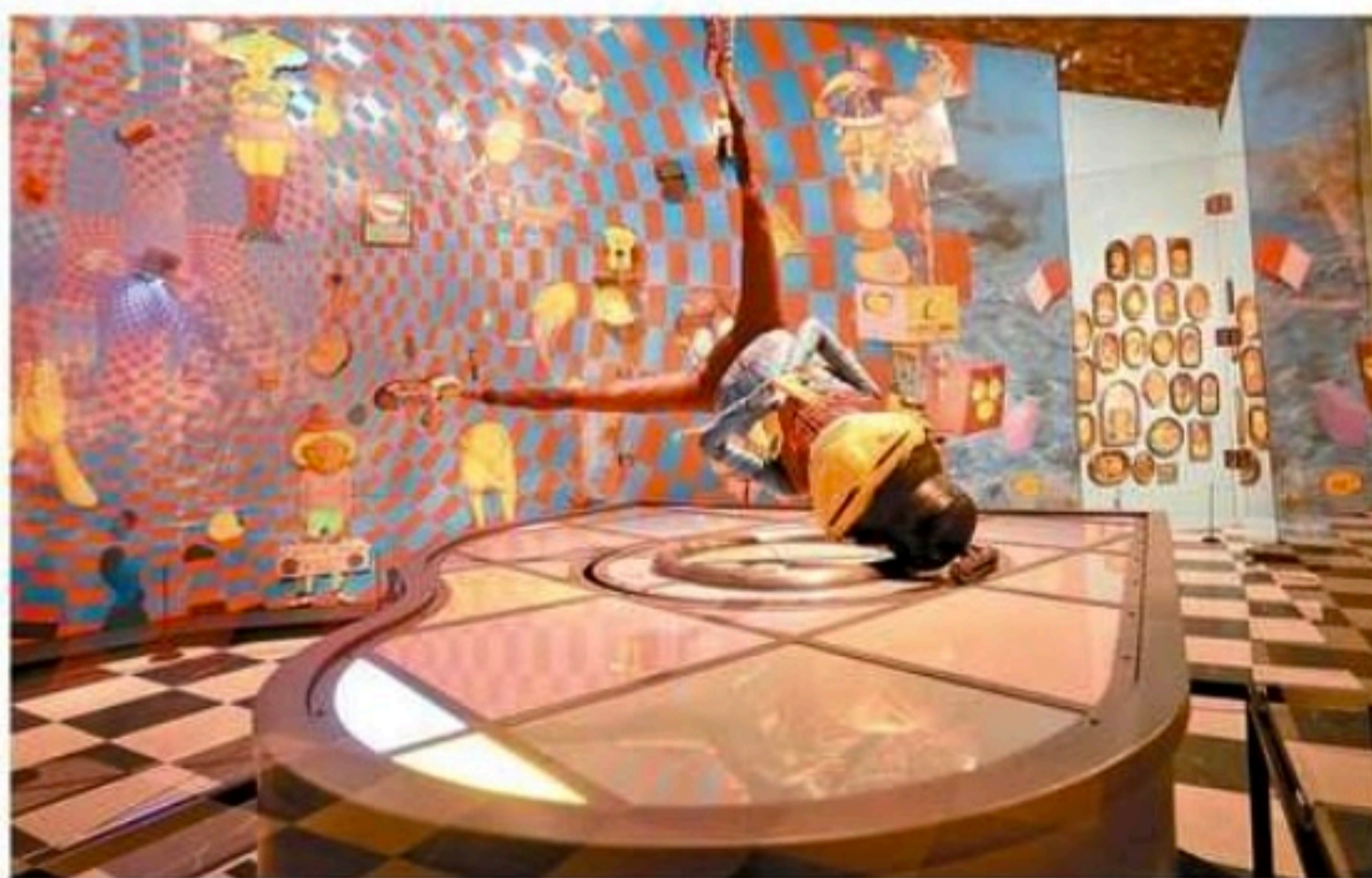
Para além dos grafites: mostra “Nossos Segredos” reúne telas, fotos e objetos