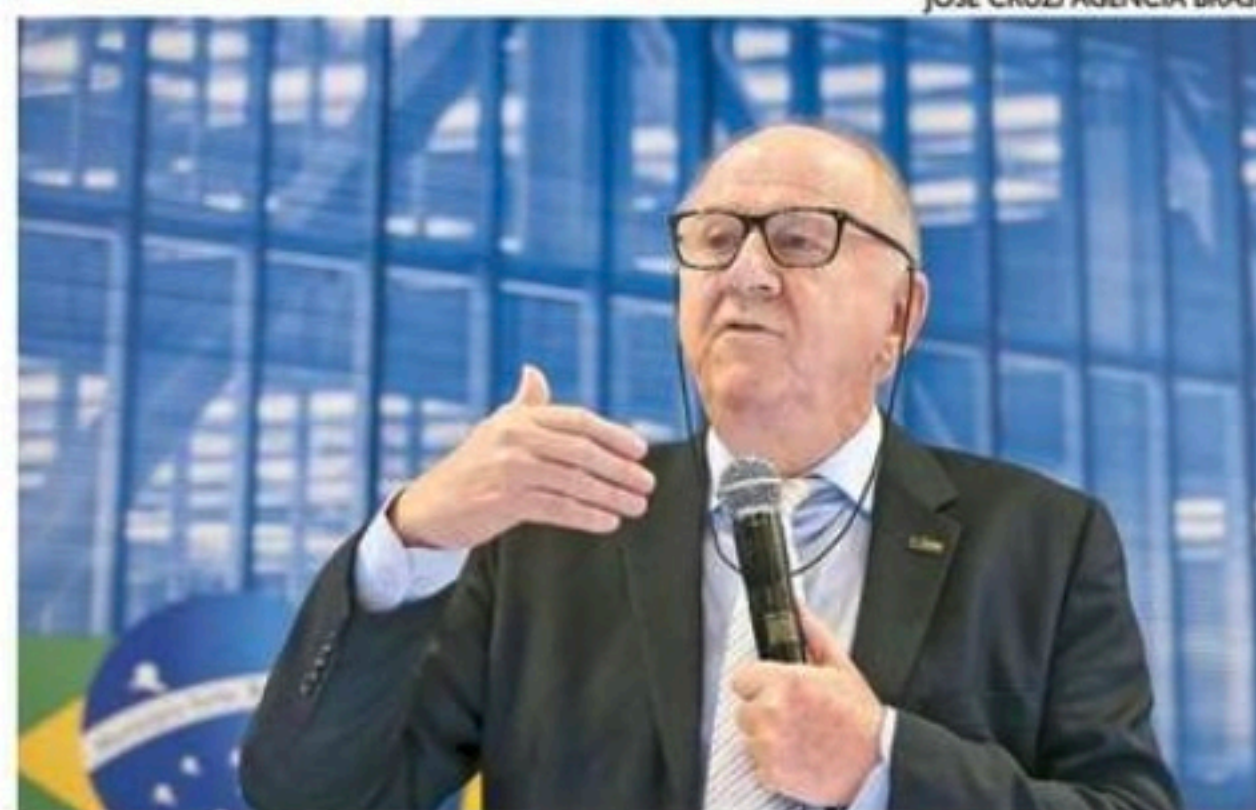
"Problema impacta ao menos 112 milhões de brasileiros", diz Ziulkoski

A pesquisa da Confederação questionou sobre as principais dificuldades para contratar médicos para a Atenção Primária à Saúde, na visão da gestão municipal. Em primeiro lugar está a exigência do cumprimento da carga horária semanal de 40h (47,5%), seguida pelo salário oferecido (39,1%) e falta de recursos financeiros para a contratação (33,9%). Para buscar solução, a medida adotada pela