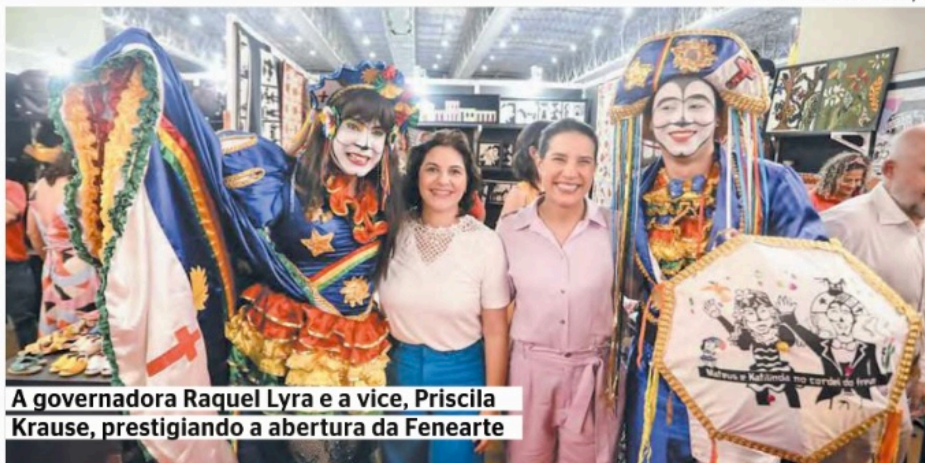
A governadora Raquel Lyra e a vice, Priscila Krause, prestigiando a abertura da Fenearte

Dos 16 gerentes regionais de educação nomeados pela governadora Raquel Lyra, 11 (68%) são mulheres e apenas cinco homens (31%).