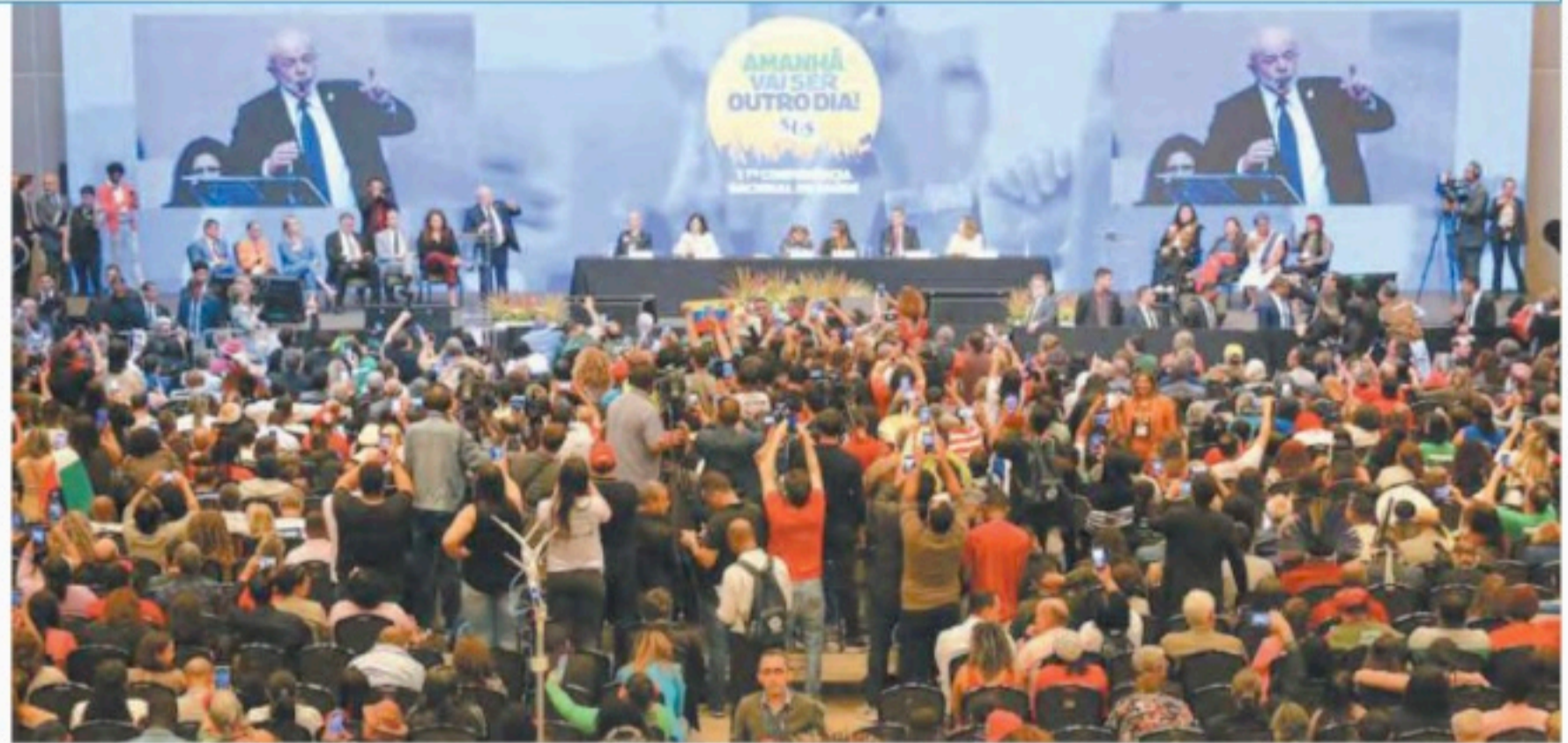
O anúncio foi feito pelo presidente Lula durante a 17ª Conferência Nacional de Saúde

de acontece a cada quatro anos, desde 1986, para definição e construção conjunta de políticas públicas do SUS. Gestores, fóruns regionais, organizações da sociedade civil, movimentos sociais e outros atores se reúnem durante o evento, organizado pelo Conselho Nacional de Saúde e pelo ministério. A edição deste ano tem o lema Garantir Direitos e Defender o SUS, a Vida e a Democracia – Amanhã vai ser outro dia. (Agência Brasil)