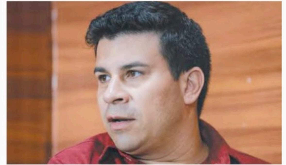
Veras defendeu a reconquista da indústria no estado

ALINY AGOSTINHO politica@diariodepernambuco.com.br