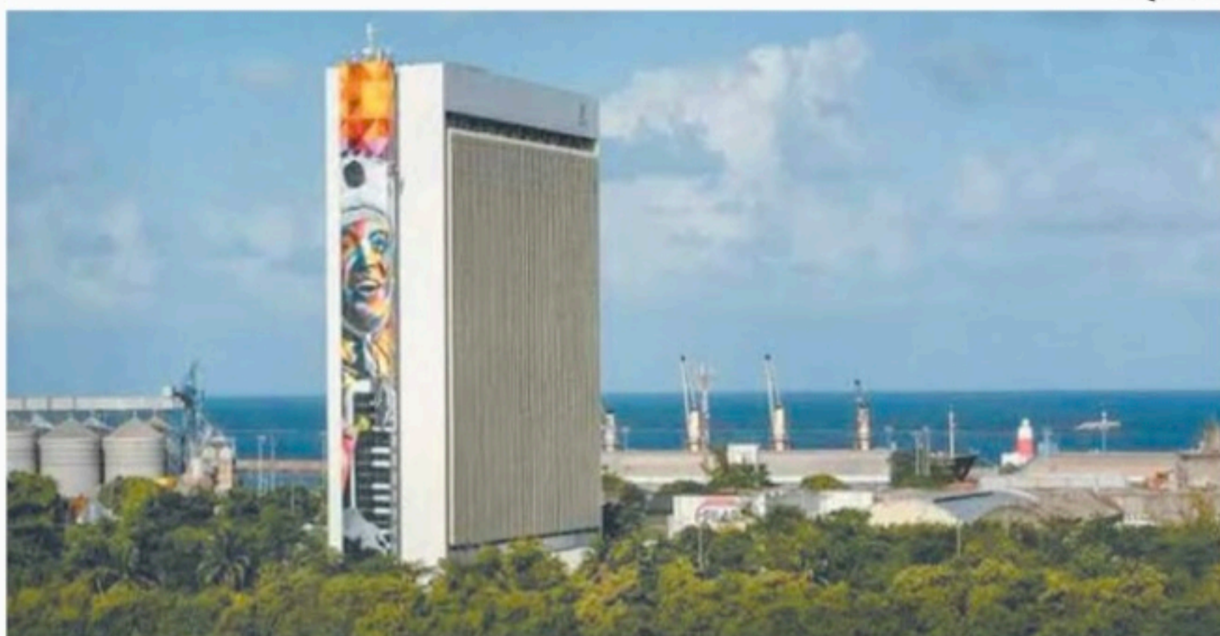
Recife tem 60,11 metros quadrados de área verde por habitante, diz a Prefeitura

A Prefeitura do Recife realizou duas reuniões presenciais com moradores da vizinhança onde está instalado o Jardim do Poço, nos dias 21 e 22 de junho, a fim de escutar as demandas, sugestões e necessidades, bem como entender o que chama de "vocalização do terreno". Agora, uma con-