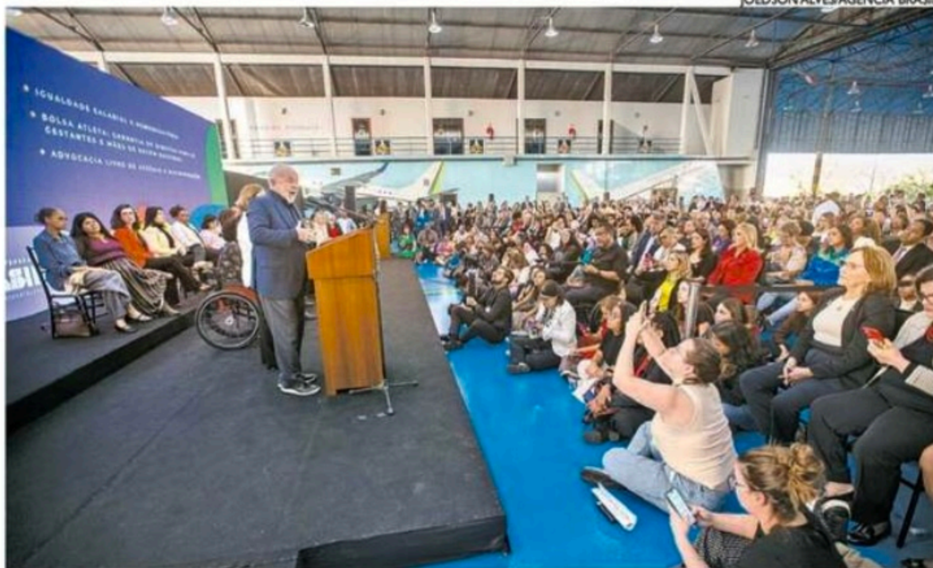
Durante a sanção da nova legislação, Lula disse que uma série de entidades vão atuar na fiscalização

A coluna de Carlos Britto é publicada de segunda a sexta.