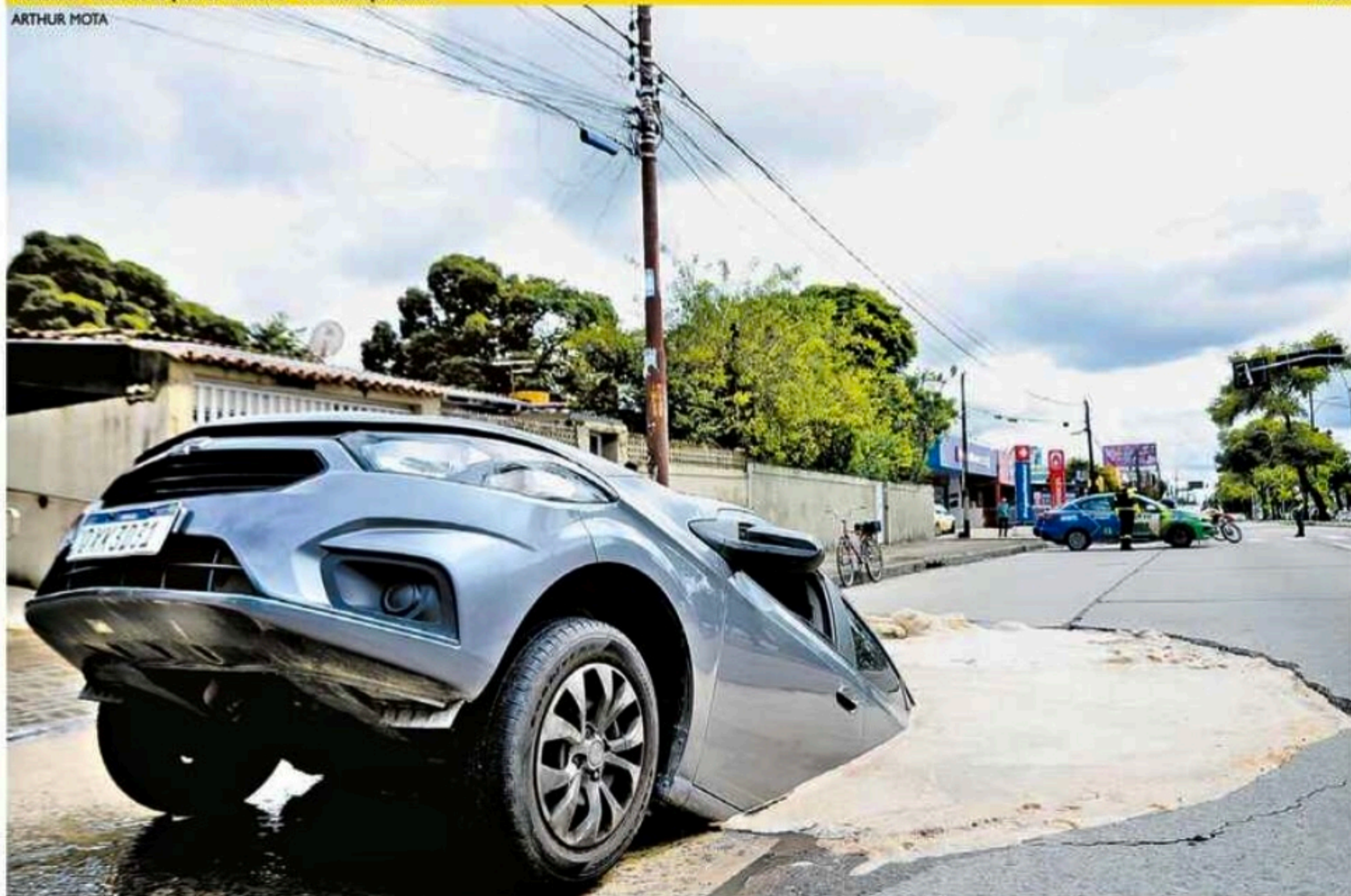
Motorista de aplicativo e passageira estavam no veículo quando o asfalto cedeu, na Avenida Recife. Eles saíram pela janela e não se feriram