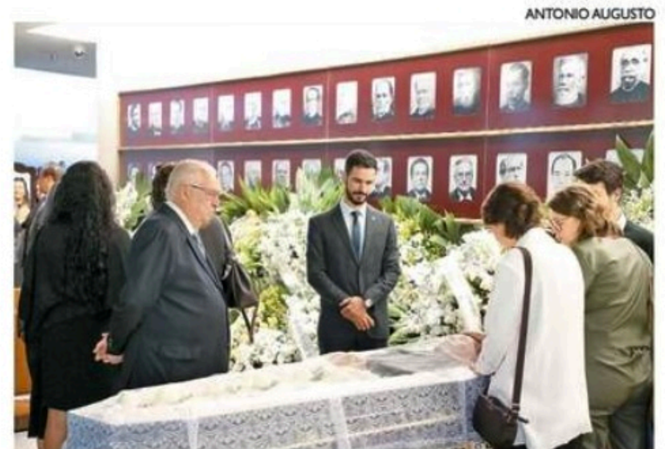
Autoridades, amigos e familiares se despediram do ex-ministro do STF

Em 1985, foi indicado para o cargo de procurador-geral da República. Em seguida, em 1989, após ser nomeado pelo então presidente da República José Sarney, assumiu a cadeira de ministro do Supremo Tribunal Federal (STF),