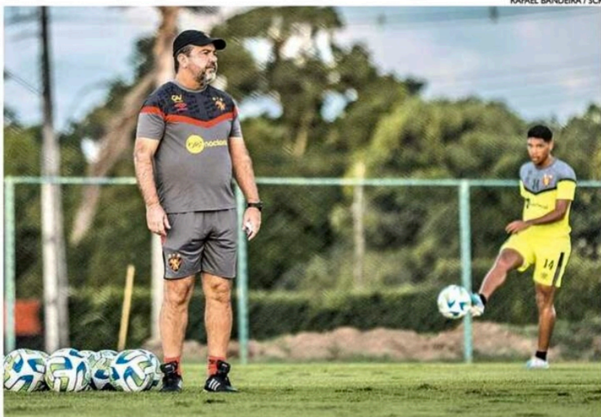
Técnico terá que quebrar a cabeça para montar time, desfalcado de peças importantes