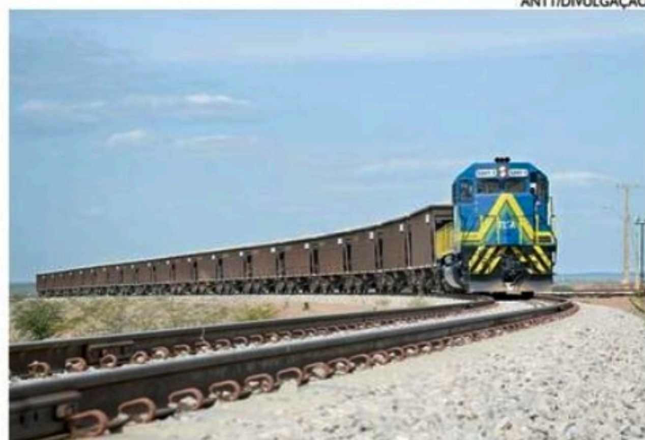
Trecho da benfeitoria em Pernambuco está parado há mais de 10 anos

Na prática, a medida impede que Cid leve adiante uma tentativa de, com apoio dos dirigentes partidários no Ceará, assumir o comando estadual da sigla. O senador havia convocado uma reu-