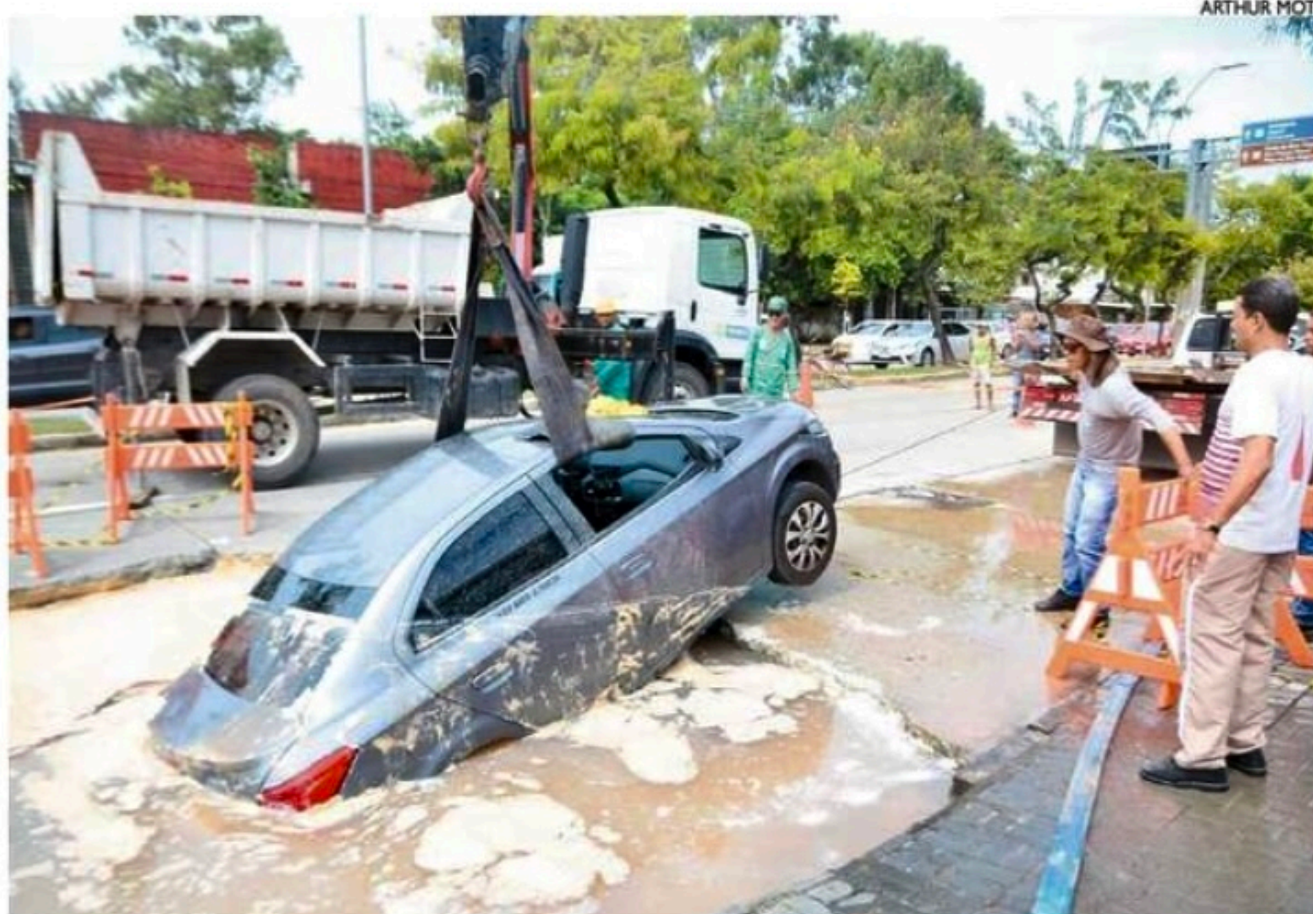
Motorista e passageira estavam dentro do veículo no momento do acidente, mas não se feriram