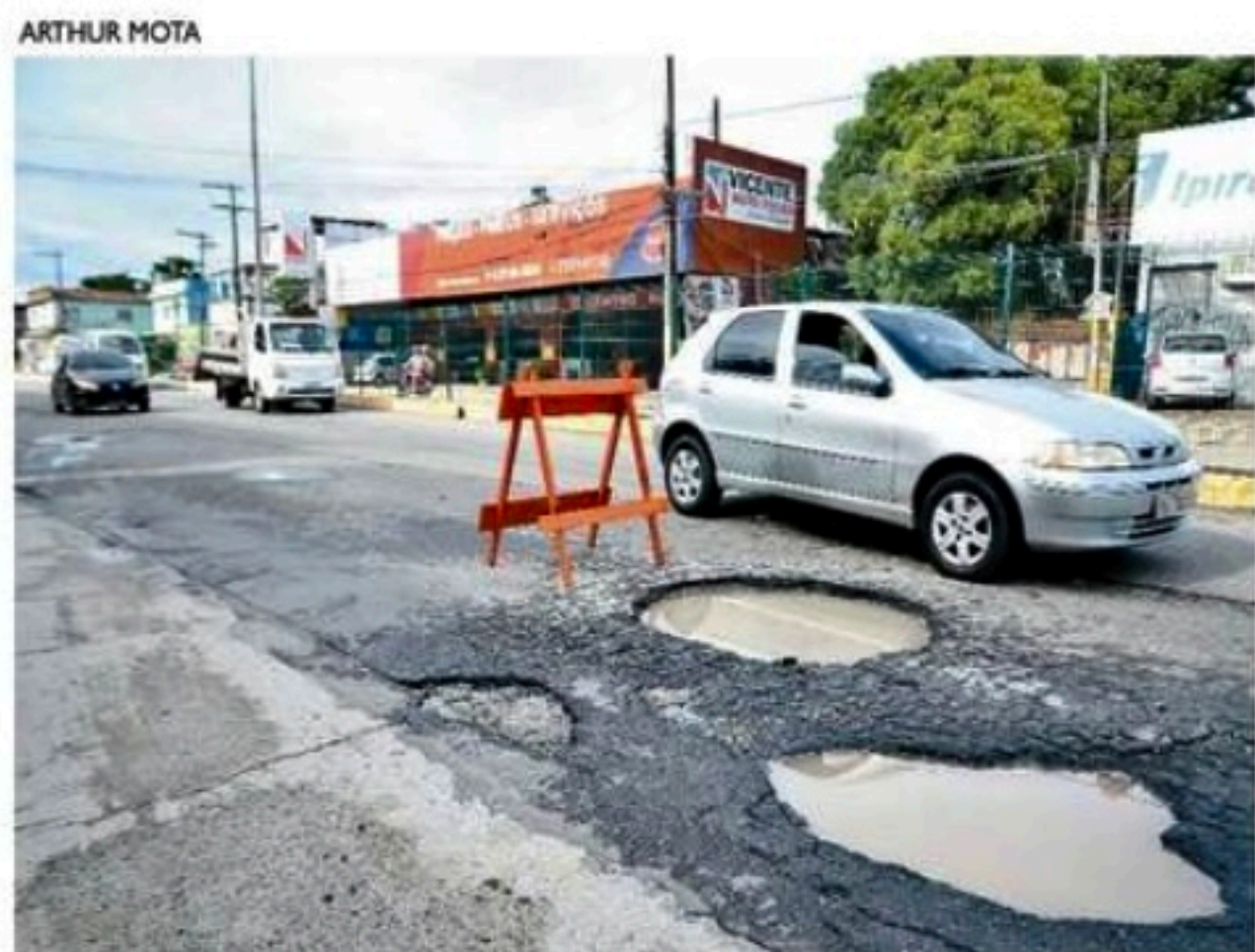
Moradores relatam que muitos acidentes já ocorrem no trecho

A Prefeitura de Olinda informou que equipes da Secretaria Executiva de Serviços Público realizarão uma vistoria para verificar a situação do local e inserir no cronograma de atividades uma ação de tapa-buraco. Procurada pela Folha de Pernambuco, a Prefeitura de Olinda não informou, até a última atualização dessa matéria, a previsão de chegada das equipes e o horário de início da avaliação.