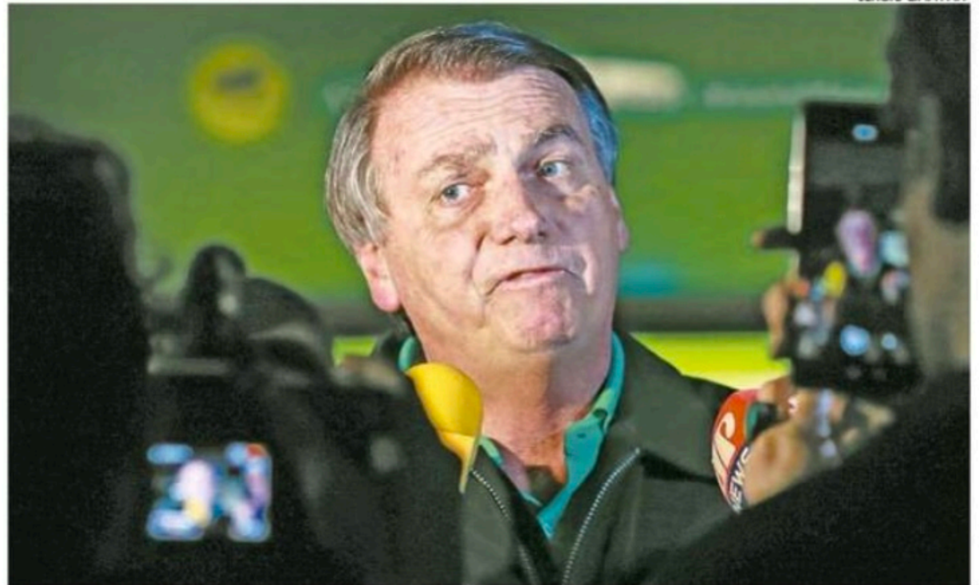
Após ter se tornado inelegível, ex-chefe do Executivo disse que "não é justo alguém querer dividir" seu espólio

Segundo a representação, "é possível verificar que se está diante do uso da máquina pública com desvio de finalidade, tanto pelo fato de ter havido a difusão de informações inverídicas quanto ao sistema eleitoral brasileiro, quanto pelo fato de o então Presidente ter buscado se beneficiar pessoalmente do alcan-