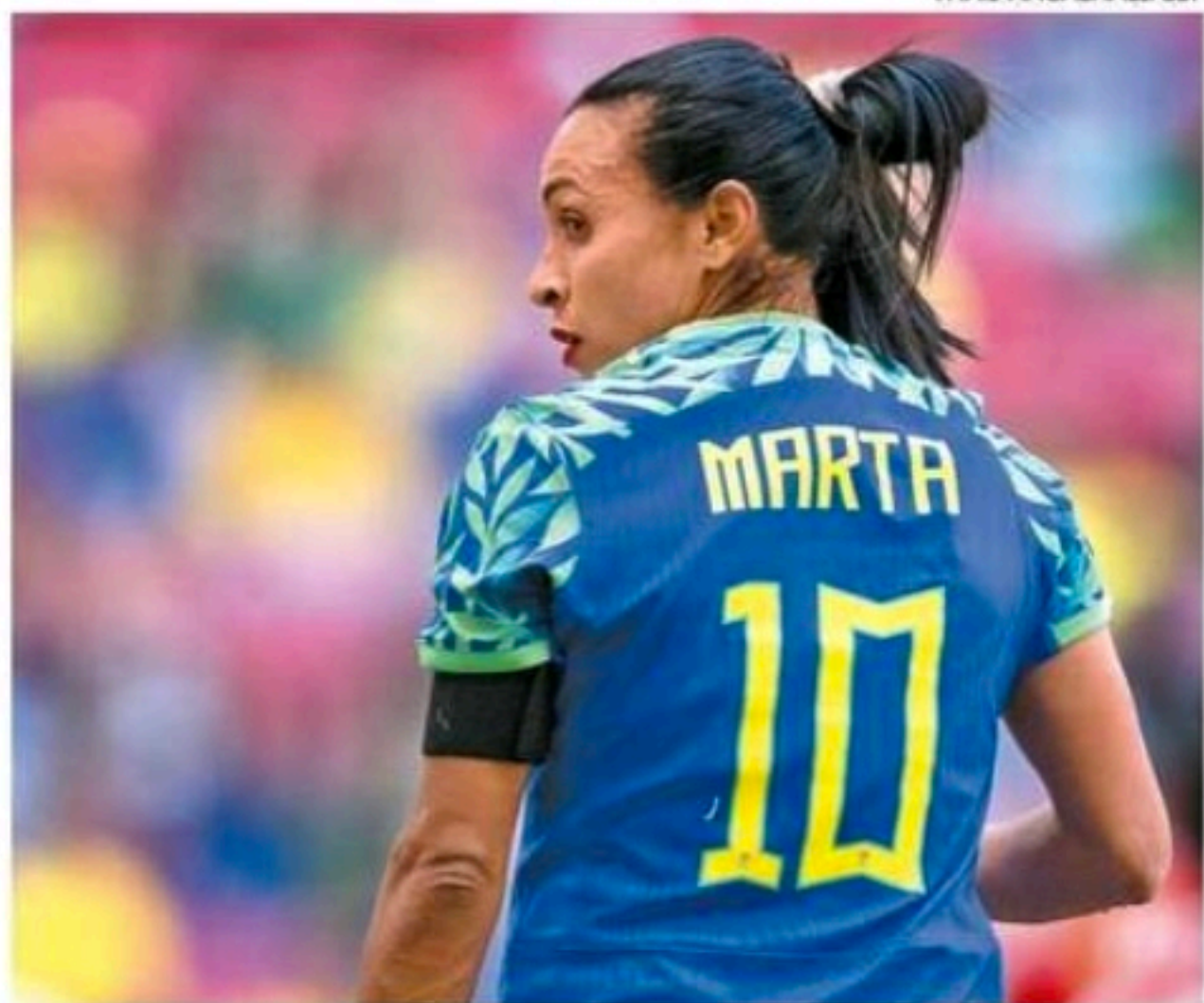
Aos 37 anos, Marta vai disputar sua sexta Copa do Mundo em nova condição

O time brasileiro estreia no Grupo F contra o Panamá, no dia 24 de julho.