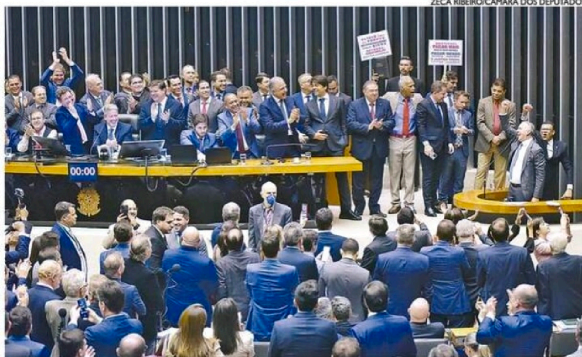
Por 382 votos a favor e 118 contra, proposta foi aprovada após articulação de diversas frentes políticas

A coluna de Carlos Britto é publicada de segunda a sexta.