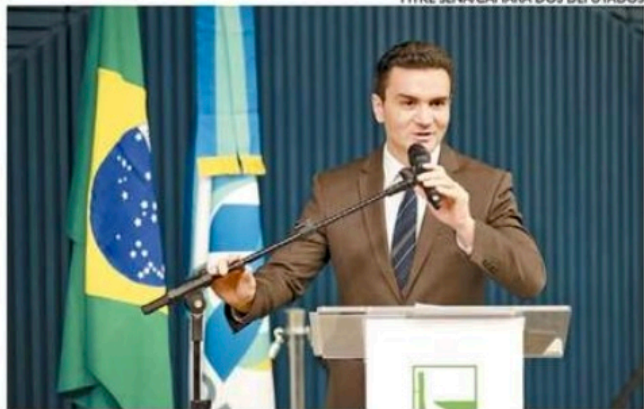
Nome do novo ministro foi divulgado em meio a desencontros

À tarde, Pimenta deu outra versão e disse que a ministra já tinha “o conhecimento” de que outro nome será indicado para sua função. “Não tem carta. Mas a minis-