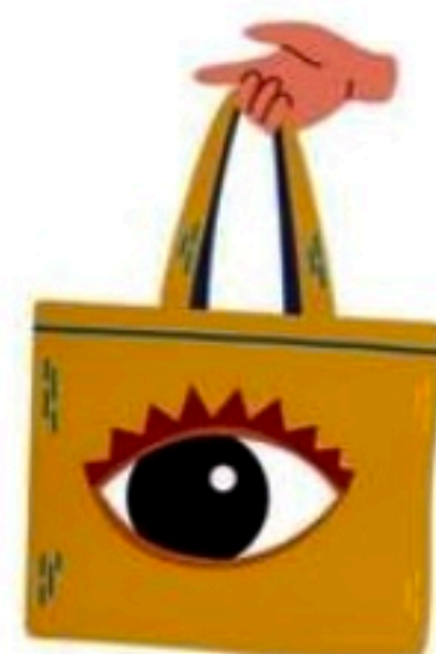
ARTE: FOLHA PE

chegam em até a 40% de desconto. Enquanto na Hering, eles separaram uma arara exclusiva com 50% de desconto em todos os produtos.