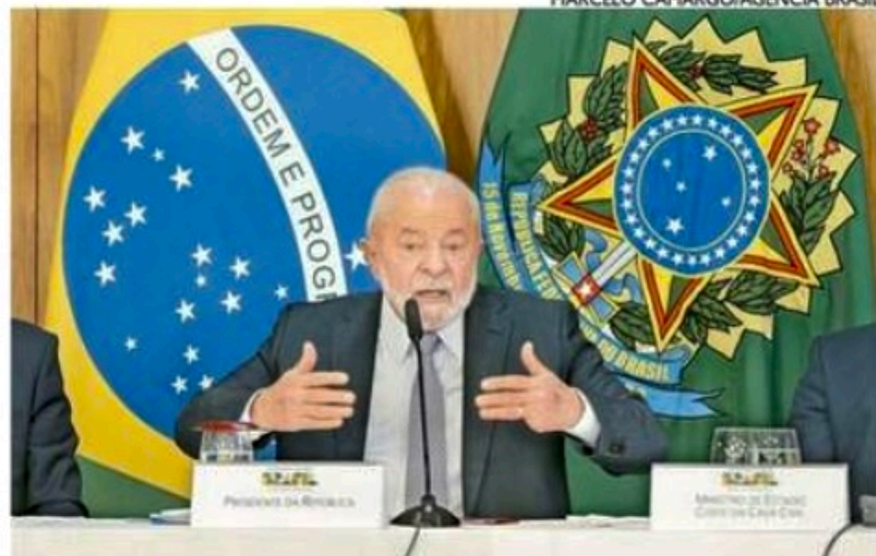
Desde o início do mandato, Lula contabiliza 15 voos para o exterior