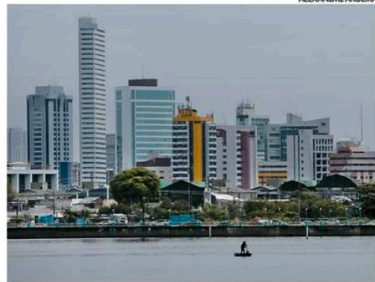
Apac e Inmet emitiram alerta laranja de chuvas para Pernambuco

Há risco de alagamentos, deslizamentos de encostas, transbordamentos de rios, em cidades com tais áreas de risco, segundo o Inmet. De acordo com a Apac, as chuvas devem ser de moderadas a fortes hoje e amanhã na RMR e Matas Norte e Sul; e moderadas no Agreste.