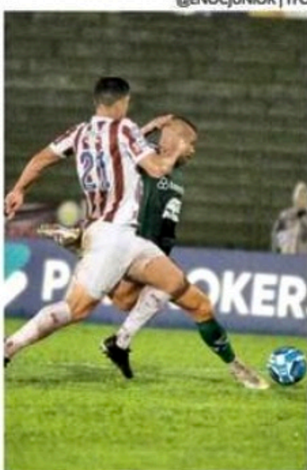
Náutico chegou ao quarto jogo seguido sem perder como visitante