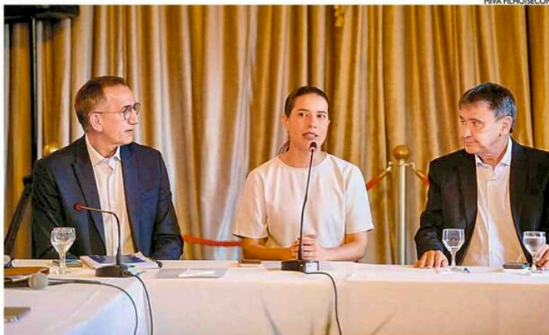
Governadora Raquel Lyra recebeu os ministros Waldez Góes e Wellington Dias para discutir medidas

As ações dividem o foco na distribuição de água potável e produtos de higiene e necessidade básica, além da intenção de repaginar espaços destruídos pelo grande volume de água. São esperadas cestas básicas, botijões de água mineral, colchões e lençóis, o reforço dos estoques municipais de vacinas e medicamentos, a distribuição de hipoclorito de sódio e pastilhas de cloro para caixas d'água, o suporte à limpeza de casas, equipamentos públicos e