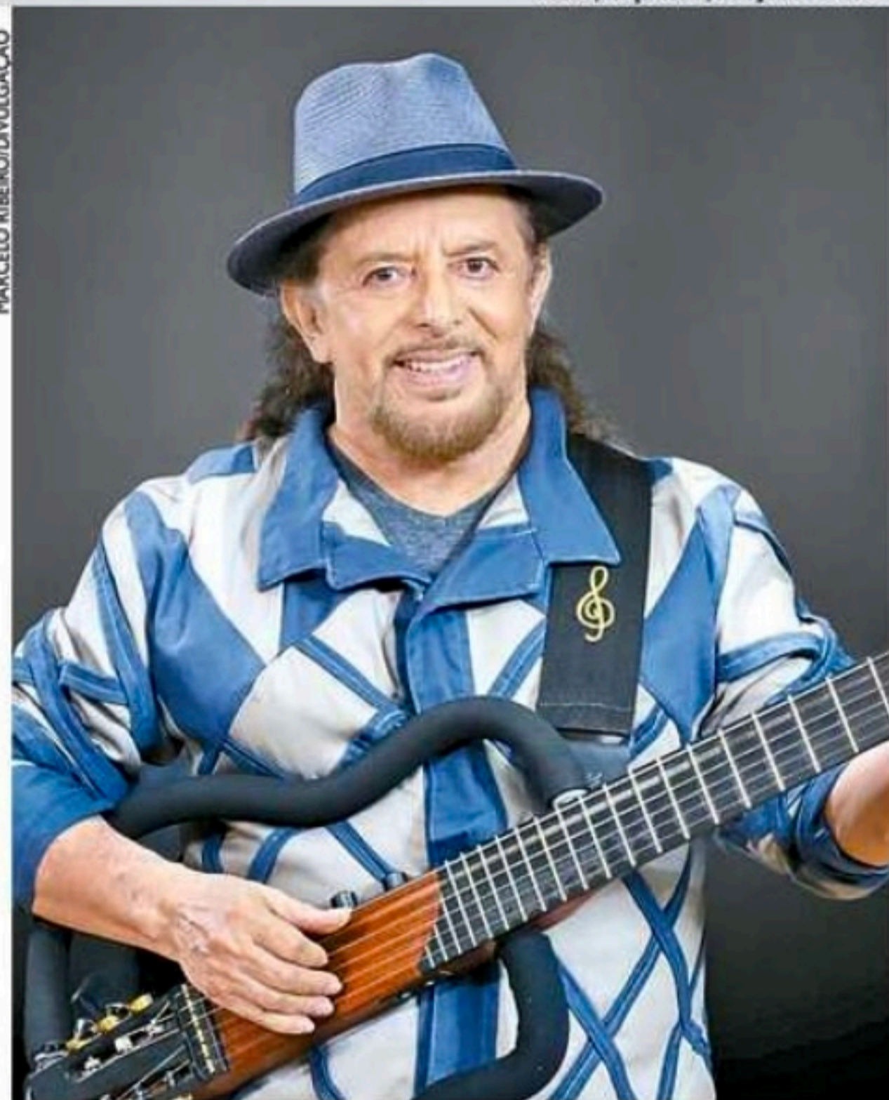
O pernambucano Geraldo Azevedo é uma das atrações do palco principal