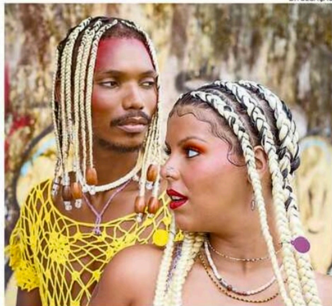
Os recifenses do Barbarize sobem ao Dominginhos no dia 28 de julho