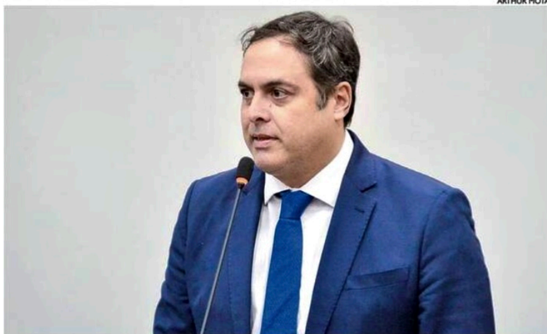
Câmara ressaltou o papel da Sudene no planejamento do Nordeste e do banco como braço operacional

A coluna de Betânia Santana é publicada de terça a sábado.