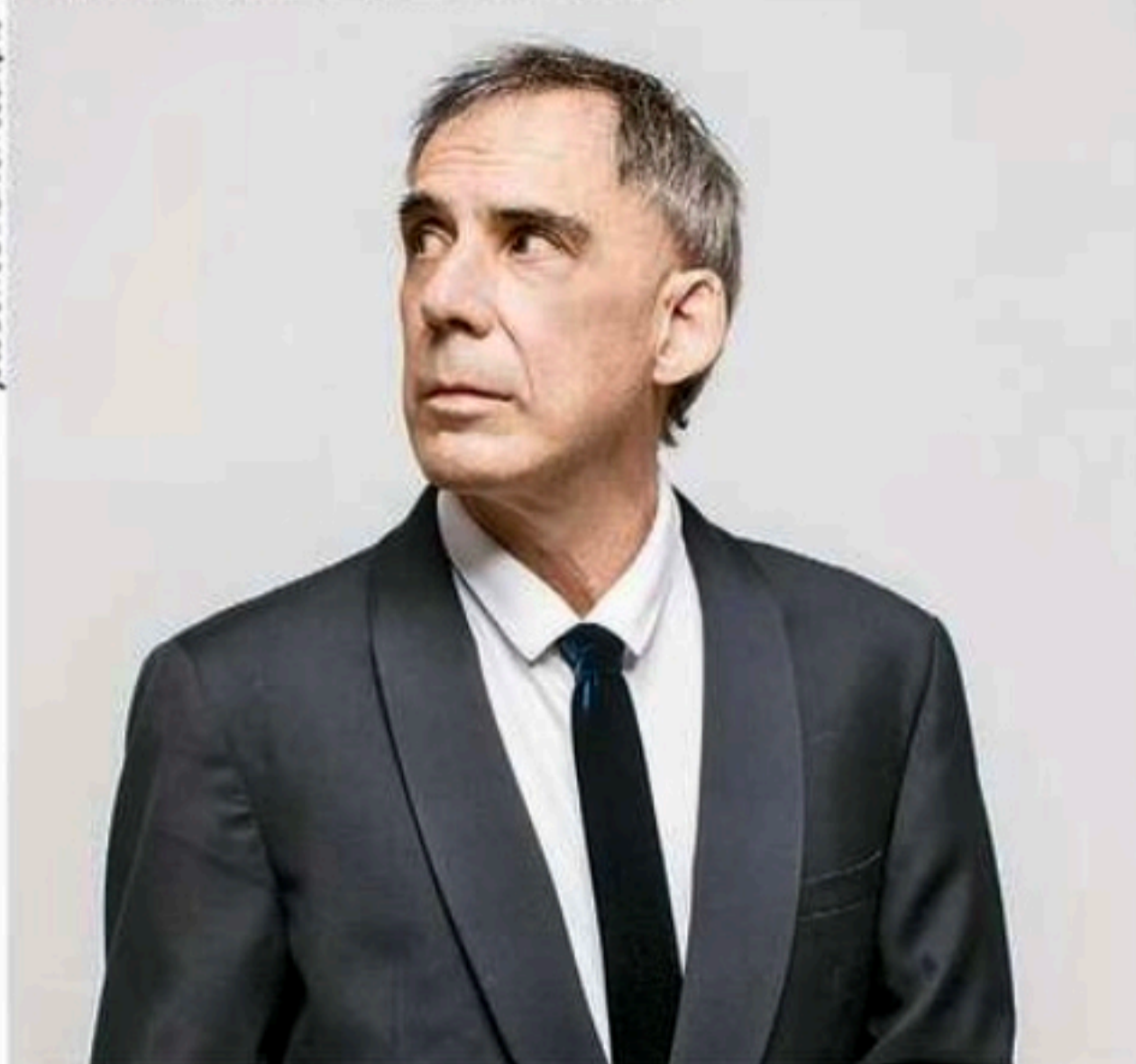
Arnaldo Antunes se apresenta no palco Dominginhos no dia 27 de julho