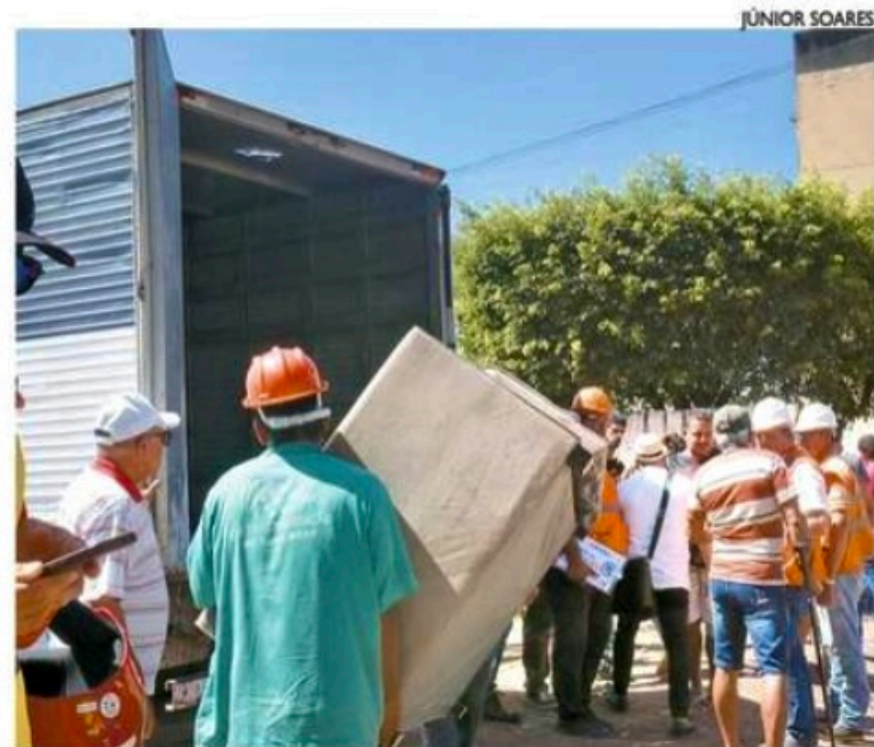
Prédios da quadra em que houve desabamento já foram evacuados