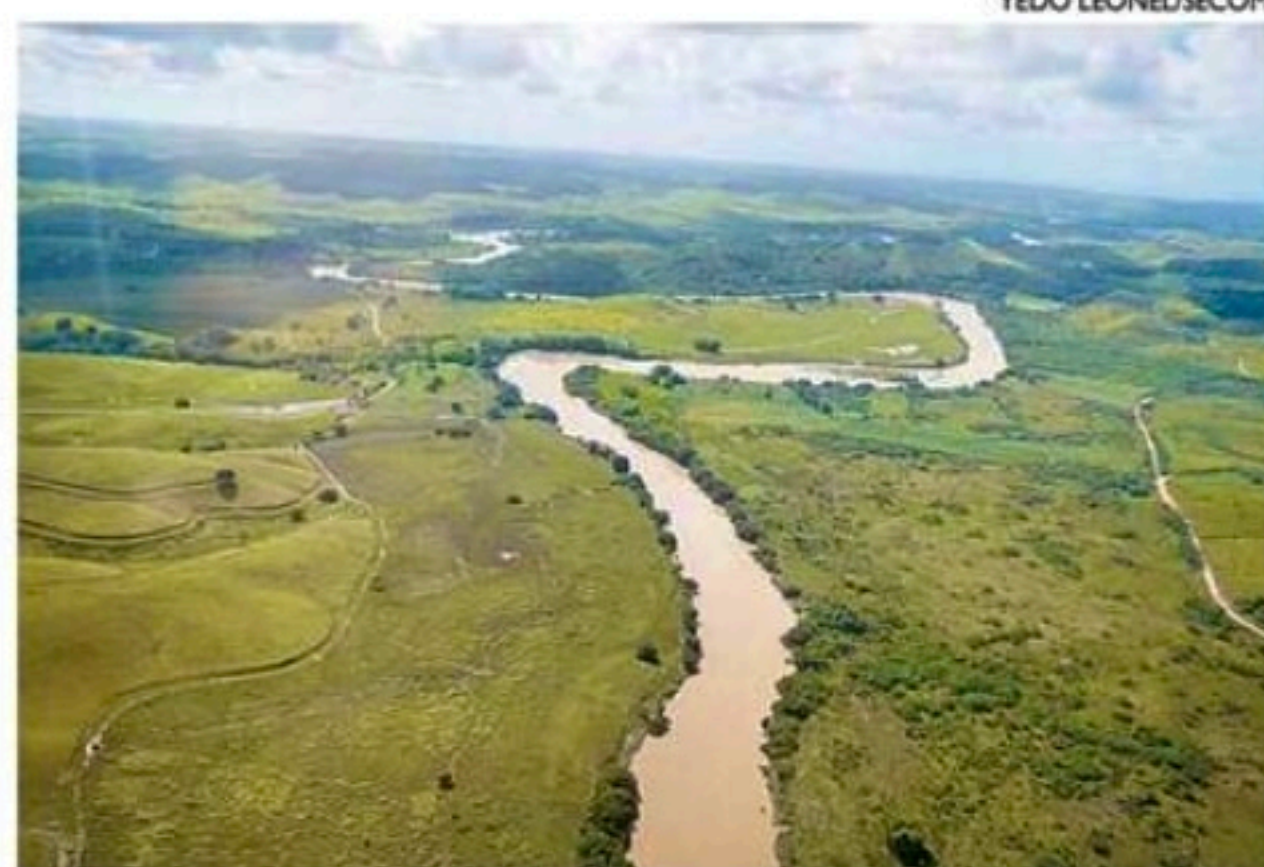
Pernambuco tem 15 municípios em situação de emergência

“A gente vai republicar o decreto para permitir 180 dias, para que haja apoio não só nessas ajudas humanitárias que são de cestas básicas, colchões e insumos, para a população colocar em suas casas, mas também para permitir as obras de reconstrução. A republicação elimina a burocracia e permite respostas mais rápidas para essas cidades e para essa população”, disse a governadora Raquel Lyra, de início.