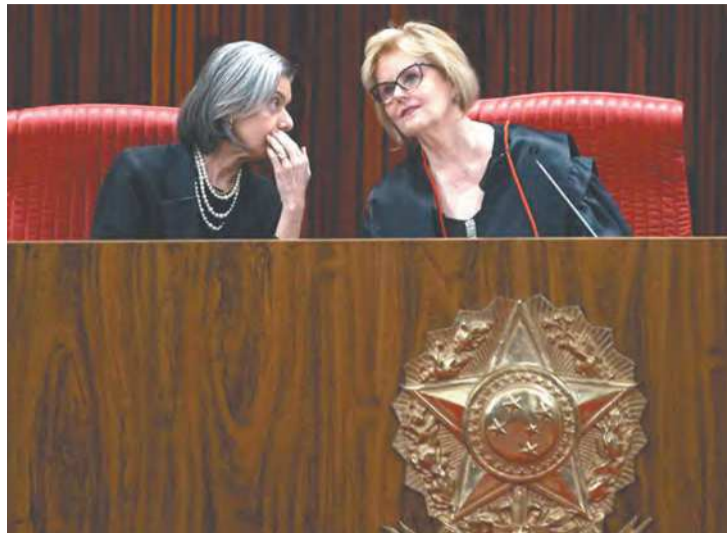
Cármen Lúcia e Rosa Weber foram as últimas a votar