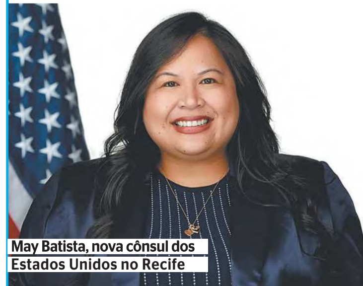
May Batista, nova cônsul dos Estados Unidos no Recife