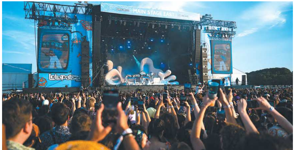
Festivais realizados no Brasil podem receber incentivos que variam entre R$ 63 e R$ 126 mil

Os eventos selecionados de todas as regiões do Brasil serão conhecidos no próximo dia 30 e poderão receber subsídios que variam entre 10 mil a 20 mil libras esterlinas (R$ 63 mil a R$ 126 mil) cada um para reduzir o impacto ambiental. Serão analisados festivais com início este ano e término até 30 de junho de 2024, de diferentes setores