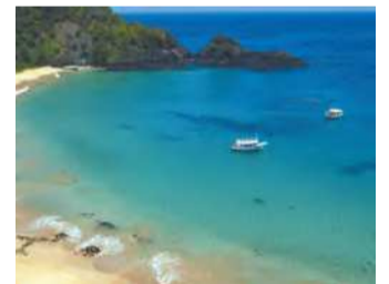
Tributo custa R$ 92,89