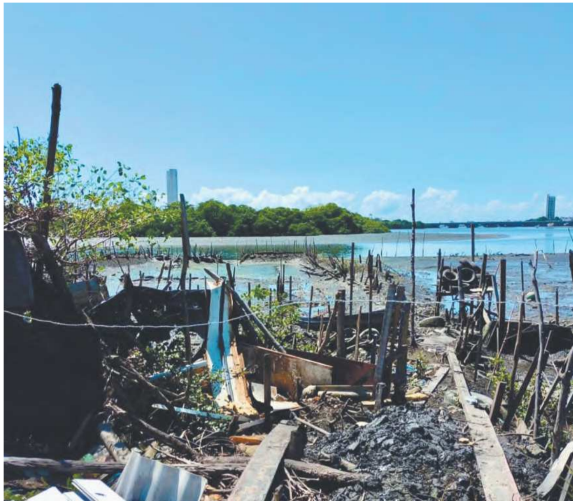
Fiscais acham madeiras e pneus, usados para represar água do manguezal

Segundo a secretária, esse tipo de fiscalização vai continuar sendo feita. Antes dela, no dia 30 de junho, uma equipe semelhante a que foi mobilizada ontem identificou e retirou um viveiro clandestino para criação de camarões no Rio