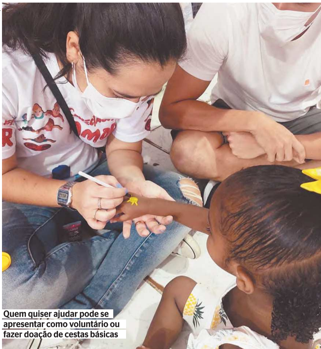
Quem quiser ajudar pode se apresentar como voluntário ou fazer doação de cestas básicas

participando da campanha ‘Conectados pelo Amor’, iniciativa responsável por unir vários grupos sociais do Grande Recife para efetuar ações sociais.