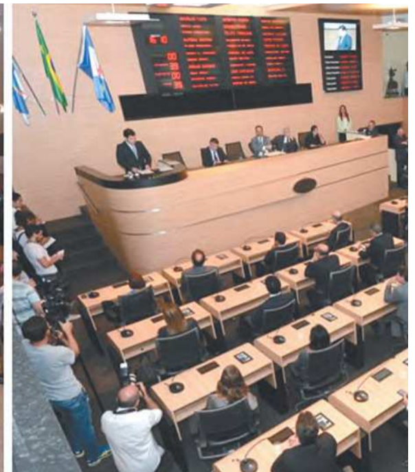
Deputados estaduais e vereadores participaram de reuniões no plenário das duas Casas