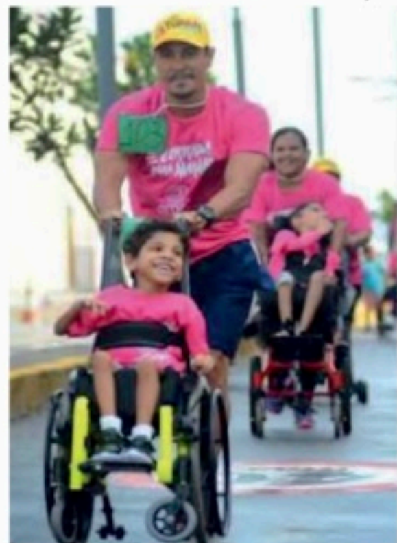
Evento esportivo será no dia 27, em Boa Viagem