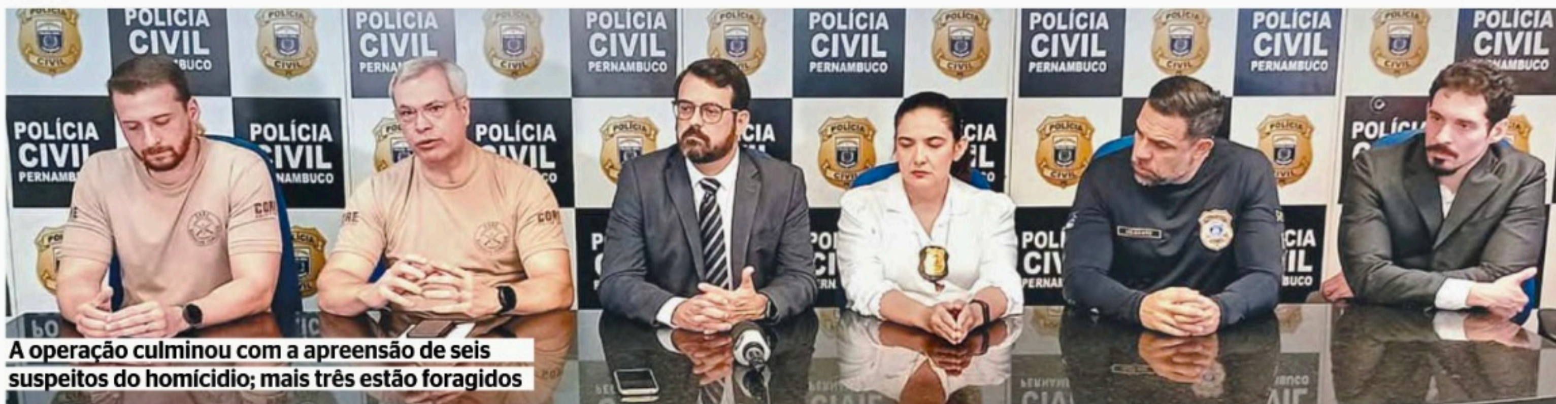
A operação culminou com a apreensão de seis suspeitos do homicídio; mais três estão foragidos