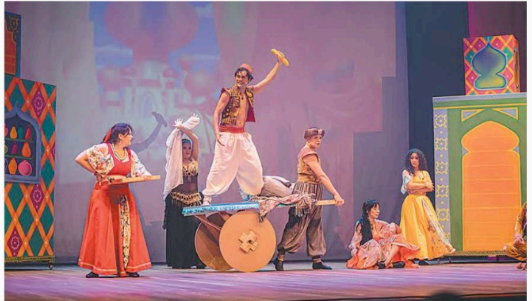
A trama retrata os desafios encarados por um inteligente jovem de coração puro

ta a história do jovem Aladdin e da princesa Jasmine. Na produção, os artistas prometem encantar o público com uma apresentação onde música e dança se misturam entre as atuações. O elenco pernambucano é dirigido por Kleber Valentim e as coreografias são assinadas por Kassio Soares e Carlos Blue. A trama retrata os desafios encarados por um inteligente jovem de coração puro e que esbanja simpatia, que mesmo ao viver a pobreza nas ruas de