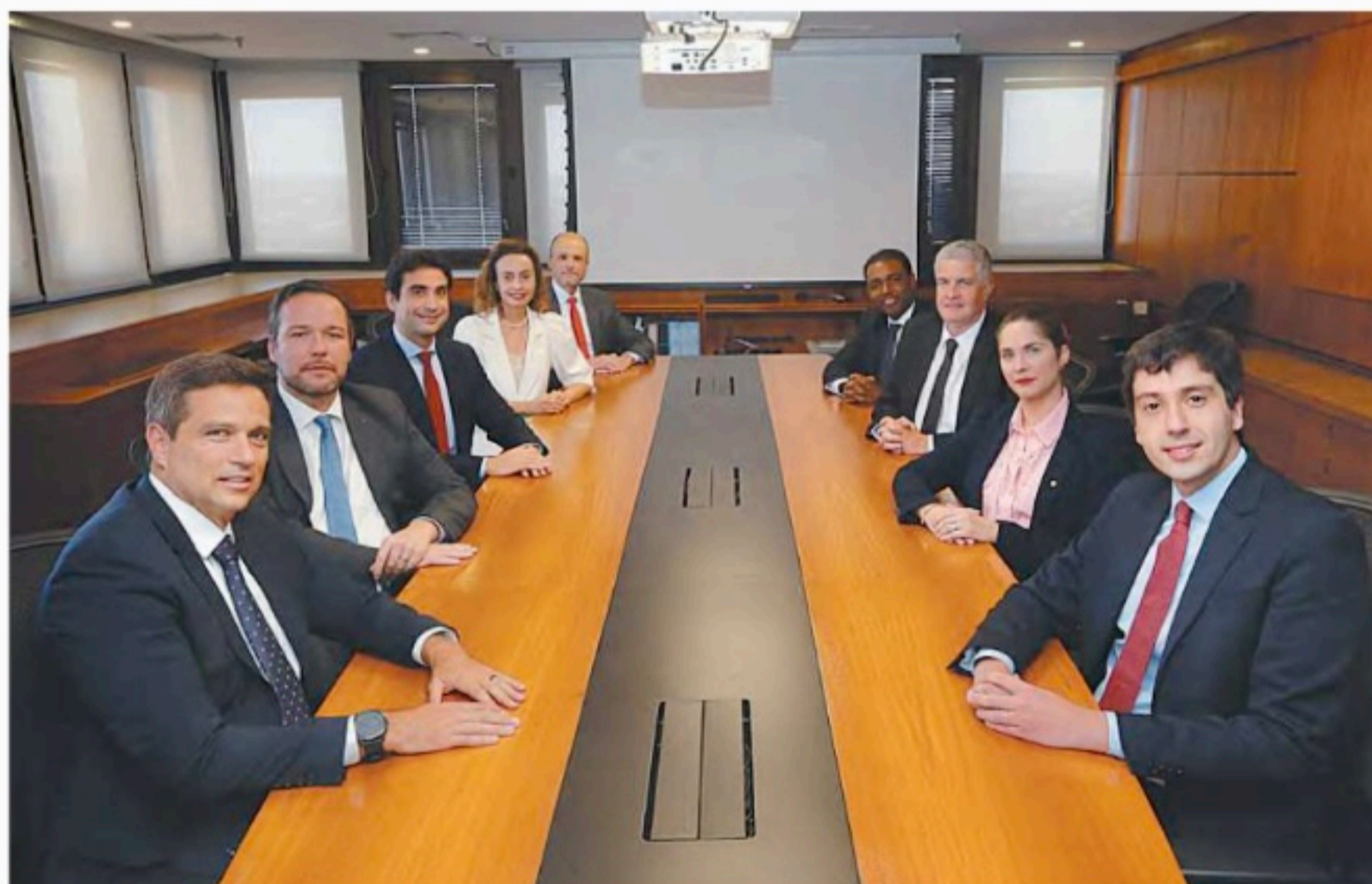
Colegiado aprovou corte de 0,50 ponto percentual na Selic por cinco votos a quatro

Para as próximas reuniões, o Copom prevê cortes de 0,5 ponto percentuais. O colegiado avalia esse ritmo adequado para manter a política monetária contracionista (juros que desestimulam a economia) necessária para controlar a inflação.