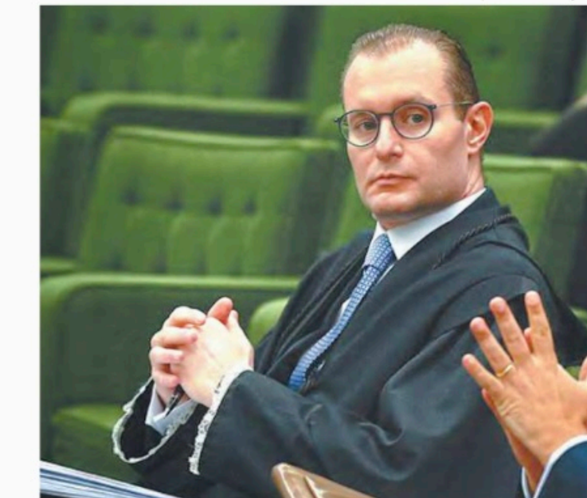
São aguardadas cerca de 350 pessoas na solenidade

A presidente do STF, Rosa Weber, abrirá a sessão. Em se-