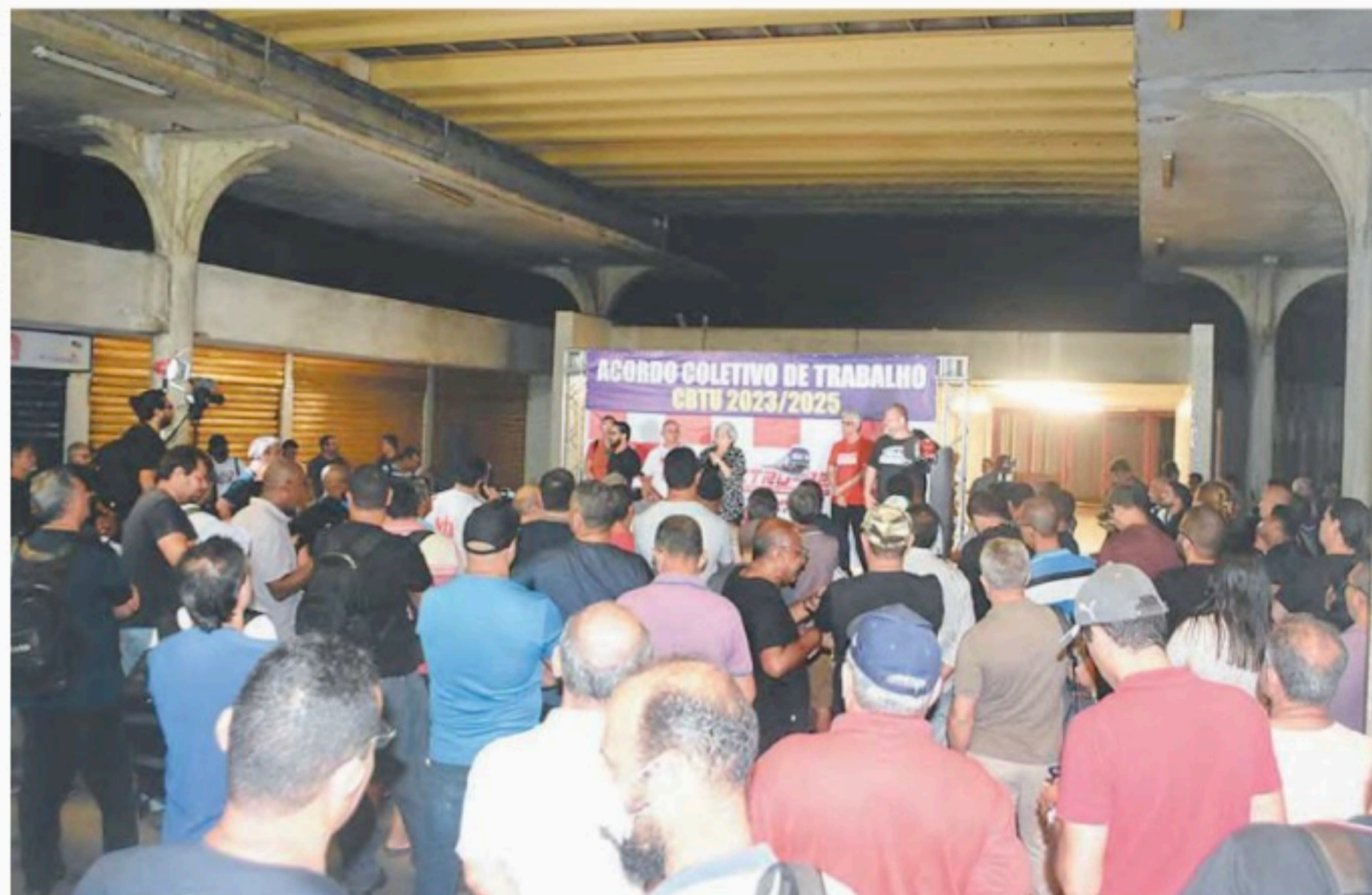
Categoria quer, além de reajuste salarial, garantias de que o modal não será privatizado