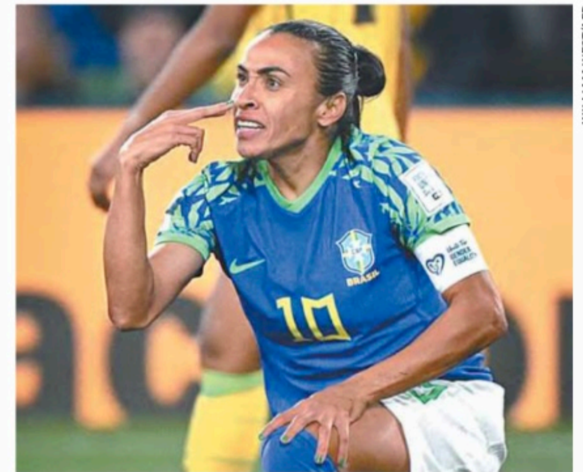
Rainha Marta se despediu dos Mundiais com a seleção

Após o 0 a 0 com a Jamaica ontem, as brasileiras caíram precocemente na primeira fase da Copa do Mundo, fato que só aconteceu em 1991 e 1995