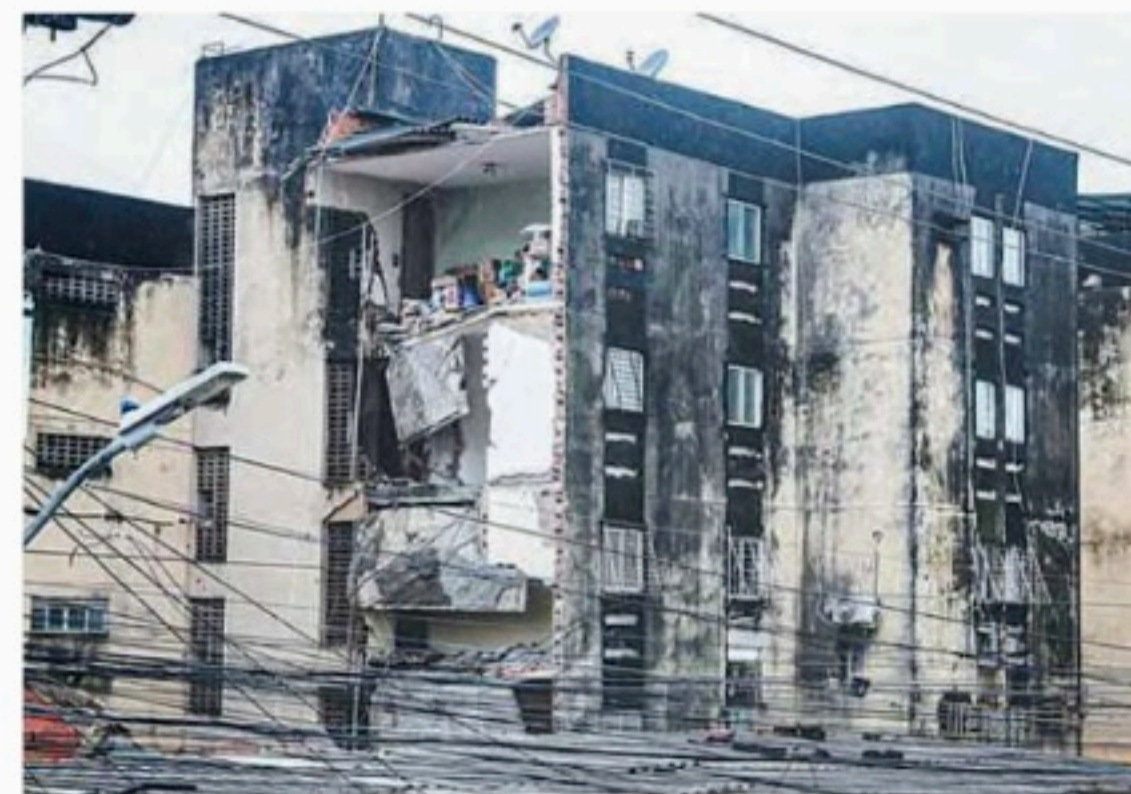
Desabamento em Paulista matou 14 pessoas, no dia 7