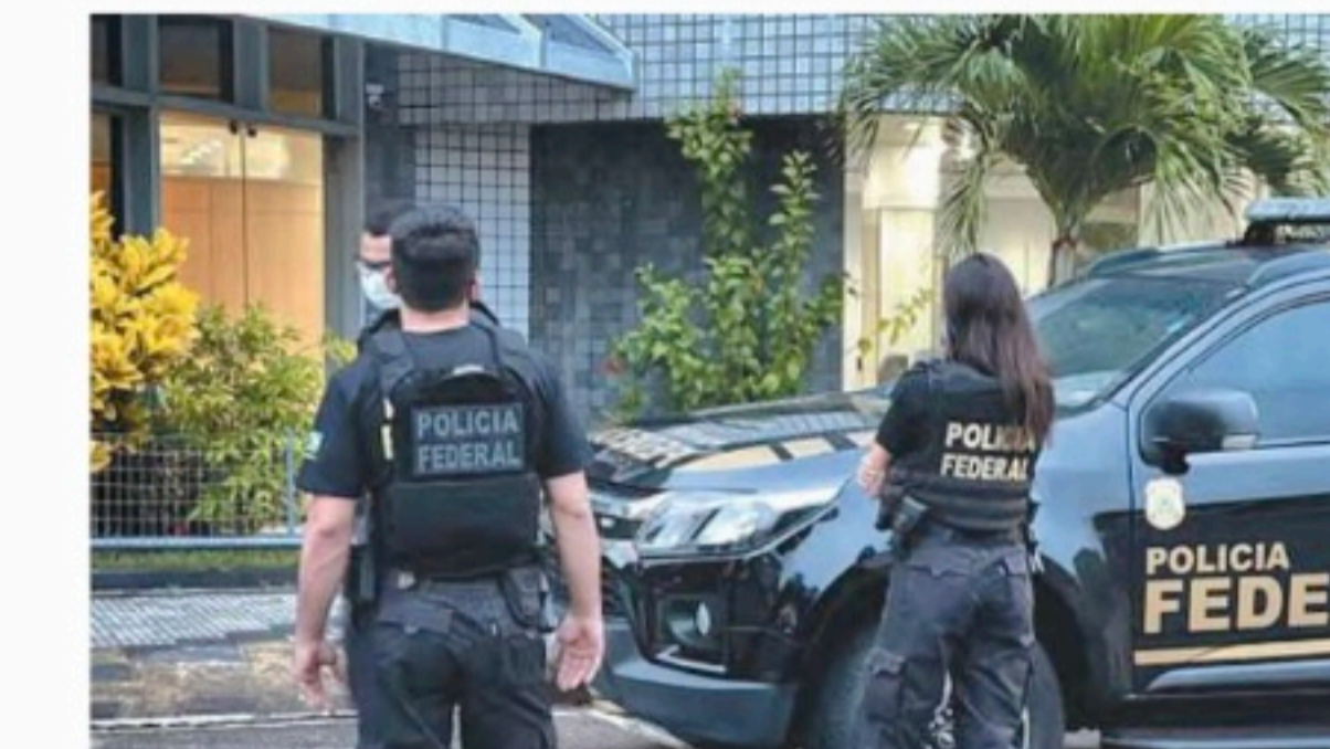
PF aponta fraude de pelo menos R$ 192 milhões na SDA

A operação busca cumprir nove mandados de busca e apreensão, sendo três no Recife, um no Jaboatão dos Guararapes,