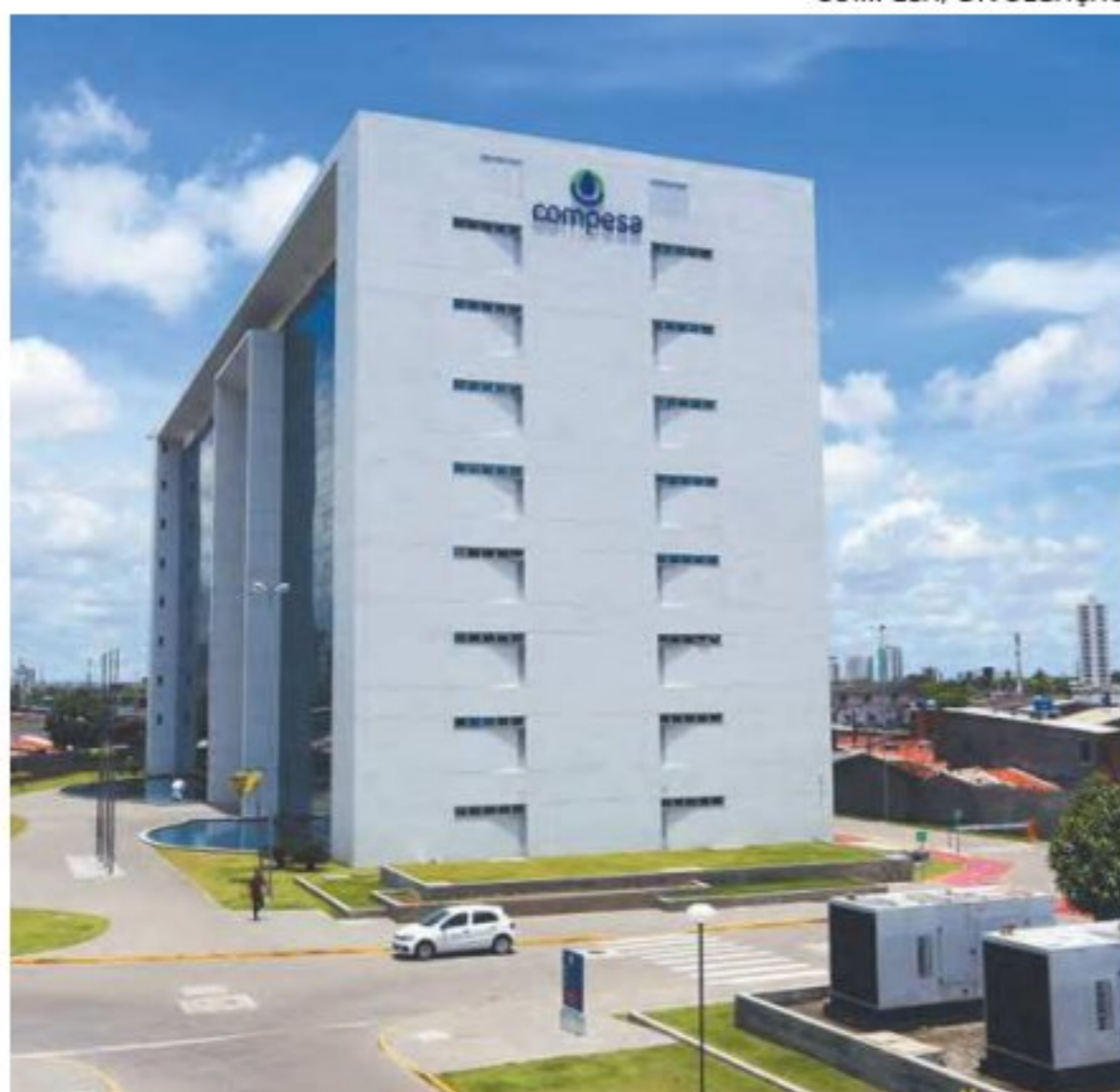
Mais de 20 municípios tiveram abastecimento suspenso

As operadoras de celular tiveram os serviços impactados pe-