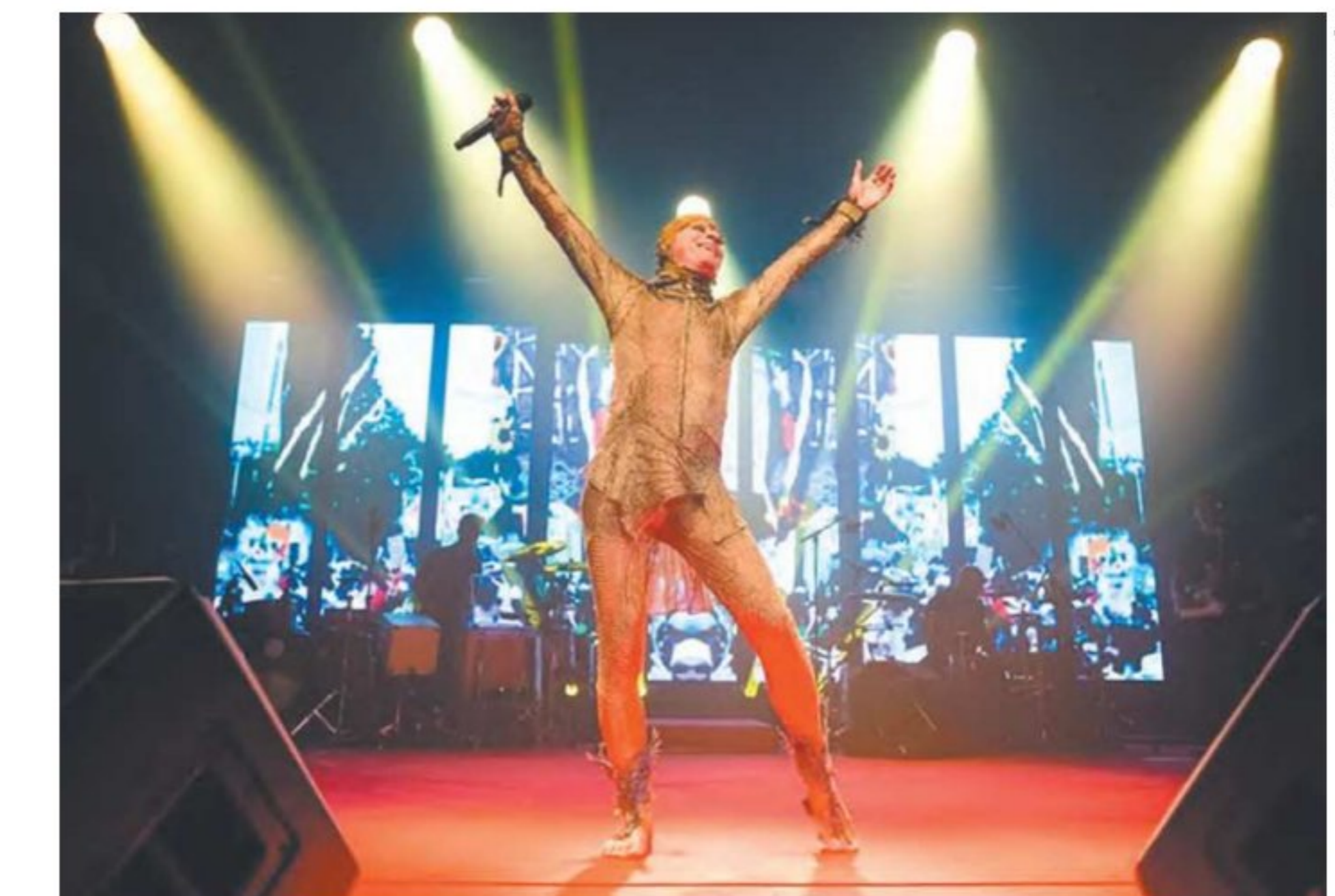
Aos 82 anos de idade, Ney transborda energia no palco à moda Secos & Molhados

O cantor volta a se apresentar para o público pernambucano depois de quatro anos desde sua última performance, realizada em 2019, na primeira versão do “Bloco na Rua”. Com um histórico de shows no estado que remonta à década de 1980, Ney se sente praticamente em casa. “Voltar a Pernambuco após quatro anos, e novamente com Bloco na Rua, é algo que me enche de alegria. Essa terra tem um lugar especial no meu co-