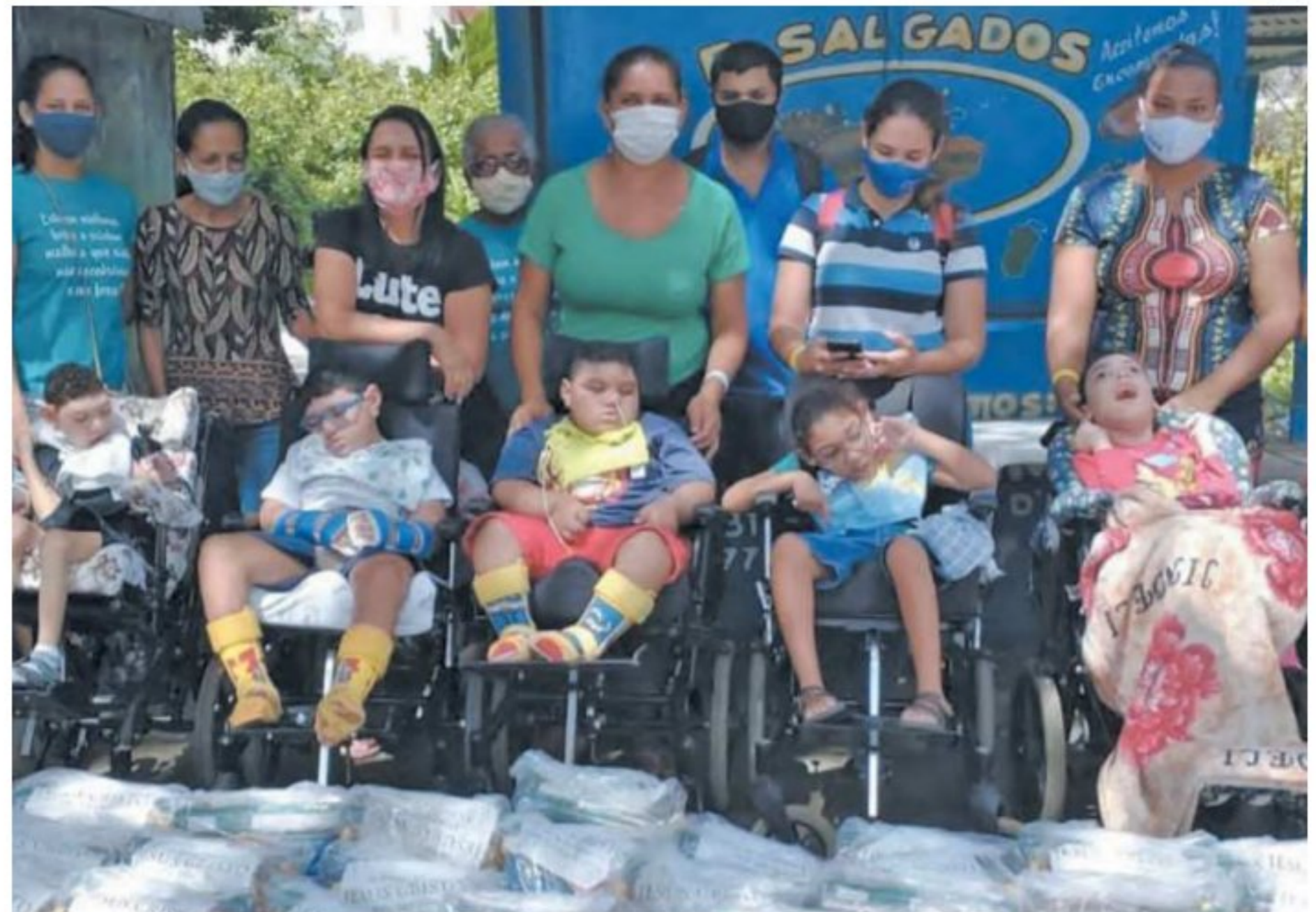
Ao todo, 80 mil pessoas já se cadastraram como voluntários nos meios do Transforma

doações que são direcionadas para as iniciativas sociais são alimentos, materiais de higiene e cadeiras de rodas. As pessoas interessadas no voluntariado, em cadastrar uma OSC ou contribuir com doações podem entrar em contato pelo Insta-