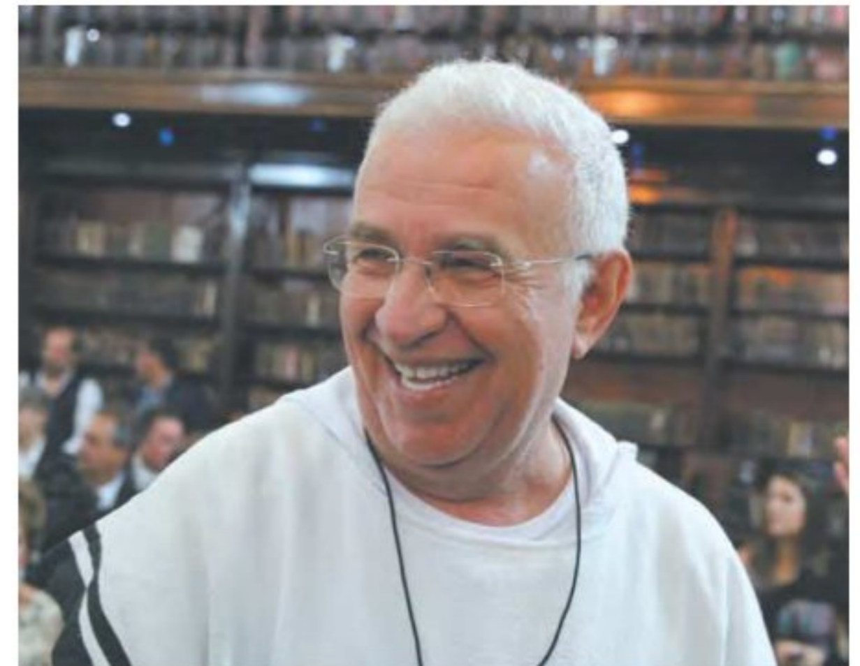
Preso, religioso passou mal e foi transferido ao Recife