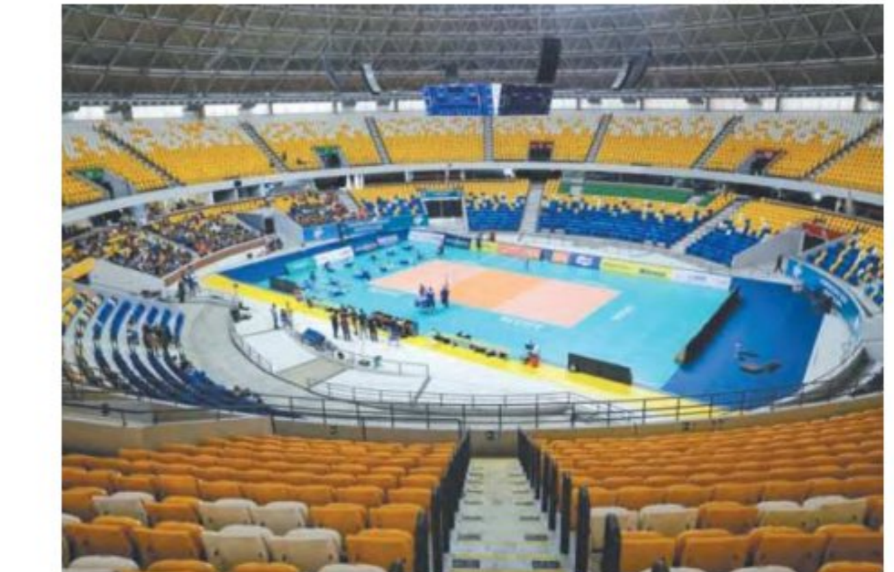
Abertura será sábado, com Brasil x Chile no Geraldão

"Sediamos a Copa América masculina de basquete ano pas-