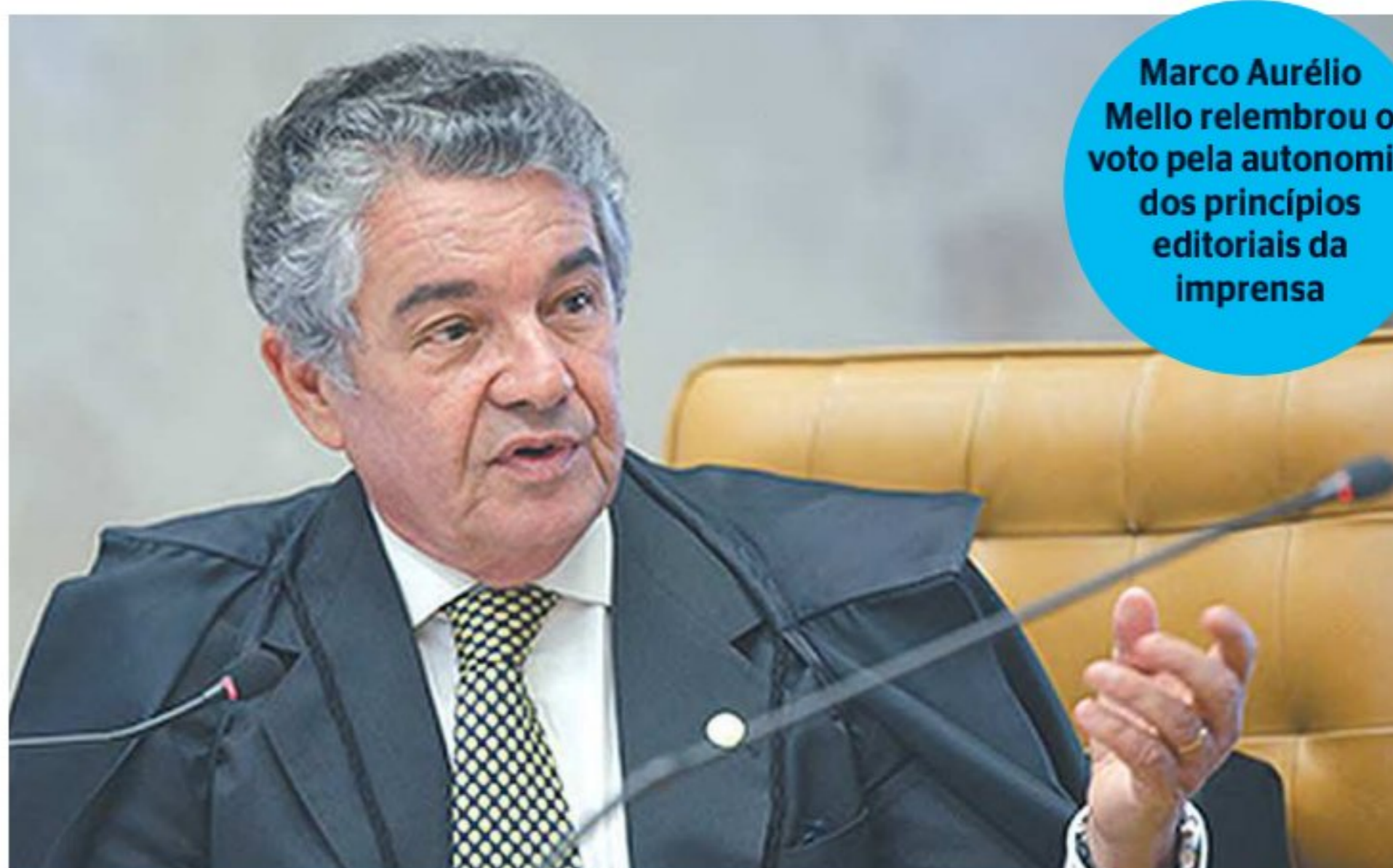
Marco Aurélio Mello lembrou o voto pela autonomia dos princípios editoriais da imprensa

Apesar de iniciar um diálogo com o PSD, deputados da base não creem que a governadora Raquel Lyra deixará o PSDB para integrar o partido de André de Paula. A expectativa recai sobre a filiação da vice-governadora Priscila Krause à legenda.