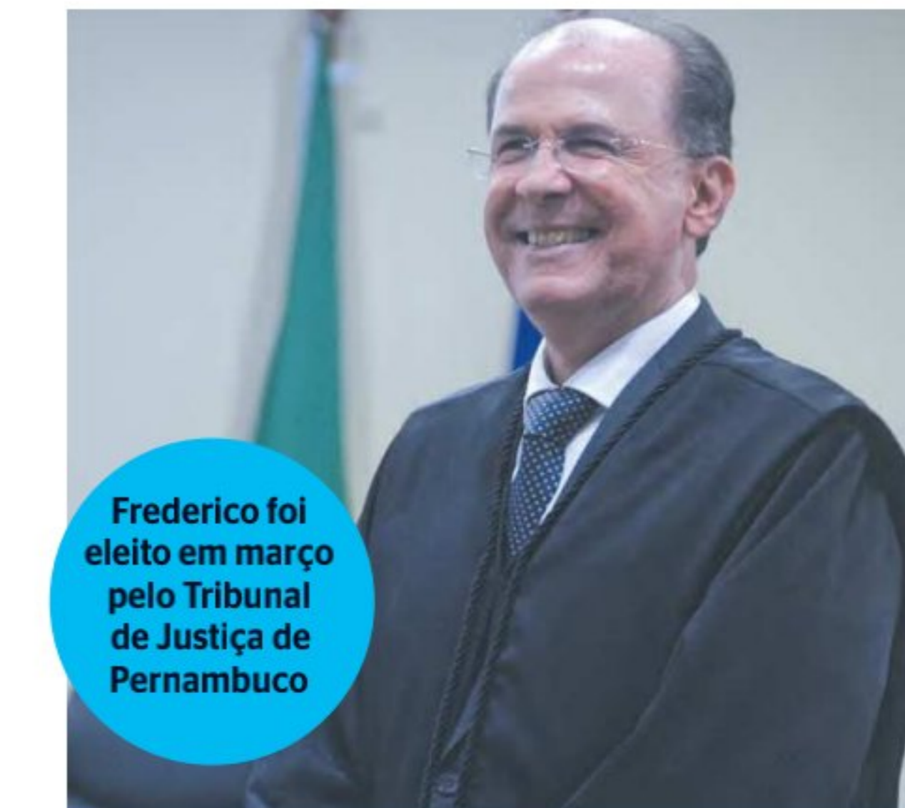
Frederico foi eleito em março pelo Tribunal de Justiça de Pernambuco

Líder do Movimento dos Trabalhadores Sem Terra (MST), João Pedro Stedile prestou depoimento ontem (15) na Comis-