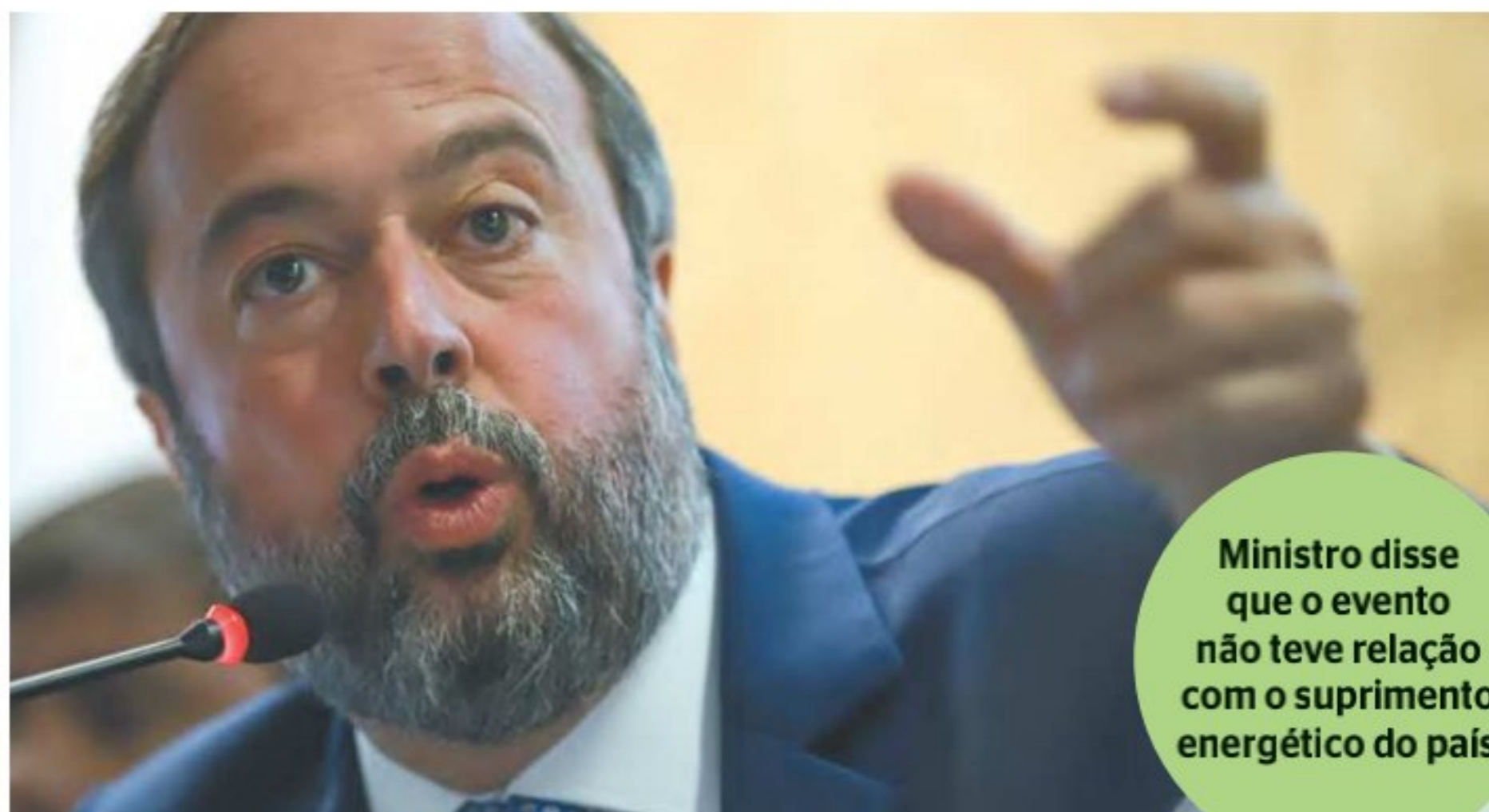
Ministro disse que o evento não teve relação com o suprimento energético do país

"Para acontecer um evento dessa magnitude nós temos que ter tido dois eventos concomitantes em linhas de transmissão de alta capacidade, ou seja, é extremamente raro que aconteça o que aconteceu", disse, em entrevista coletiva.