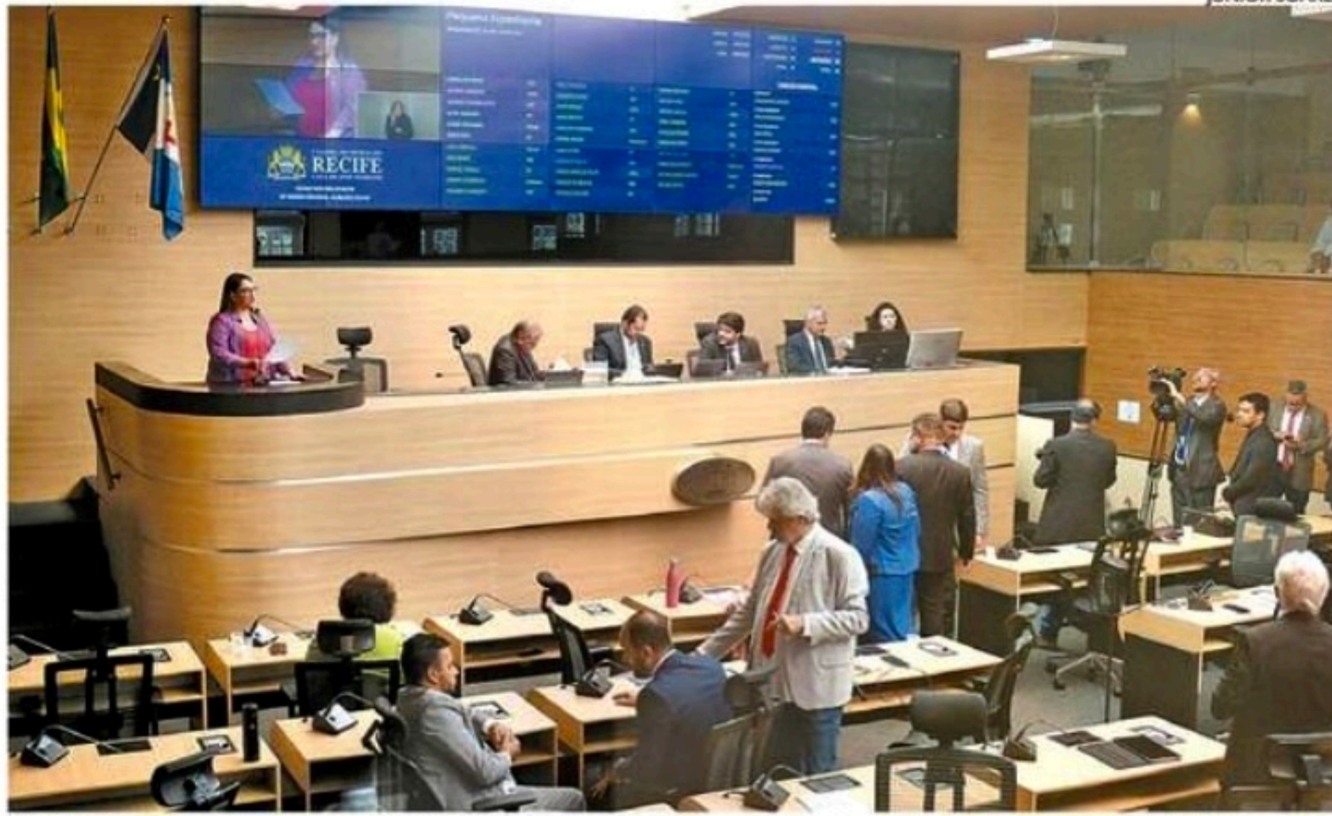
Legislativo municipal votará propostas que tratam das receitas e despesas do Executivo do Recife

Além da LOA e do PPA, neste segundo semestre os parlamentares também se dedicarão às matérias de sua autoria e a outras propostas do Poder Executivo.