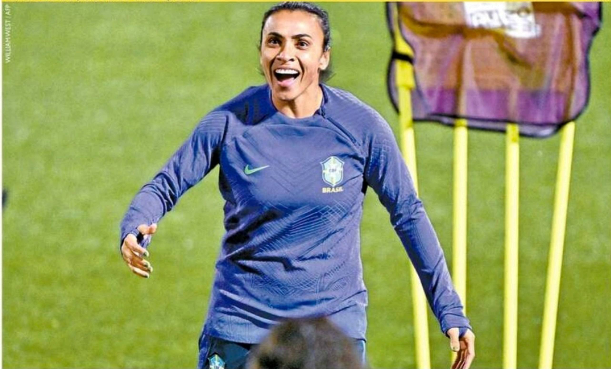
Estrela da Seleção está otimista para "decisão" contra a Jamaica, às 7h de hoje, pela Copa Feminina. Pela Série B, jogam Vila Nova x Sport