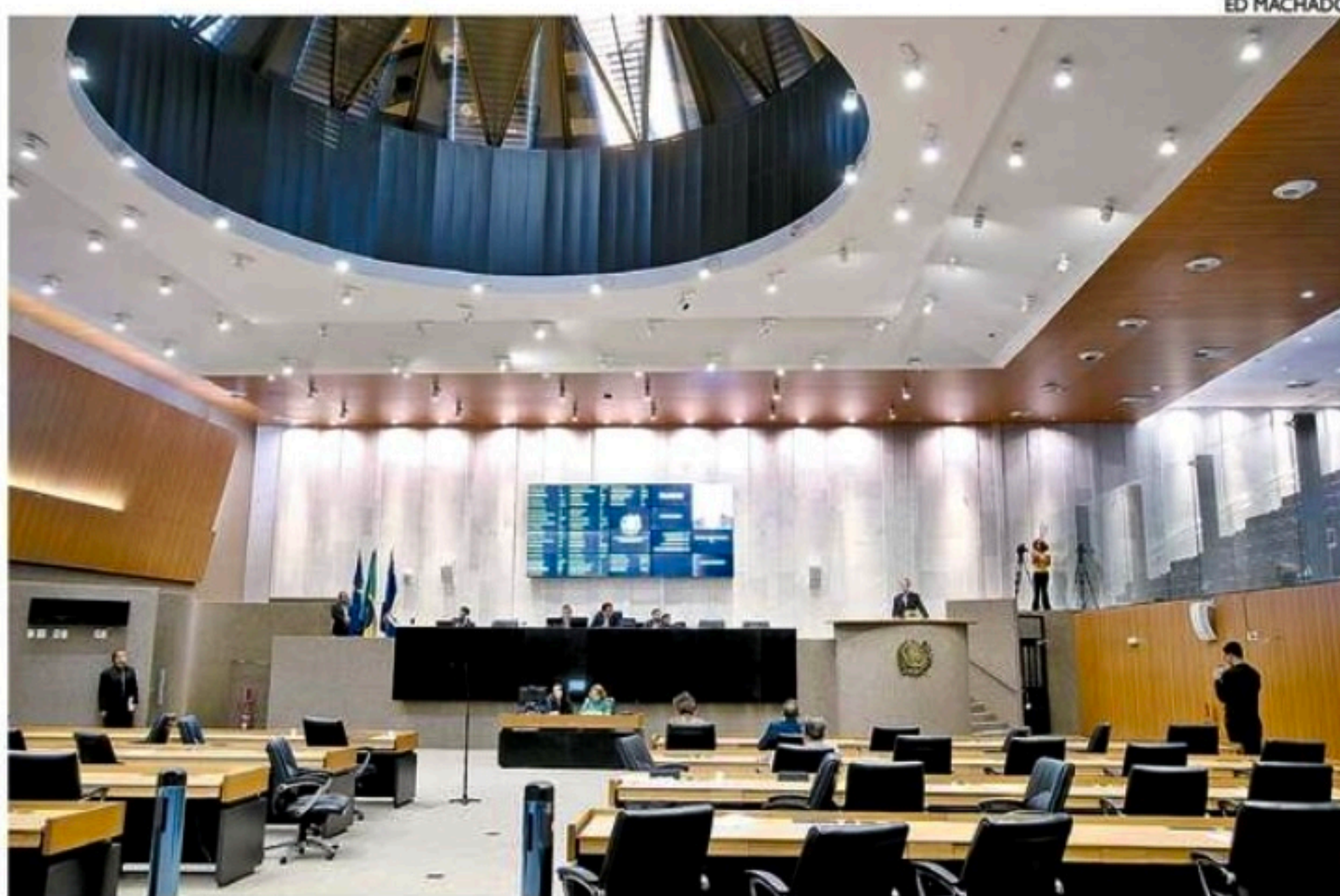
Na sessão de retomada das atividades da Casa, programa de segurança pública foi assunto mais comentado

Na Ordem do Dia do legislativo, o assunto mais comentado na Tri-