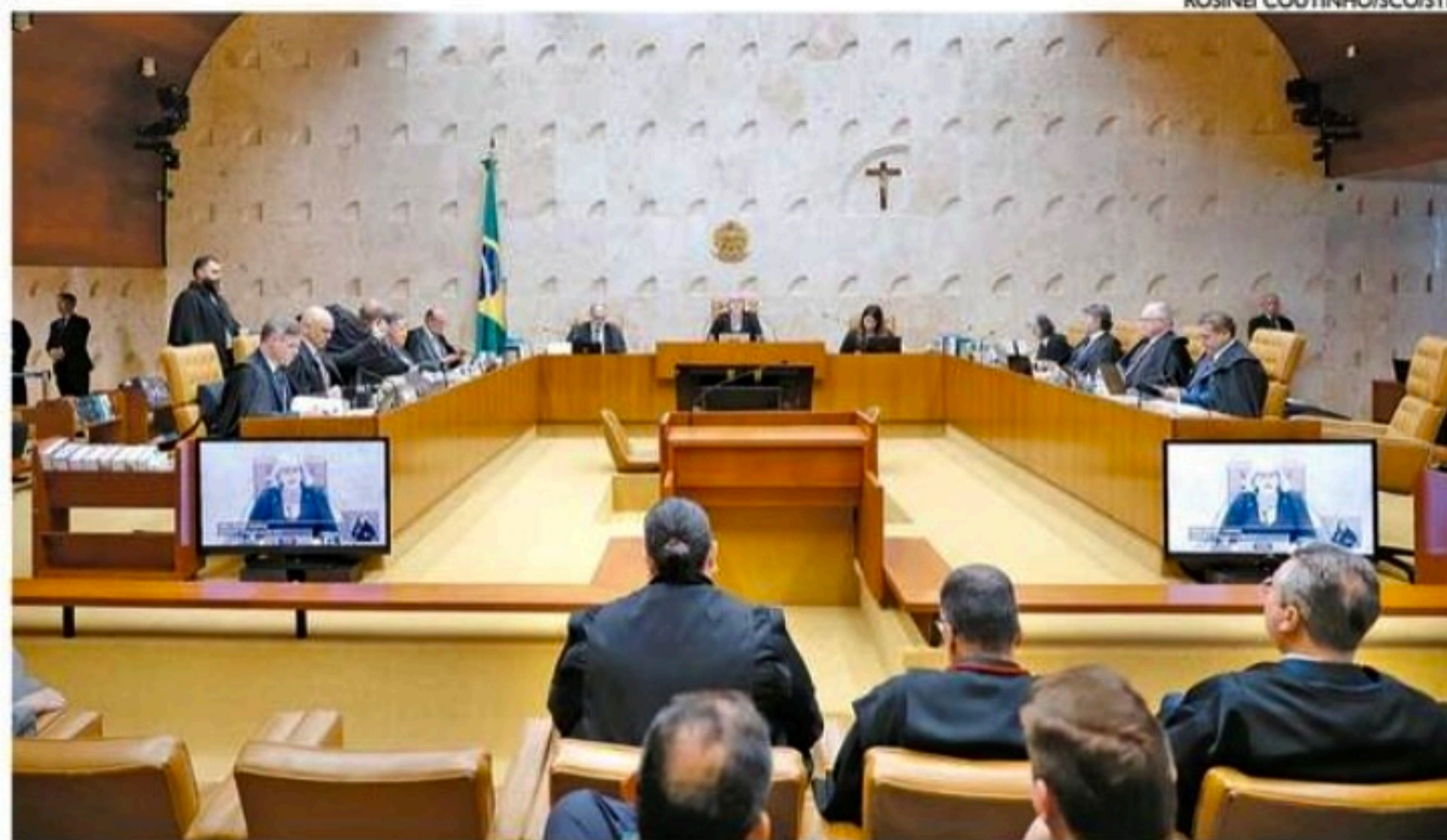
Tribunal decidiu que argumento fere princípios da dignidade, da proteção à vida e da igualdade de gênero