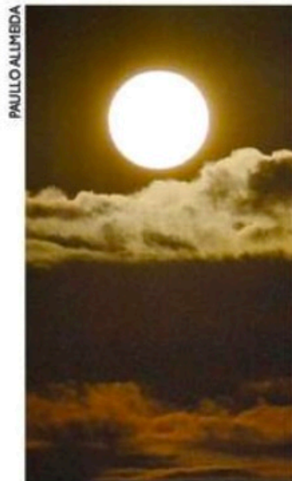
No Alto da Sé, fenômeno foi observado por telescópios