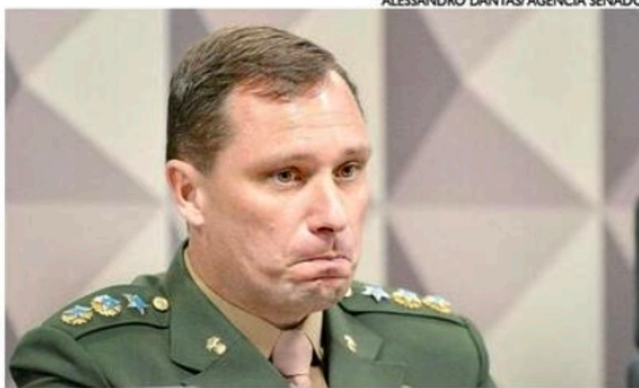
O tenente-coronel apresentou esta semana o seu terceiro advogado

A coluna de Carlos Britto é publicada de segunda a sexta.