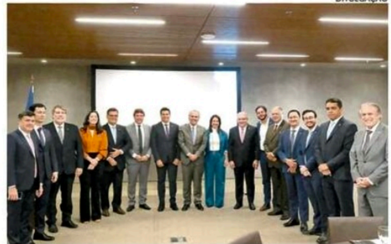
Raquel defendeu união política em defesa dos interesses do Estado

A governadora apresentou pontos da Reforma Tributária capazes de reduzir desigualdades regionais. Defendeu que o Conselho Federativo, que decidirá a distribuição dos recursos do imposto criado pela proposta da reforma, deve ter representação das unidades federativas. A gestora acredita que o Fundo Nacional de Desenvolvimento Regional deve ser repartido a partir do PIB invertido, para permitir que os estados com menor arrecadação recebam mais recursos.