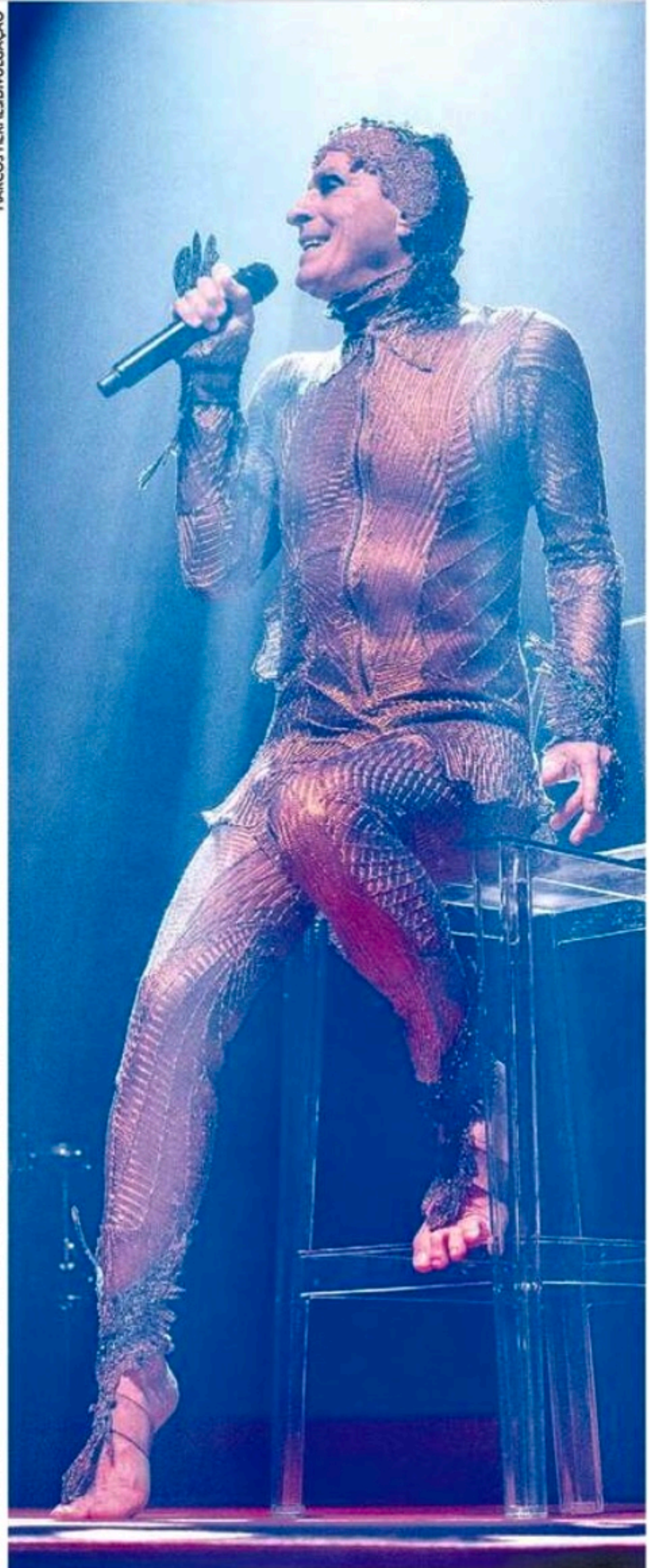
Ney sobe ao palco em tom de celebração e repertório com acréscimos