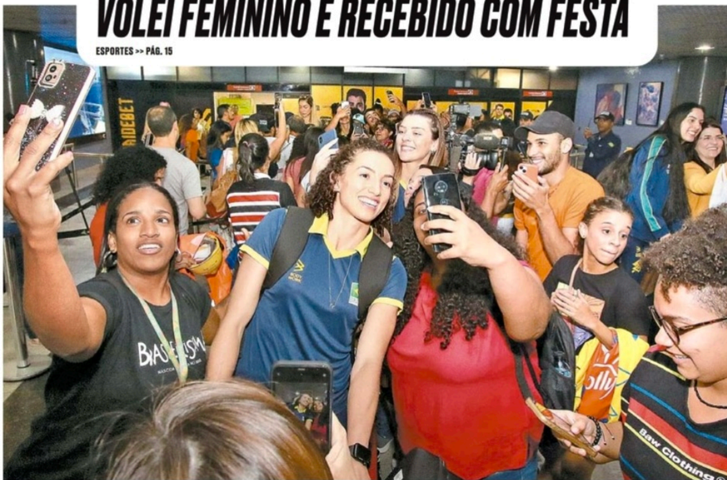
Dezenas de torcedores contagiaram as meninas da Seleção, que chegam para disputar o Sul-Americano, no Geraldão