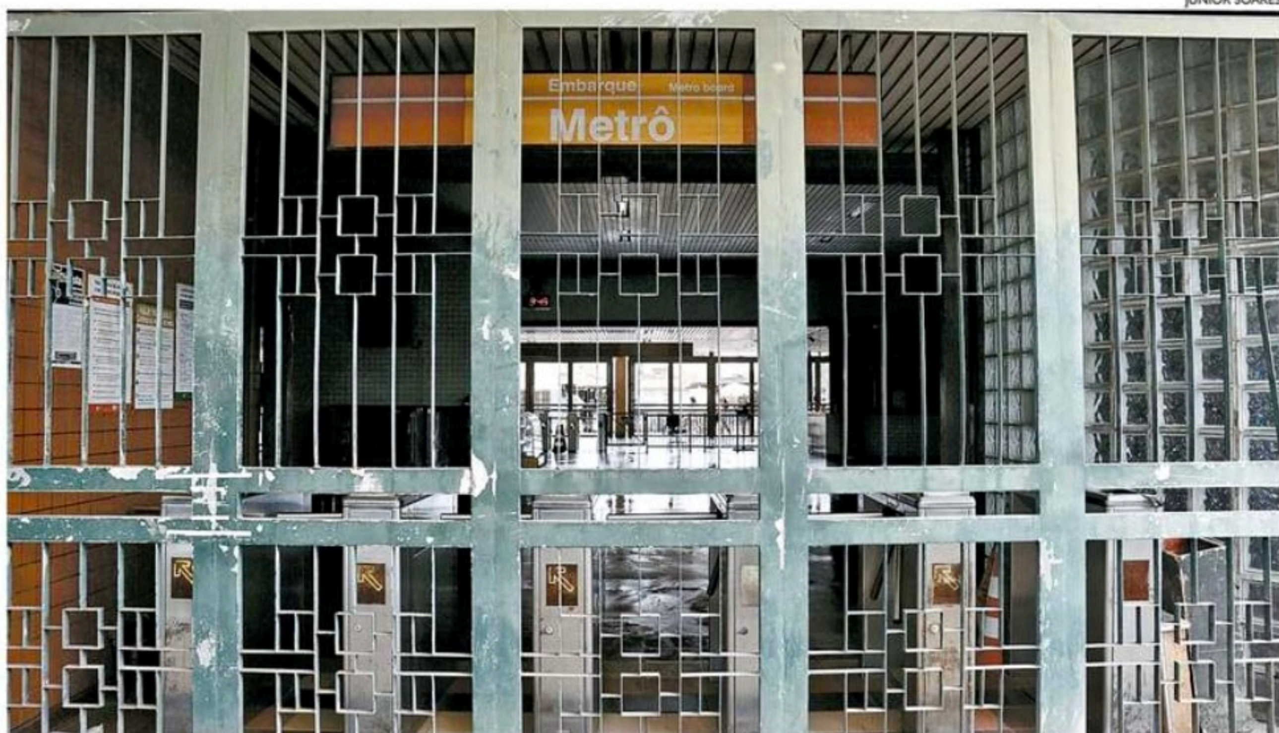
Greve dos metroviários do Recife chega hoje ao sétimo dia sem definições, estações fechadas e ato em Brasília