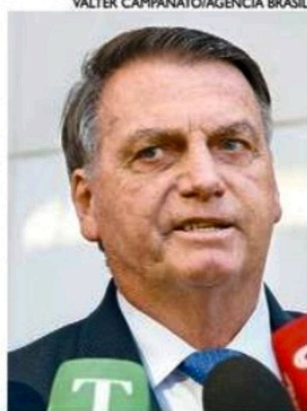
"Mande, qual o problema?", disse o gestor ao responder jornalista

A coluna de Carlos Britto é publicada de segunda a sexta.