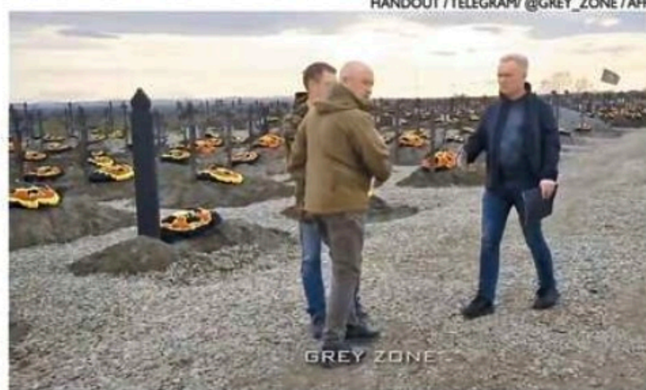
Prigozhin, de marrom, estava entre os mortos da queda do avião

Prigozhin aparecia no vídeo usando uniforme militar camuflado, colete a prova de balas com cartuchos de munições, e com um fuzil nas mãos. Ao fundo, era possível ver uma caminhonete com outros homens armados.