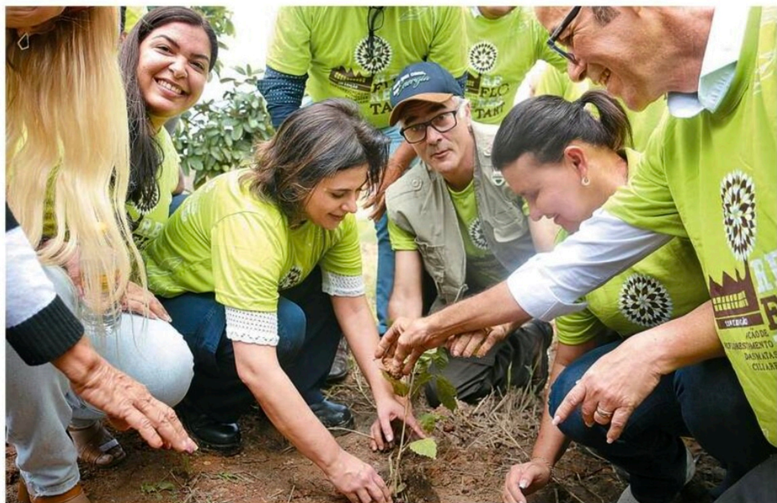
Ação de reflorestamento promovida pela Usina São José Agroindustrial reuniu diretores, além de autoridades municipais e estaduais

Realizada pela Usina São José Agroindustrial, em Igarassu, Reflorestar chega à 11ª edição com plantio de mudas nativas da Mata Atlântica